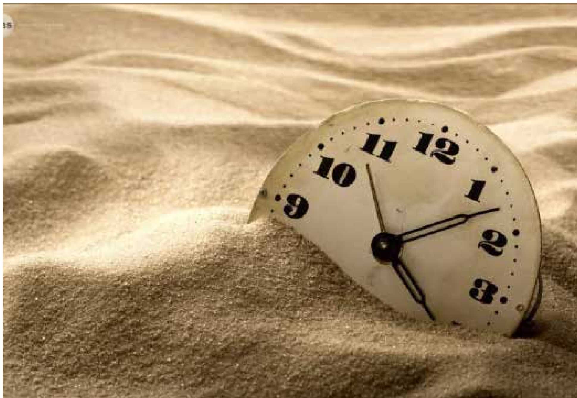
La pérdida de tiempo es parte del círculo vicioso del subdesarrollo.

do de ambos, y no pasa nada. El ideal es elevar este zarpazo a la categoría de contravención, cuando menos. Reaccionemos en contra de quienes nos quitan horas de vida, de trabajo, de ocio. Exijamos un mejor trato de parte del Estado y de los empresarios, ante el tiempo de la gente, que debe ser sagrado, respetado. Razón tenía y tiene el inventor y científico Benjamin Franklin al señalar que «el tiempo es dinero». A lo cual agregé «¿Amas la vida? Pues si amas la vida no malgastes el tiempo, porque el tiempo es el material del que está hecha la vida». El tiempo perdido en trámites y turnos dañinos jamás podremos recuperarlo, nos hunde más en el subdesarrollo.