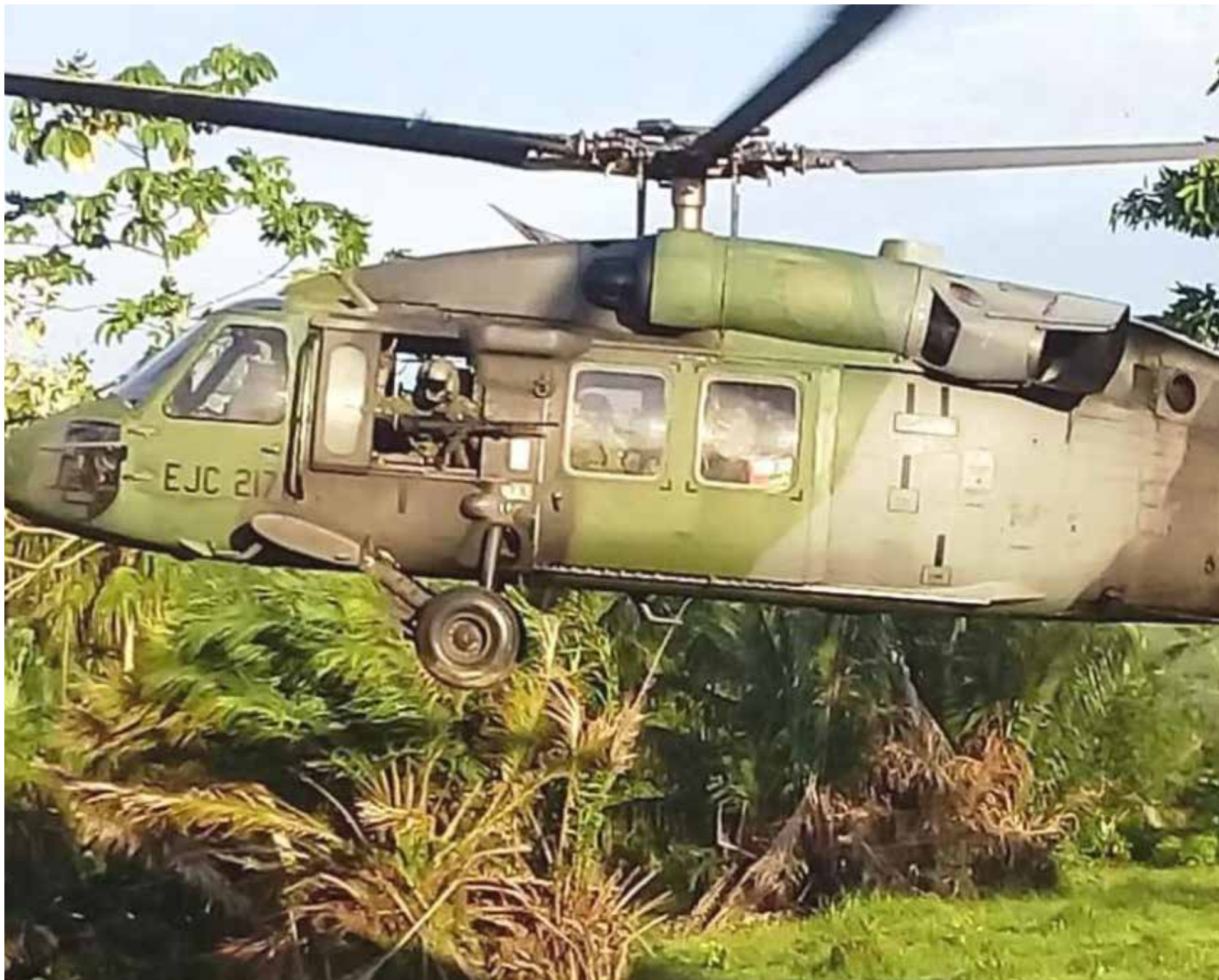
Confirman nueve militares fallecidos en accidente de helicóptero. No encuentran los cuerpos de los tripulantes.

El helicóptero UH-60 Black Hawk de Aviación del Ejército de matrícula EJC 2176, con 17 militares abordo que combatan a las disidencias de las FARC, cayeron al Río Inirida.