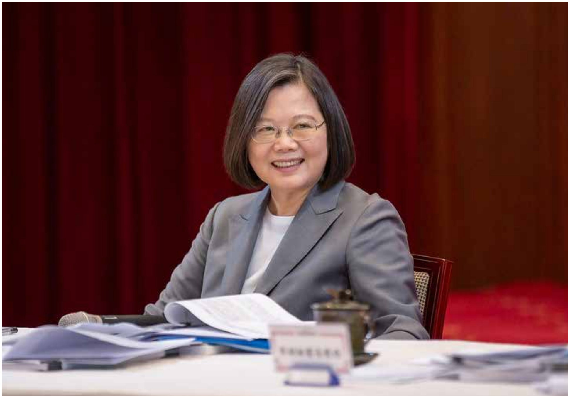
La presidenta de Taiwán Tsai Ing-wen

La presidenta de Taiwán Tsai Ing-wen manifestó su descontento debido a la aprobación por parte de China de una ley de seguridad nacional para Hong Kong, haciendo hincapié en que Pekín ha roto su promesa de permitirle mantener un alto grado de autonomía durante al menos 50 años.