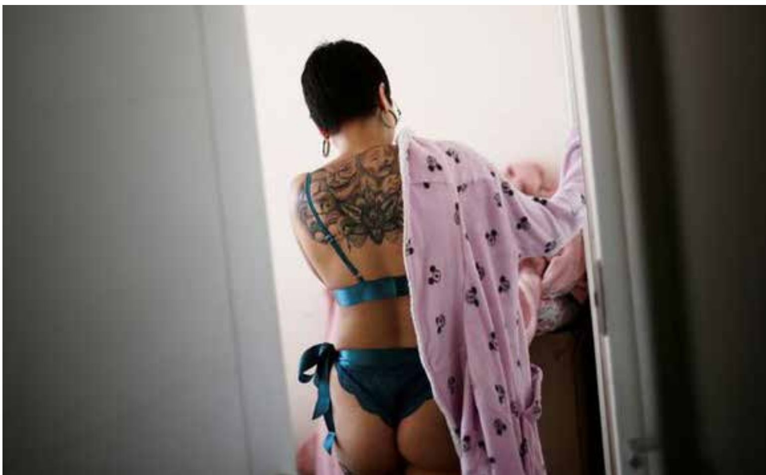
Una trabajadora sexual de 24 años, se pone una bata mientras se prepara para tener un encuentro con un cliente.

«Si calculamos que atendió a un promedio de dos o tres clientes por día durante 10 días, son 20 o 25 personas que pueden haber contraído el virus e infectado a otros en su casa o en el bar», dijo el alcalde de Modica, Ignazio Abbate, al diario La Repubblica. «Hago un llamado a aquellas personas que han tenido relaciones con esa mujer: