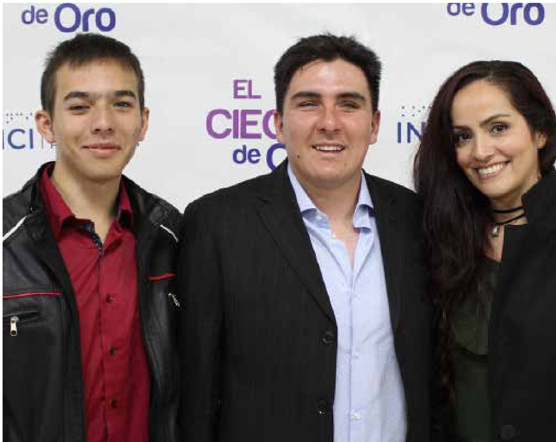
Los ciegos también pueden ser actores