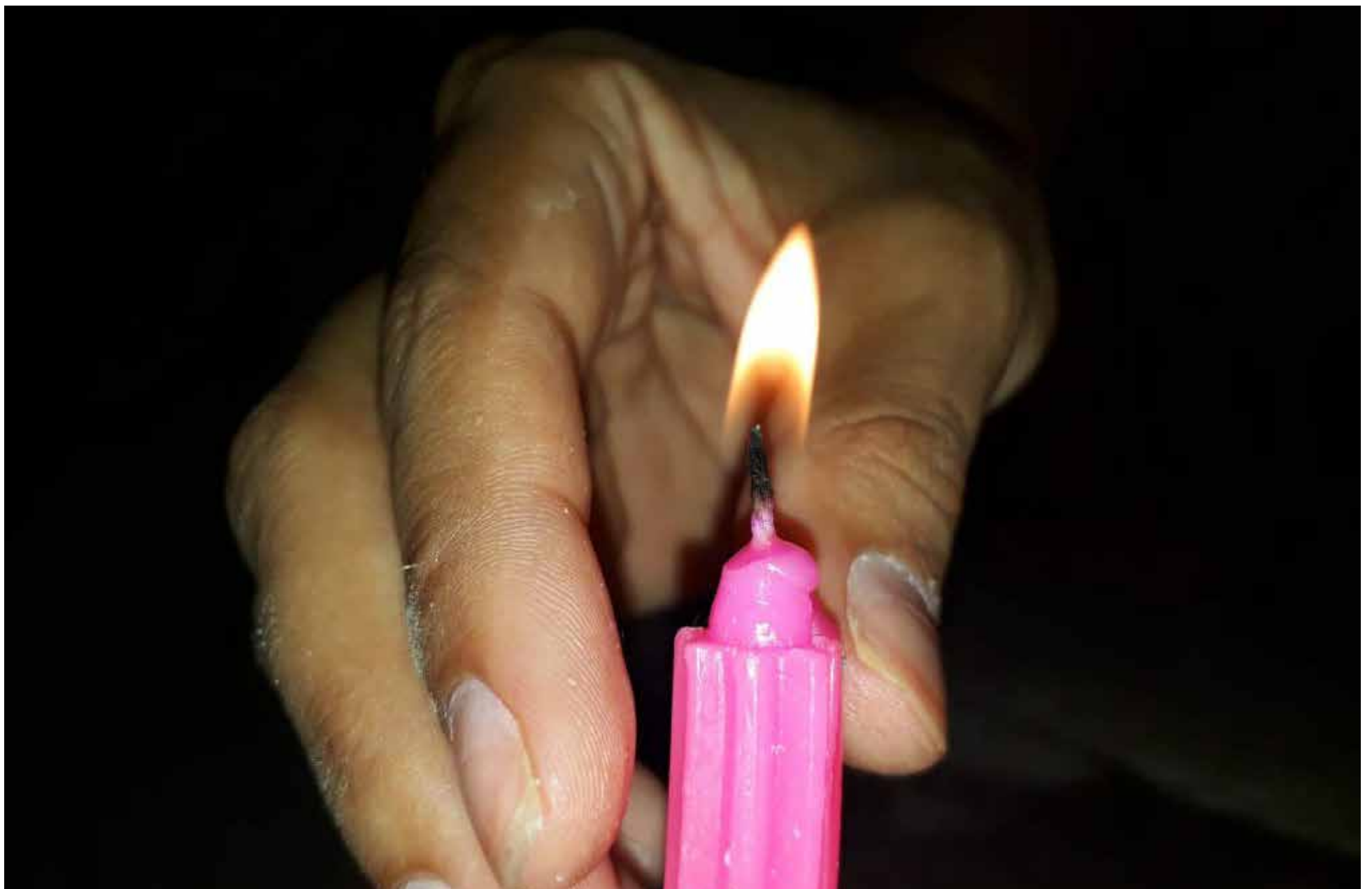
Día de las velitas en pandemia. Adiós a las multitudes.