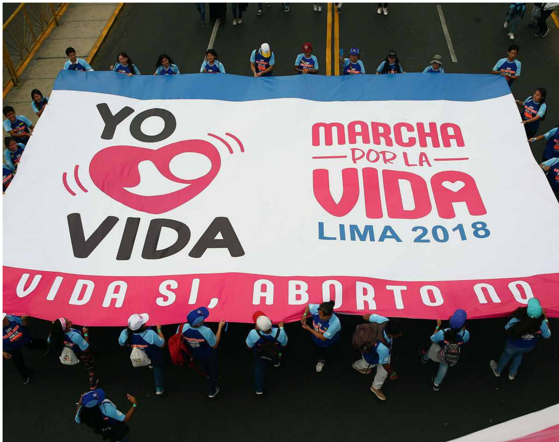
Iglesia contra el aborto