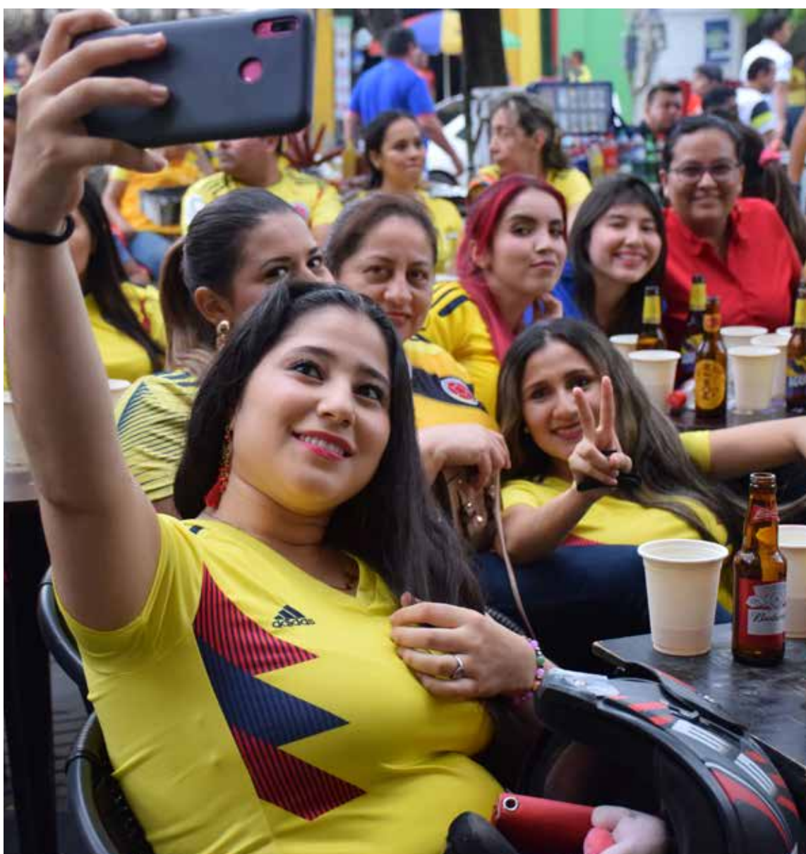
Las hinchas a pesar de la crisis en la selección Colombia siguen confiando en sus figuras.

nados. Y menos los medios, tan proclives estos a hipotecar sus conceptos por defender un gusto, sin analizar proyectos. Es labor de los dirigentes serios, elegir un guía de proyectos deportivos, por capacidad y conocimientos y no títere de sus caprichos e intereses.