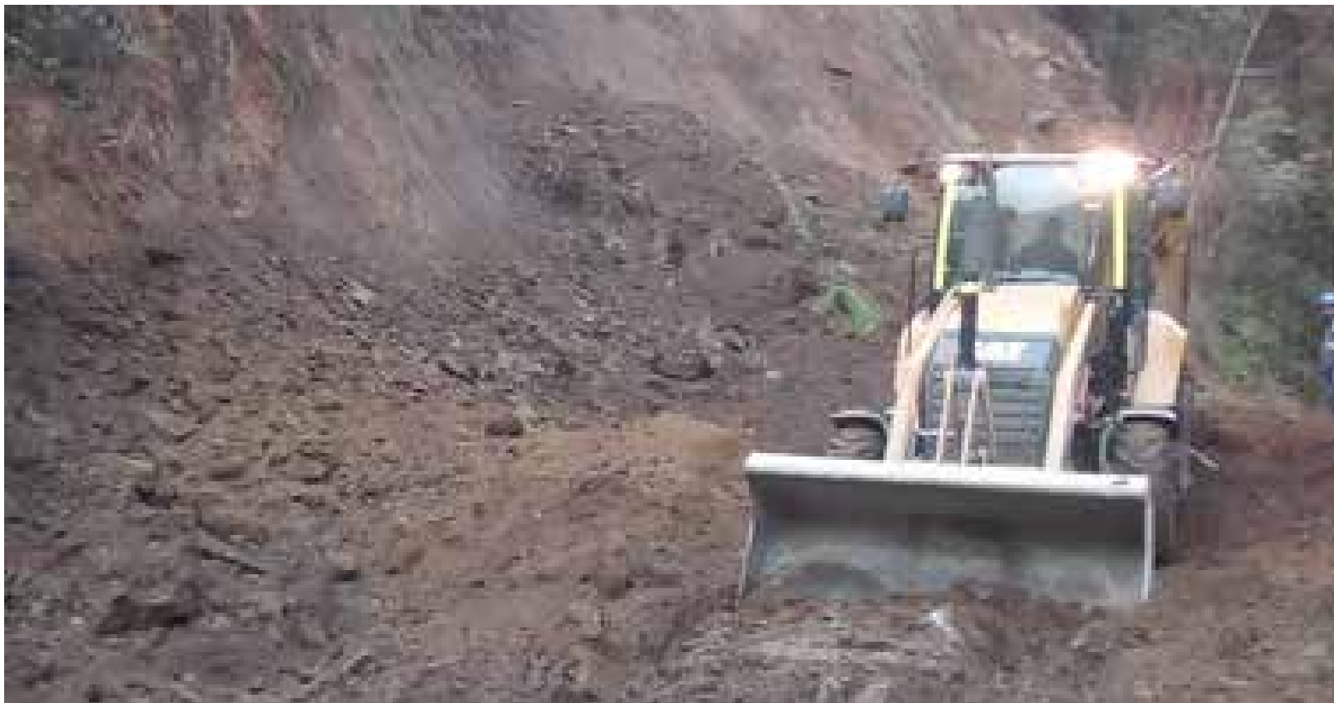
Varios derrumbes se ha presentado durante los últimos días.