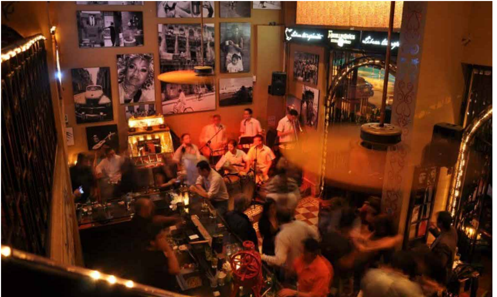
El goce pagano, un sitio de bohemia en la fría Bogotá