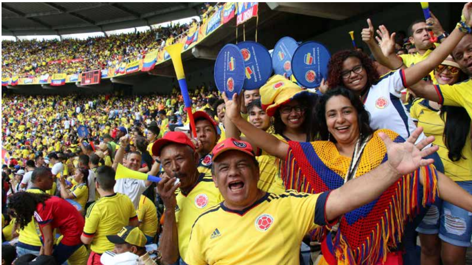
Hoy se perfila un entrenador colombiano como sustituto, EL ENTRENADOR DEL PUEBLO, lo que no obedece al convencimiento de los dirigentes sino al clamor de los hinchas.

Nunca a un entrenador lo nombraron los aficio-