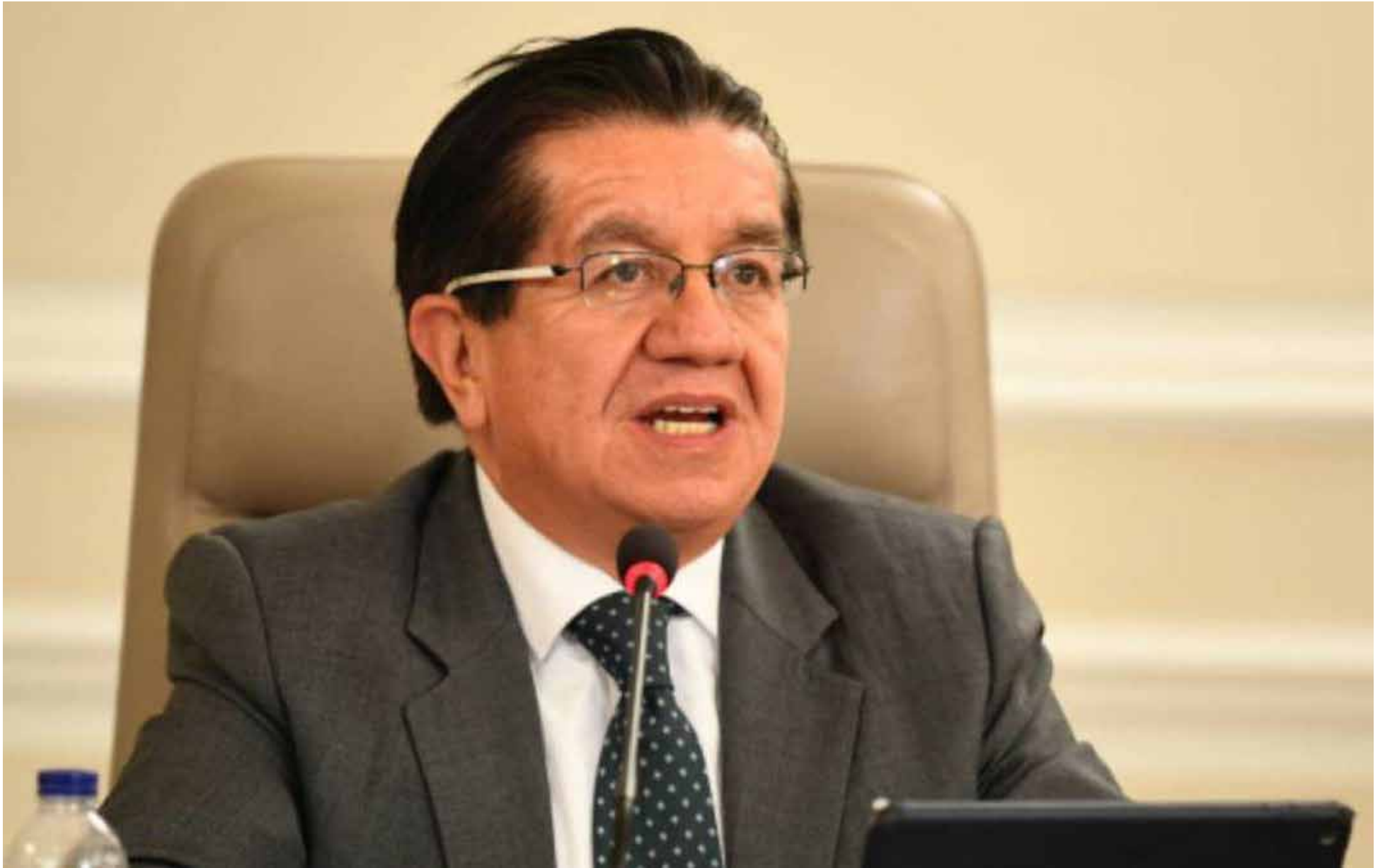
Fernando Ruiz, ministro de Salud