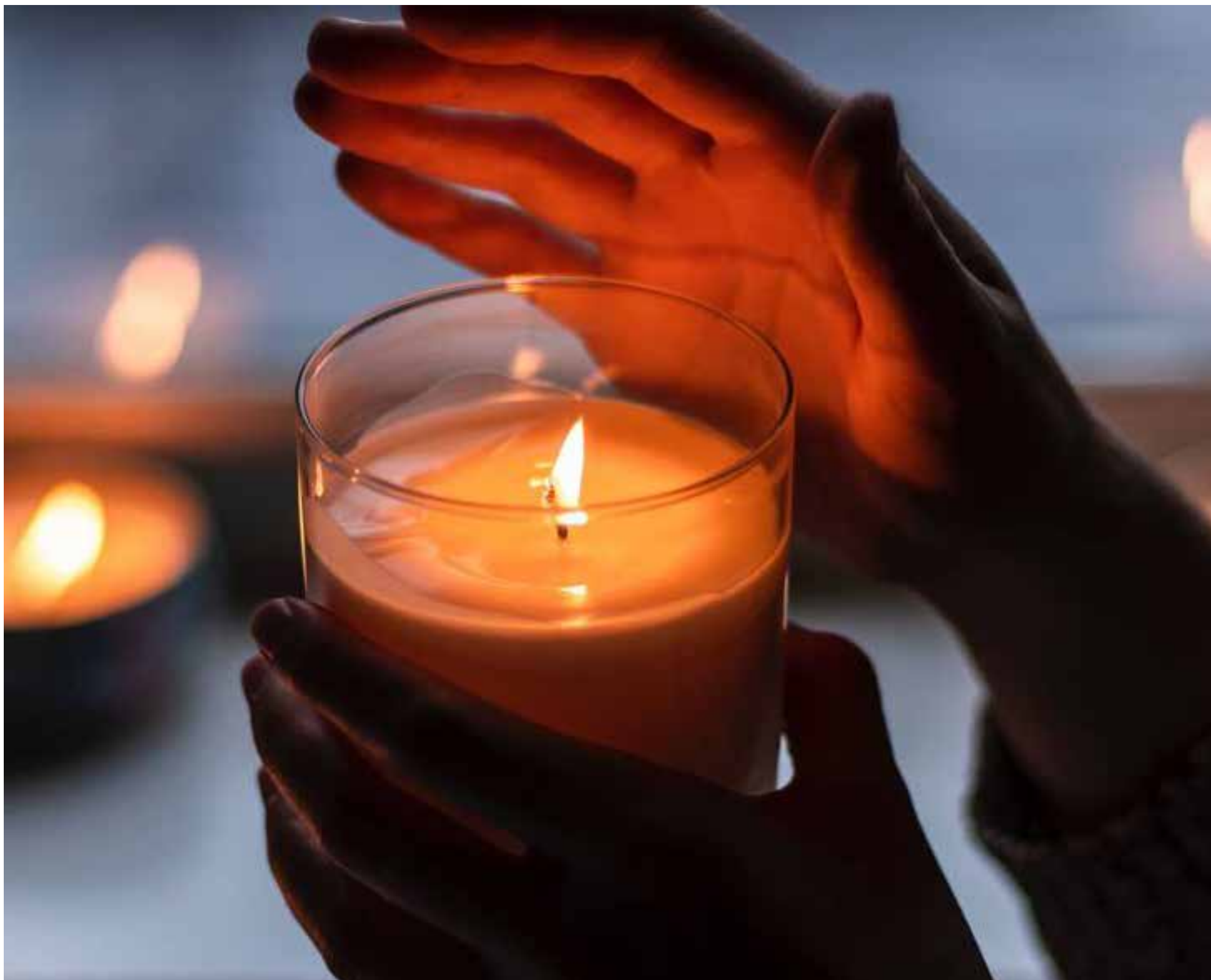
Día de las velitas en casa.

la que hace reír y llorar al mismo tiempo.