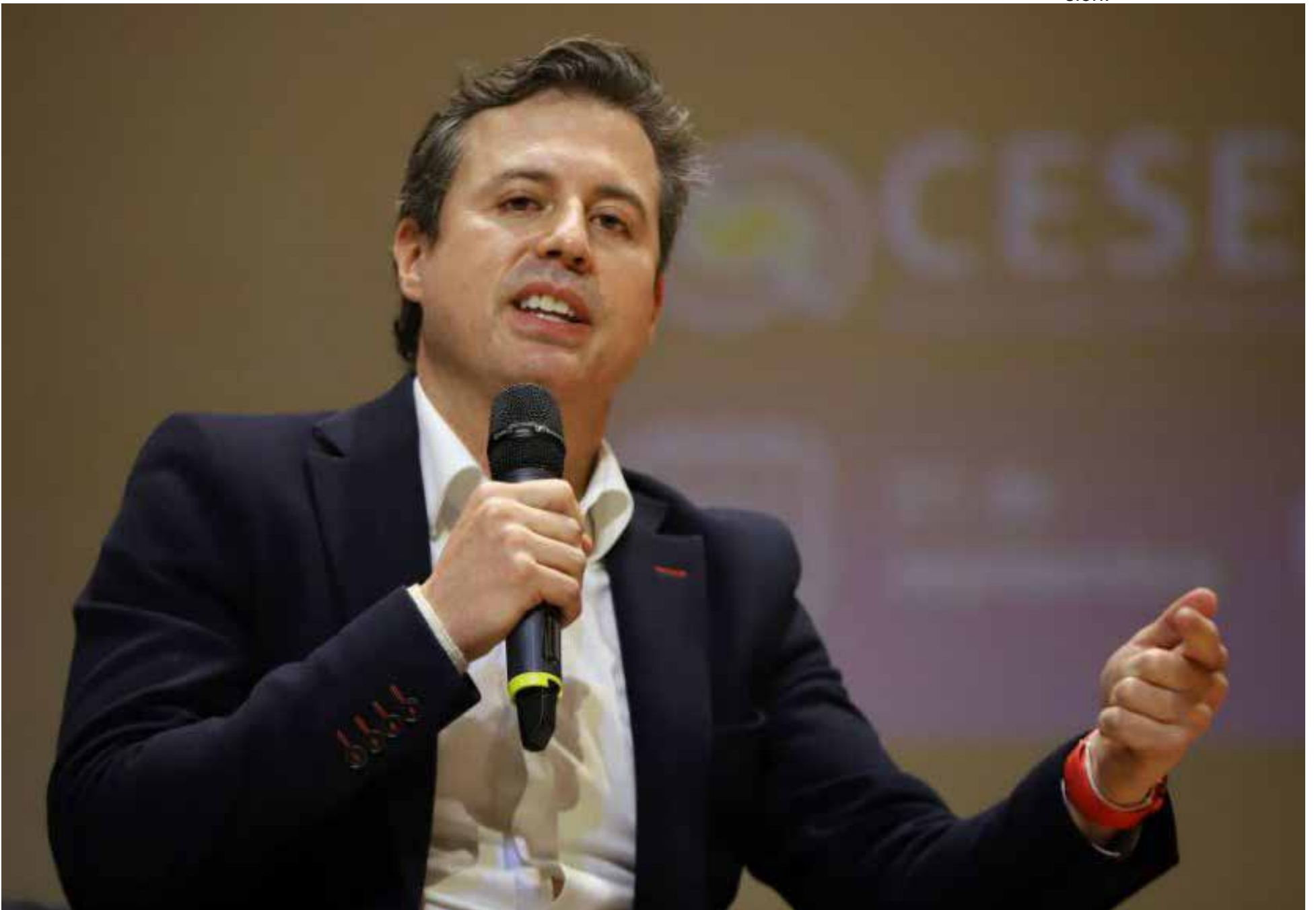
Juan Manuel Galán

«Quiero que Alejandro Gaviria sea el próximo Presidente de la República porque representa el cambio responsable. Su trayectoria pública y académica ha estado siempre guiada por la decencia. Alejandro es un demócrata, un liberal convencido, un transformador del status quo», dijo Rafael Pardo durante una visita que le realizó al candidato Gaviria, para anunciar su adhesión.