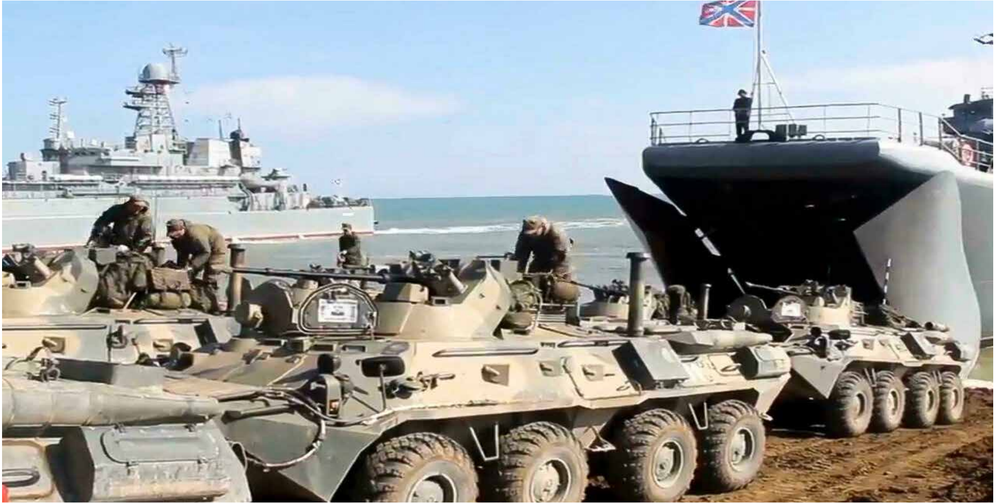
Ejército ruso en frontera de Ucrania

L as tensiones entre Ucrania y Rusia están en su punto más alto en años, con informes de una acumulación de tropas rusas cerca de la frontera que alimenta los temores sobre las intenciones de Moscú de una invasión en las próximas semanas o meses.