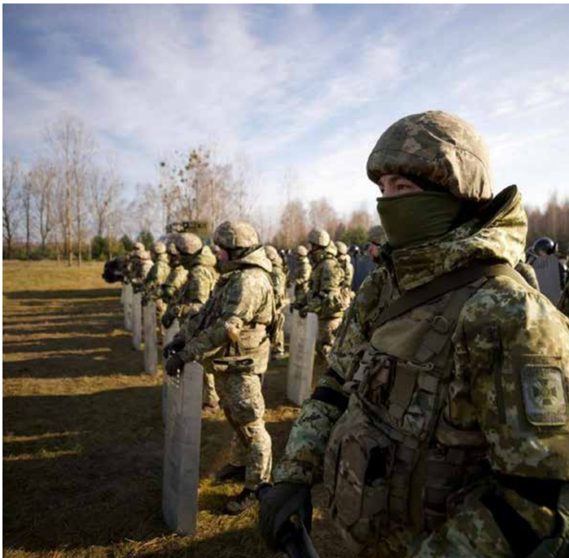
Tropas de la OTAN apoyadas por Estados Unidos en caso de presentarse invasión de tropas rusas.

El Kremlin niega estar planeando un ataque y argumenta que el apoyo de la OTAN a Ucrania —incluyendo el aumento de los suministros de armas y el entrenamiento militar— constituye una ame-