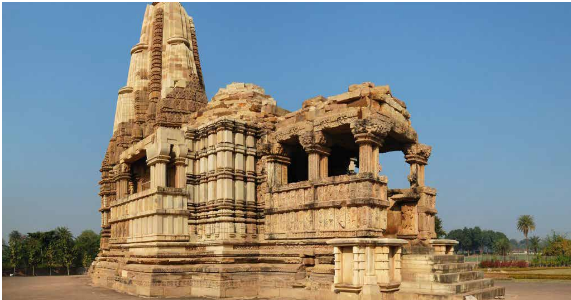
Templo de Dulhadeo (Dulhadev), en Khajuraho.