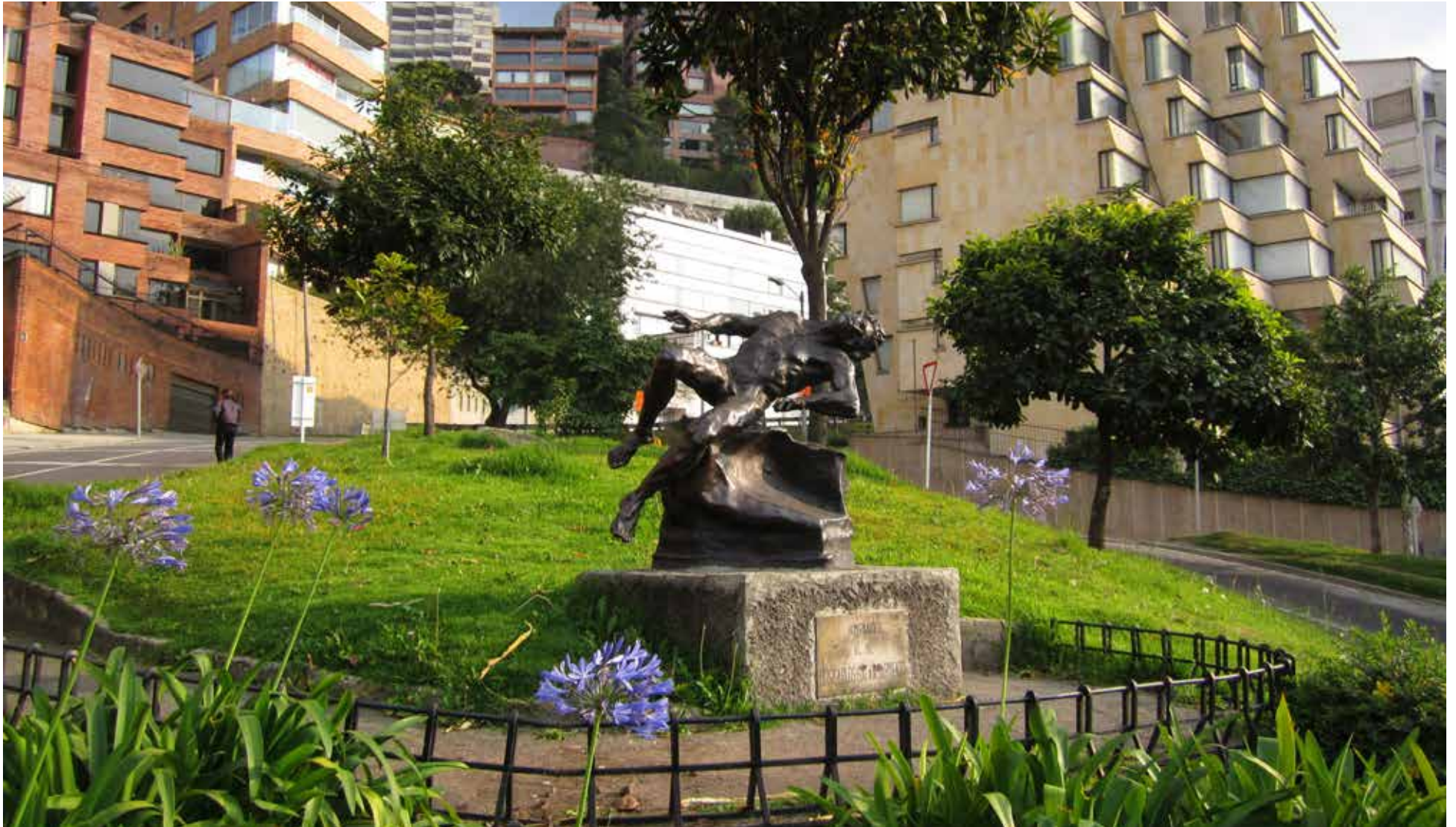
Monumento a Galán en Bogotá