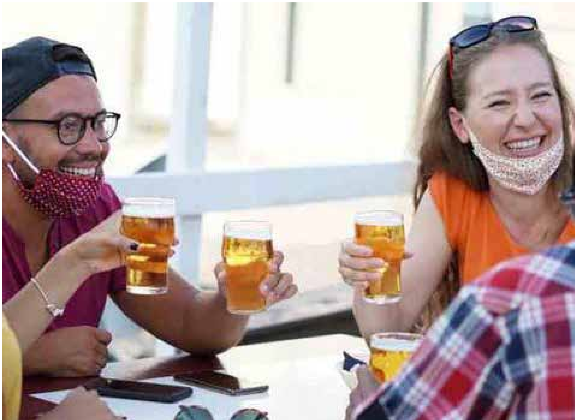
El consumo de alcohol aumenta el riesgo de cardiopatía isquémica, diabetes e ictus isquémico.

así como una toma de muestras de sangre y orina. Por otra parte, cada quince días se deberá rellenar un cuestionario online muy breve centrado en el consumo de alcohol». Los interesados pueden inscribirse o