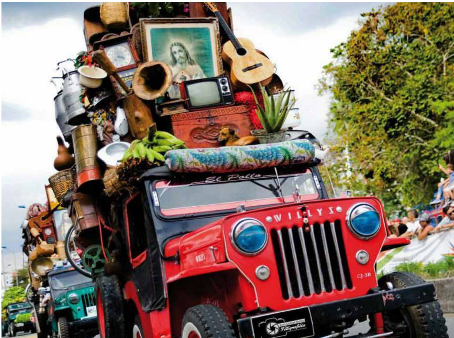
Yipao es la experiencia de transportarte en una de las expresiones más autóctonas del paisaje y el folclor del eje cafetero empezando por Calarcá.

El municipio cuenta actualmente con una población aproximada de 82.000 habitantes y debido a su ubicación geográfica y a la variedad de sus climas, el turista puede observar, recorriendo sus áreas rurales, bellos paisajes caracterizados por la presencia de diferentes cultivos como el café, el plátano, los cítricos y las heliconias, además áreas dedicadas a la ganadería; sobre estos productos y actividades se fundamenta el desarrollo de su economía agropecuaria. Calarcá fue el primero en ofrecer alojamiento rural en