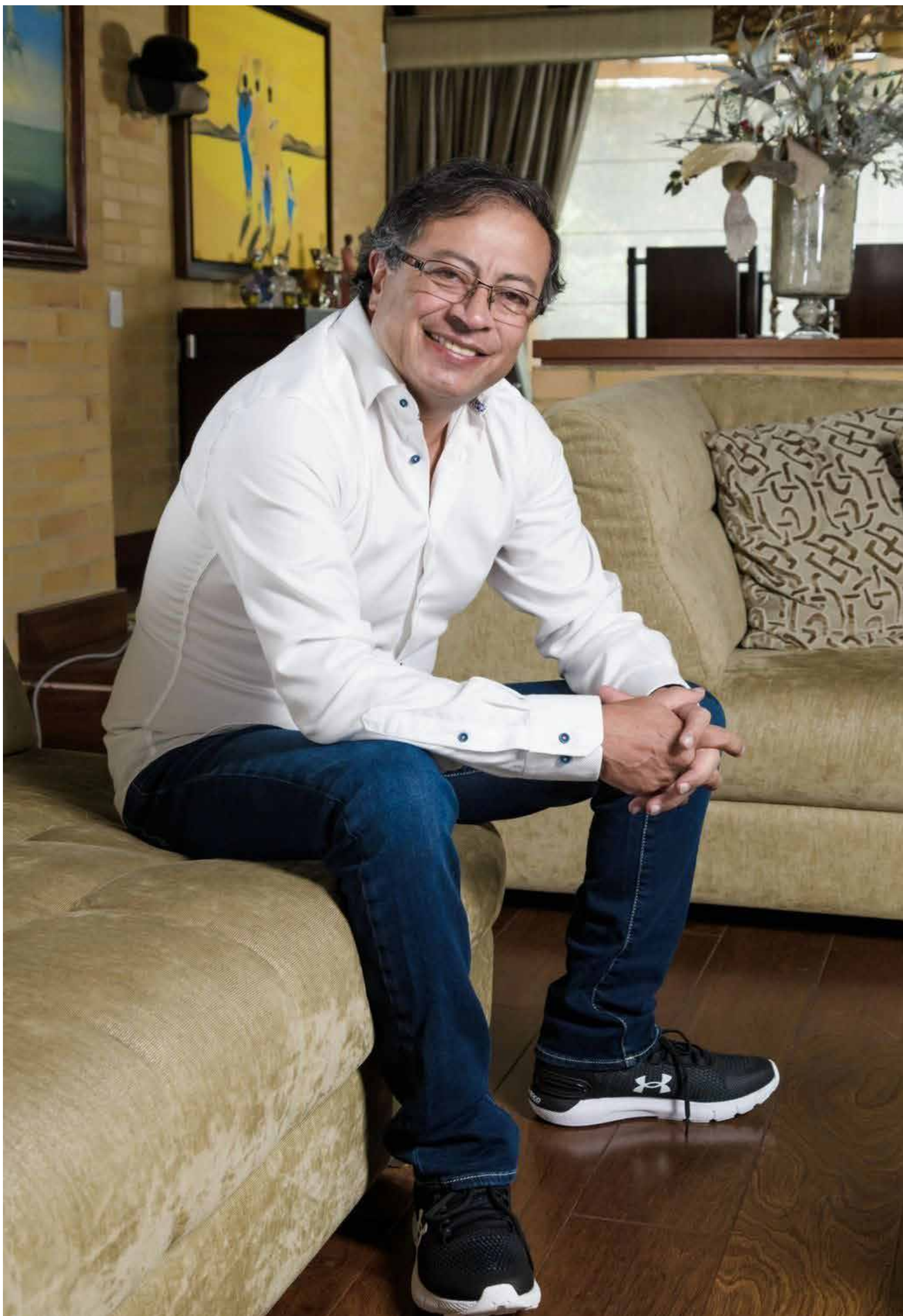
Gustavo Petro liderando la última encuesta presidencial

Ante la decisión de los colombianos por la clase política responsable de todos los males de Colombia, la gente miró por los lados del ingeniero Rodolfo Hernández, quien pasó de ser un dirigente regional a recoger la indignación de la