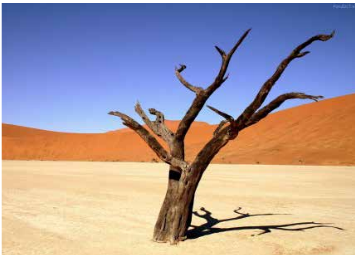
«Me aventuro a decir que sin libros sería un desierto insoportable».

— ¿A qué edad empezó a escribir sus primeras líneas literarias?