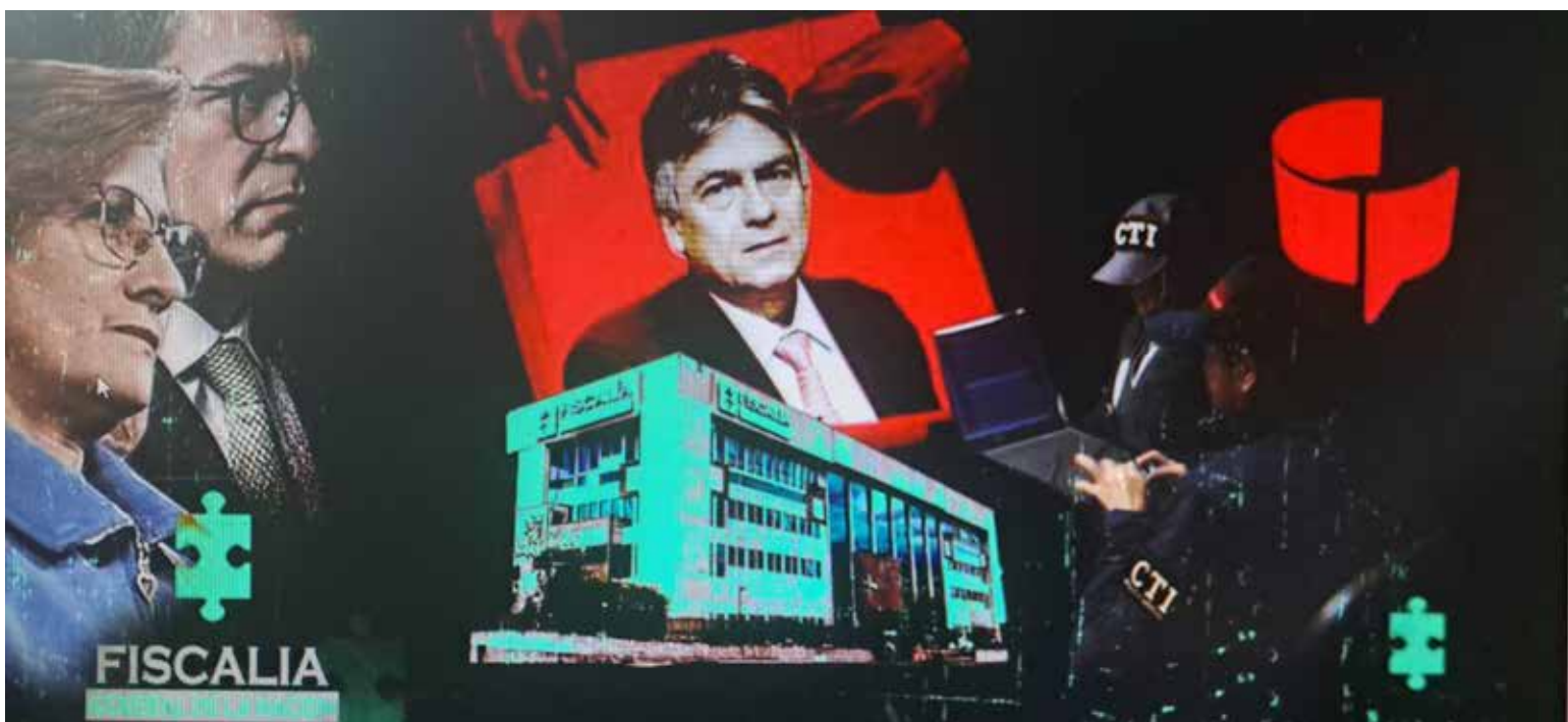
Así fue presentada la investigación de Cuestión Pública. La fiscal cuestionada ahora es amparada por la Corte Suprema de Justicia.

Este caso confirmó la investigación de Cuestión Pública: a personas incómodas para Barbosa y Mancera les habrían aplicado una suerte de perfilamientos, al parecer sin órdenes judiciales ni notificaciones. Tenemos las pruebas documentales.