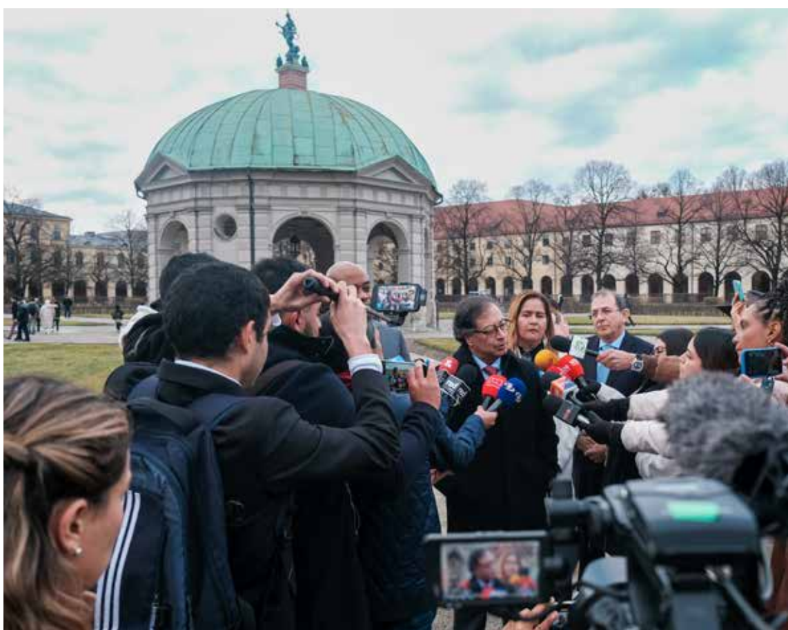
Colombia por primera vez invitada por los líderes mundiales a la Conferencia de Seguridad de Múnich.

Agregó que «si, al contrario, acabamos con el