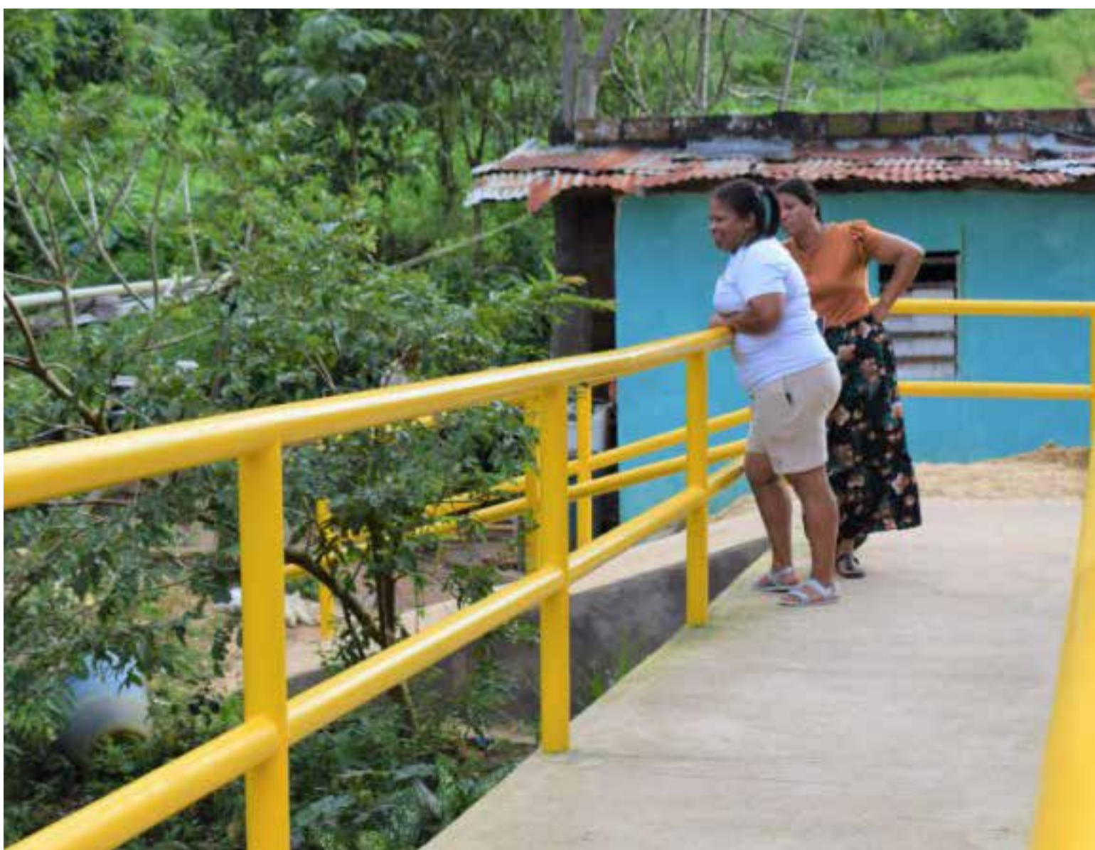
Puente Peatonal Las Delicias

Descripción generada automáticamente con confianza media La vía principal del barrio hasta hace poco era un camino de trocha por el que difícilmente la comunidad o vehículos podían transitar y el cruce de la quebrada El Tigrito que une a dos sectores del barrio, era precario e inseguro. Hace pocos días este panorama cambió, como consecuencia de la empresa Aris Mining en alianza con la Alcaldía de Segovia, intervino para construir una placa huella de 285 metros lineales y un puente peatonal de 18 metros, con una inversión de más de 760 millones de pesos.