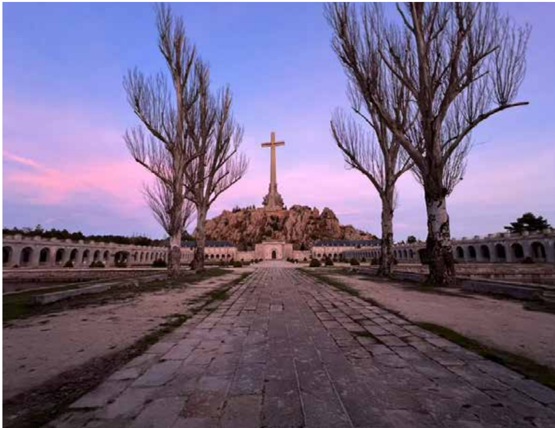
«Valle de los Caídos»

Una puerta de hierro, cerrada, hizo las veces de semáforo. El conductor detuvo el autobús, anunciando que era la parte más alta del risco. ¡Habíamos llegado! Estaba a 1.758 metros sobre el nivel del mar. ¡Yuju! Desperecé las piernas, bajando del vehículo después del último pasajero. Levanté la cabeza para alcanzar, visualmente, la punta de la cruz que estaba ahí, a varios metros. Era una cruz católica monumental. Desde abajo,