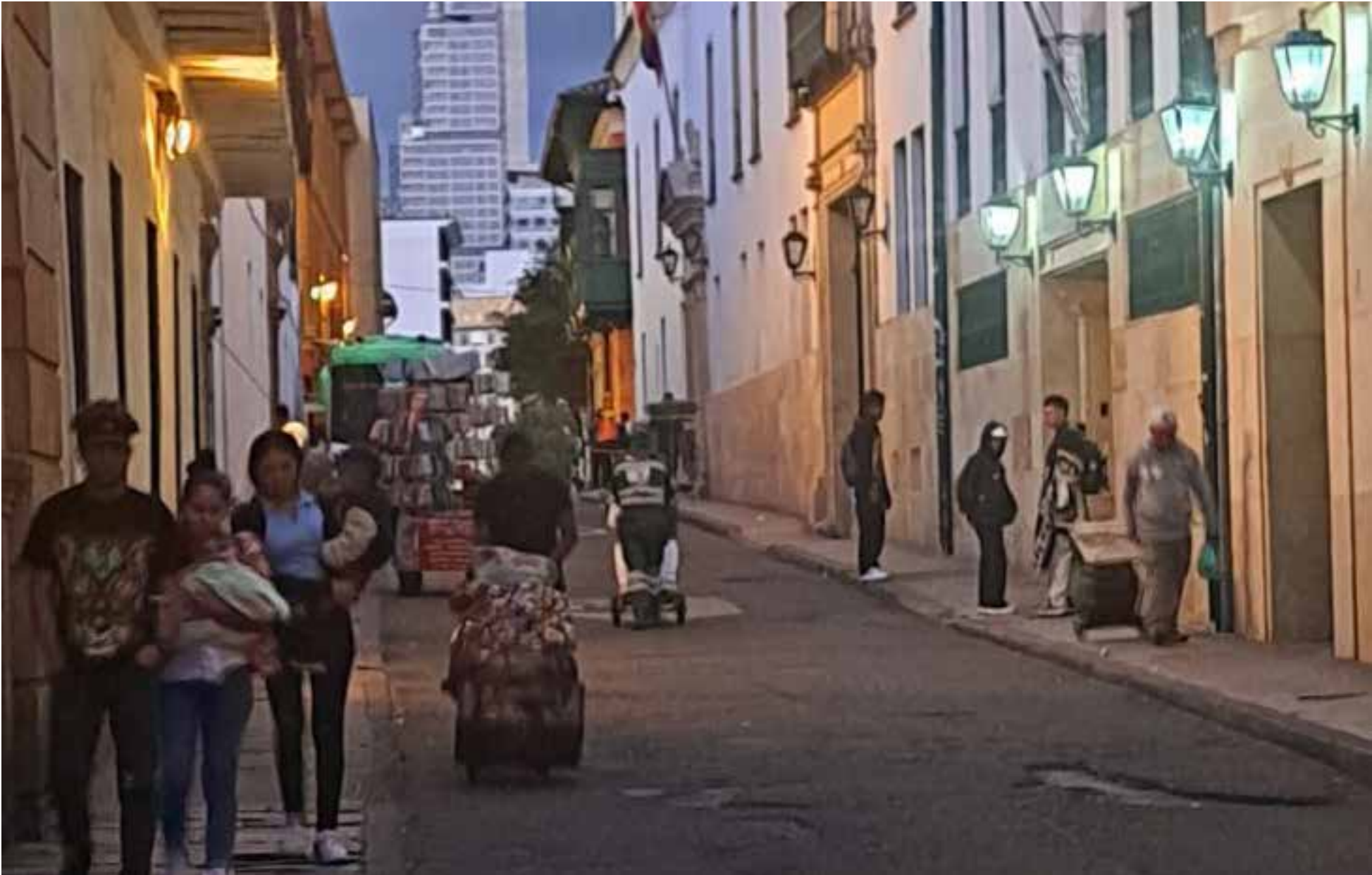
«La Universidad Nacional de Colombia, será la encargada de realizar el concurso de méritos, con el propósito de brindar todas las garantías y transparencia que este proceso merece»