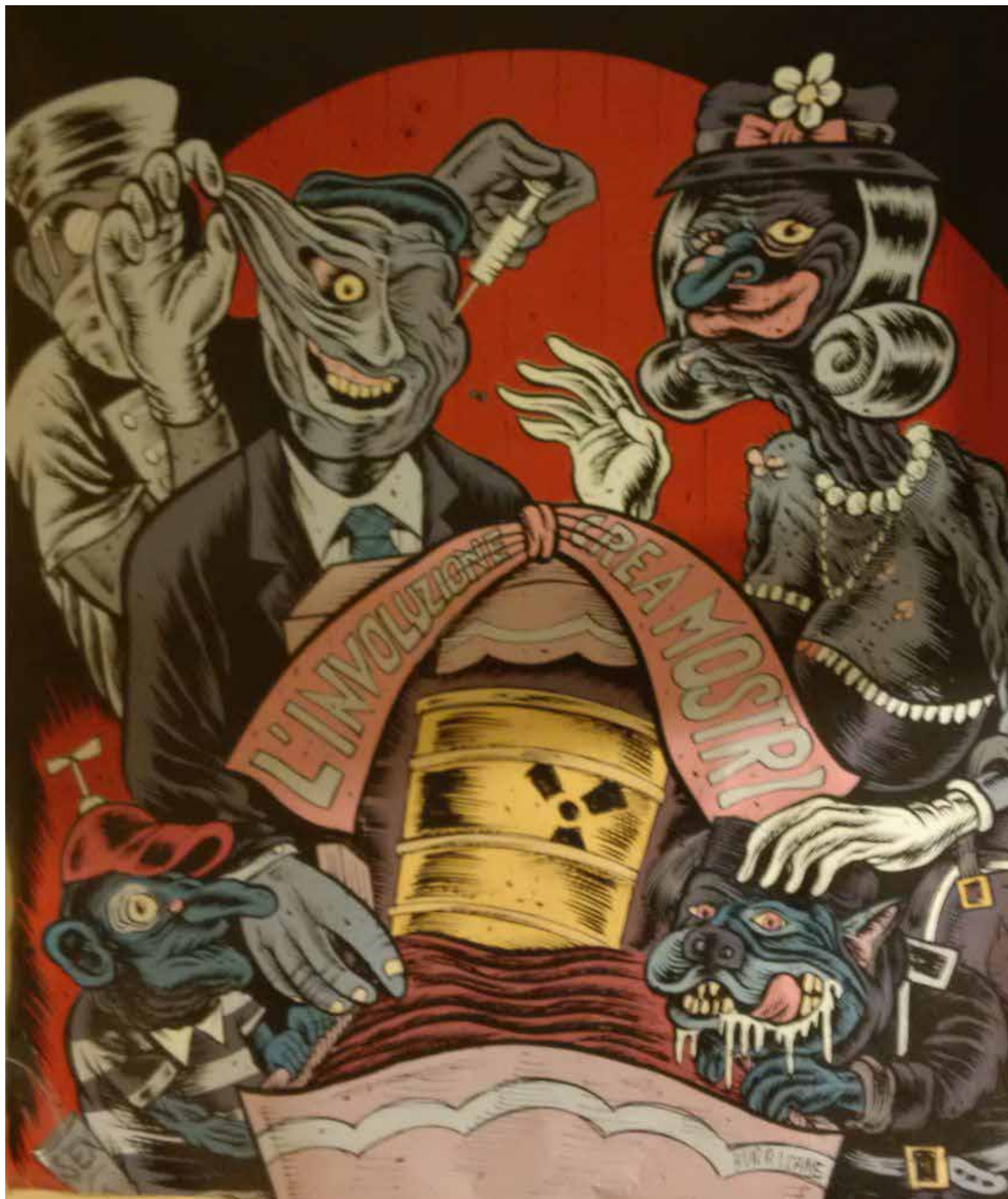
Justicia en manos de la corrupción.