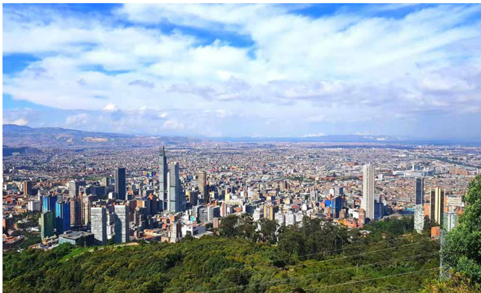
Bogotá D.C.

Para la administración distrital el principal requisito es contar con hombres y mujeres que