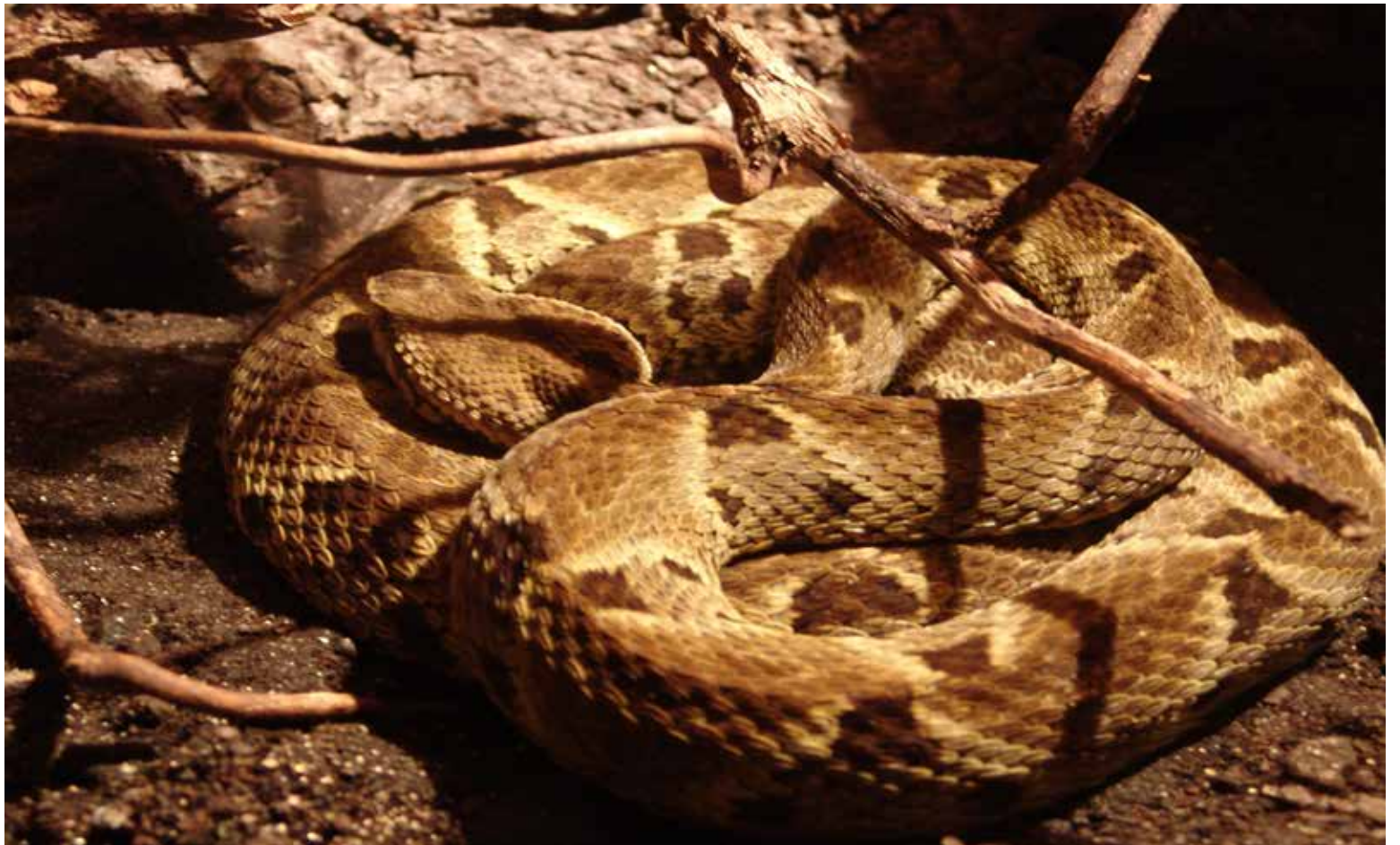
Taya equis, uno de los animales que habitan la Isla caucana de Gorgona.

Eran ayer tan negras las nubes que oscurecían el panorama que la fenomenal metida de pata del gobernante de haberle metido la mano al presupuesto aprobado usando un procedimiento vergajo y dejando departamen-