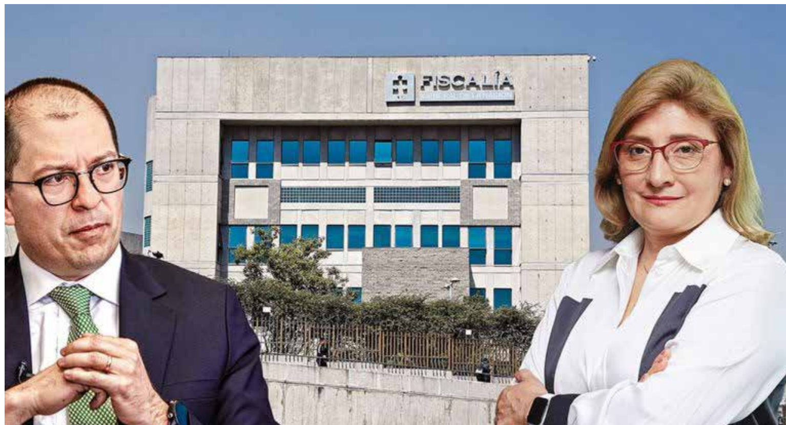
Cuestionada y desprestigiada queda la Fiscalía al paso de Barbosa y Mancera.

como abogado he hecho parte del equipo del doctor Iván Cepeda en el pleito con Álvaro Uribe».