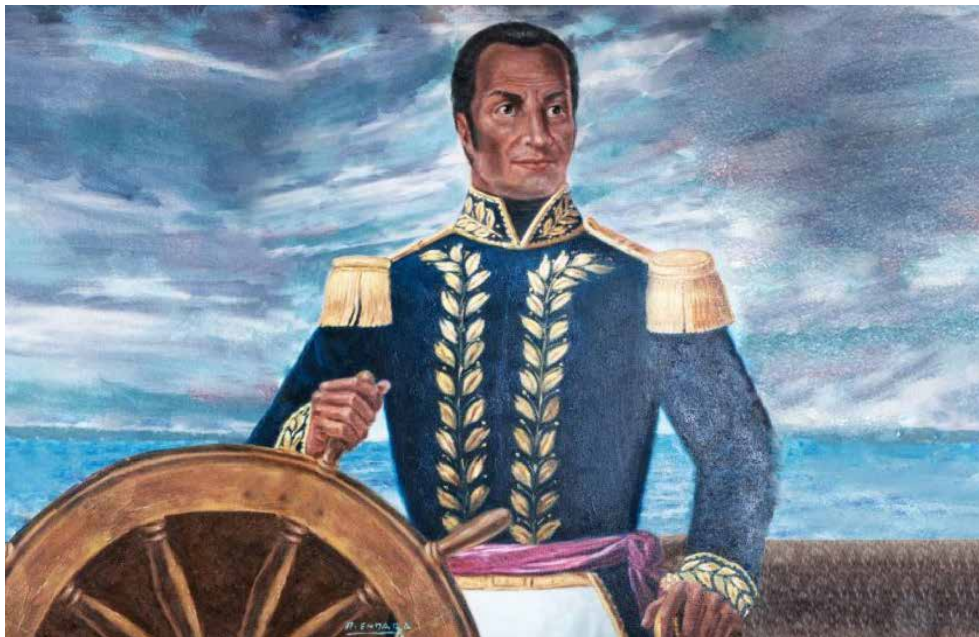
Almirante José Prudencio Padilla López

195 años después de su fusilamiento, el máximo prócer naval colombiano, el Almirante José Prudencio Padilla López fue ascendido, por el presidente de la República Gustavo Petro Urrego, de manera póstuma y honorífica, al grado de Gran Almirante de la Nación.