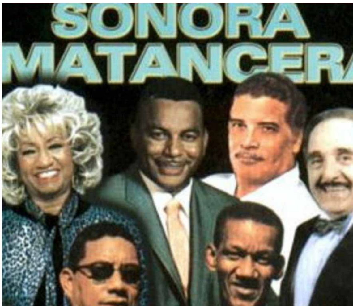
Grandes estrellas hicieron parte de la afamada orquesta.

Unas de las primeras labores realizadas por Nelson Pinedo fue la de