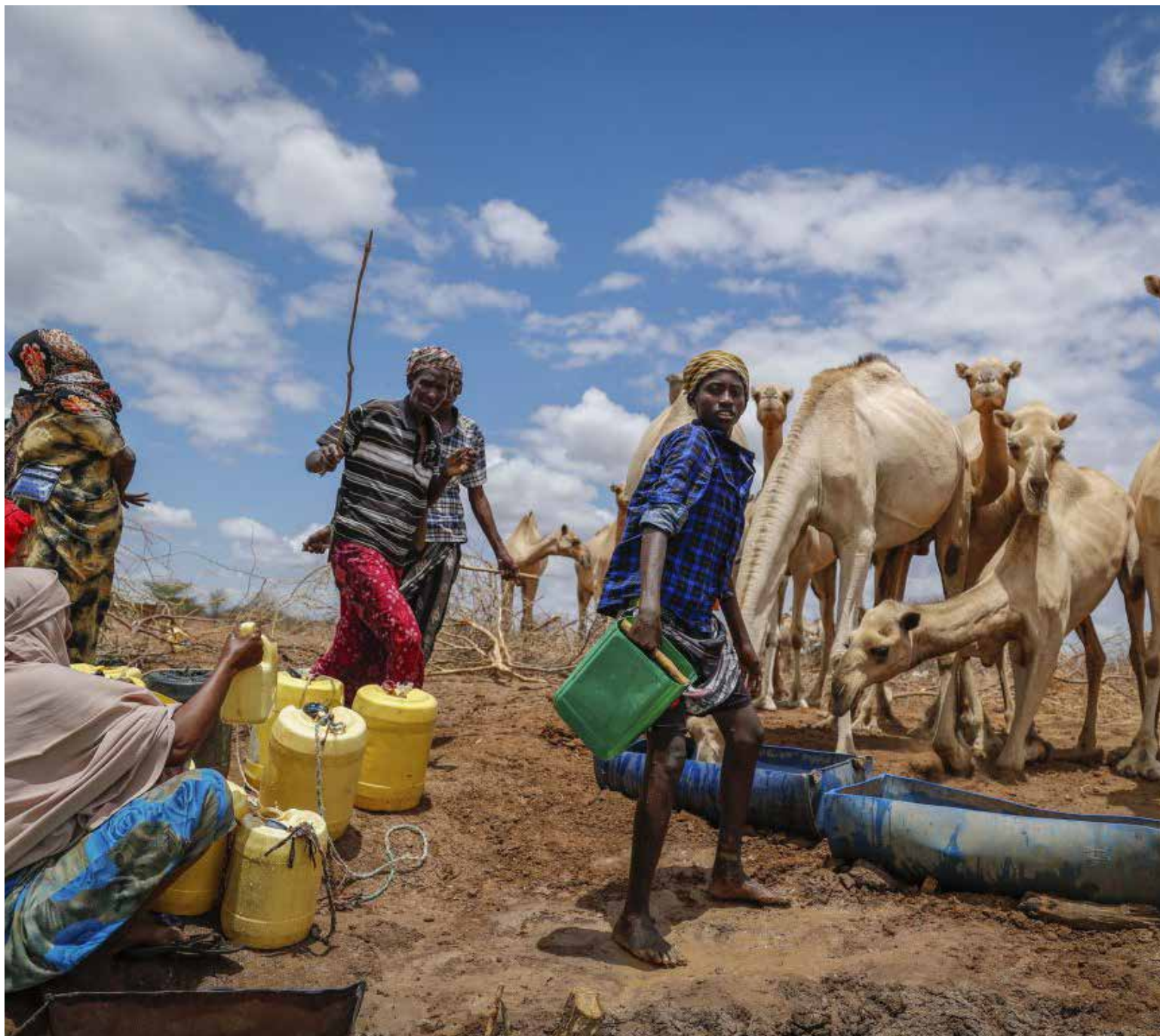
La sombra de la hambruna en Somalia