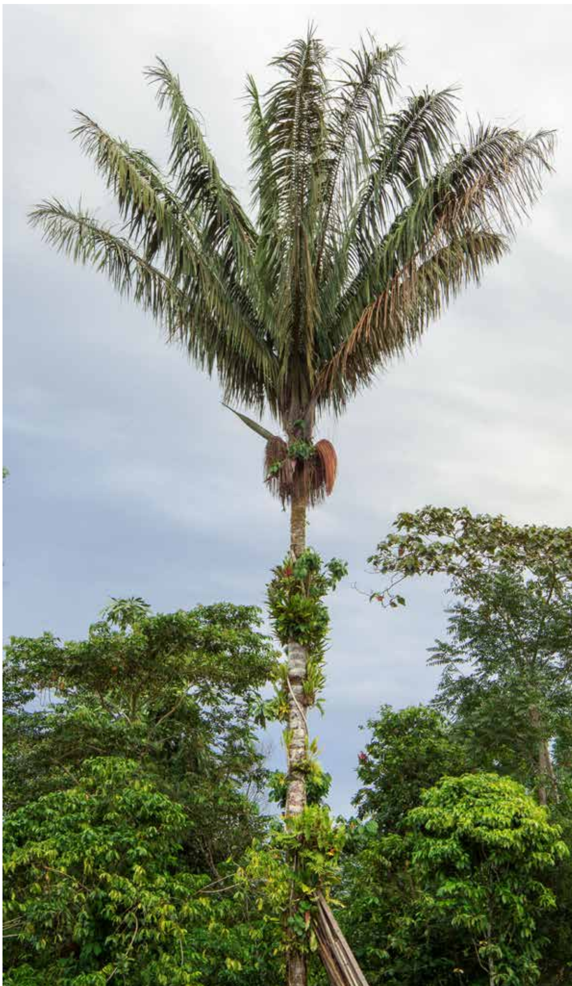
Se trata de dos especies de palmas poco estudiadas y de alta presencia en el suroccidente colombiano, en donde el espectro de investigación y consumo se suele limitar a la palma de coco.

No obstante, ahora la especie O. mapora , o palma «Mil Pesillos» –como se le conoce en la zona–, demostró tener