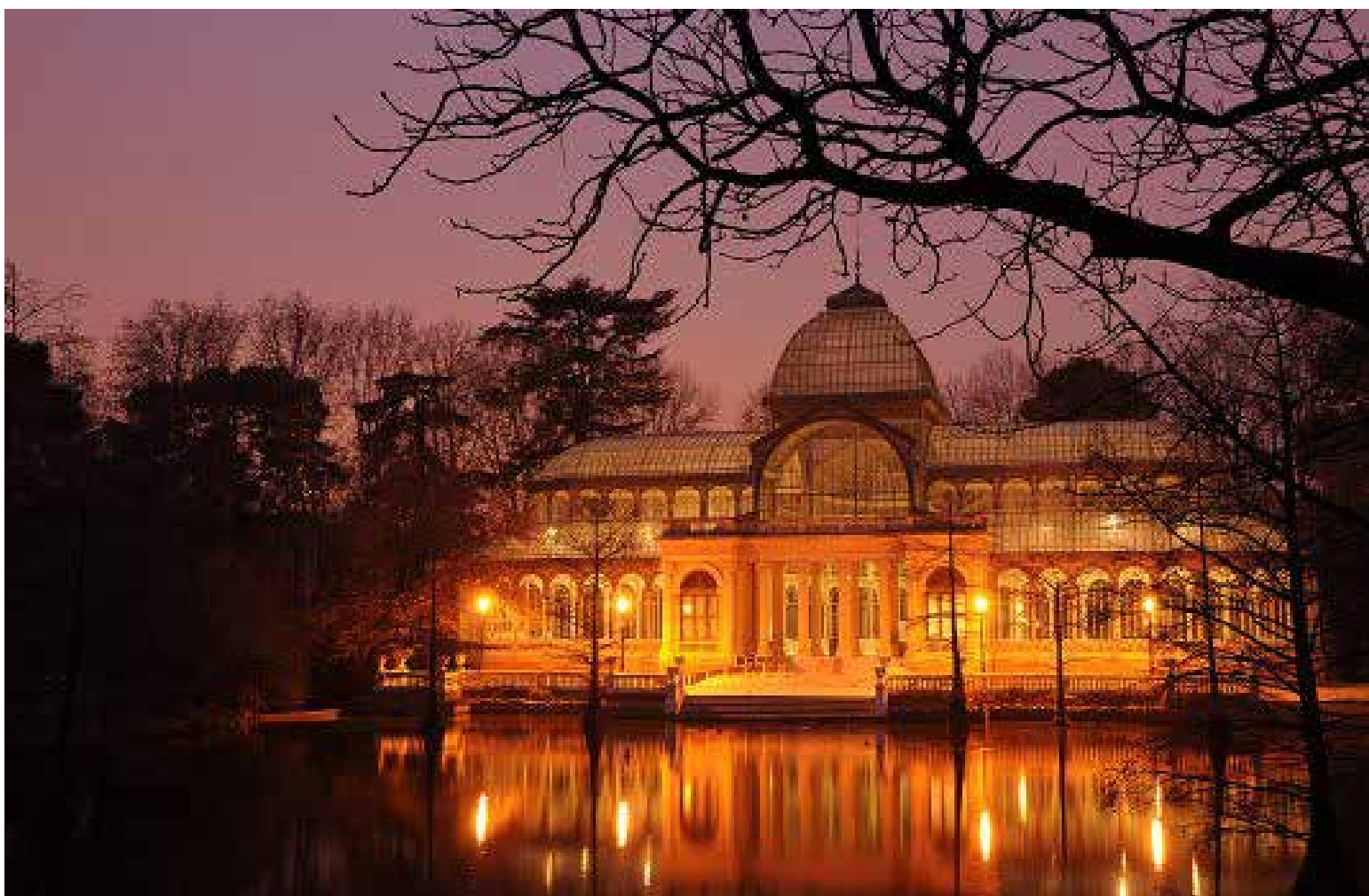
Palacio de Cristal, vista nocturna en el Parque del Retiro de Madrid

Un enorme parque de más 9 kilómetros de espacio verde peatonal recorre la ciudad. Es el Jardín del Turia, que ocupa el antiguo cauce del río del mismo nombre. En sus extremos se encuen-