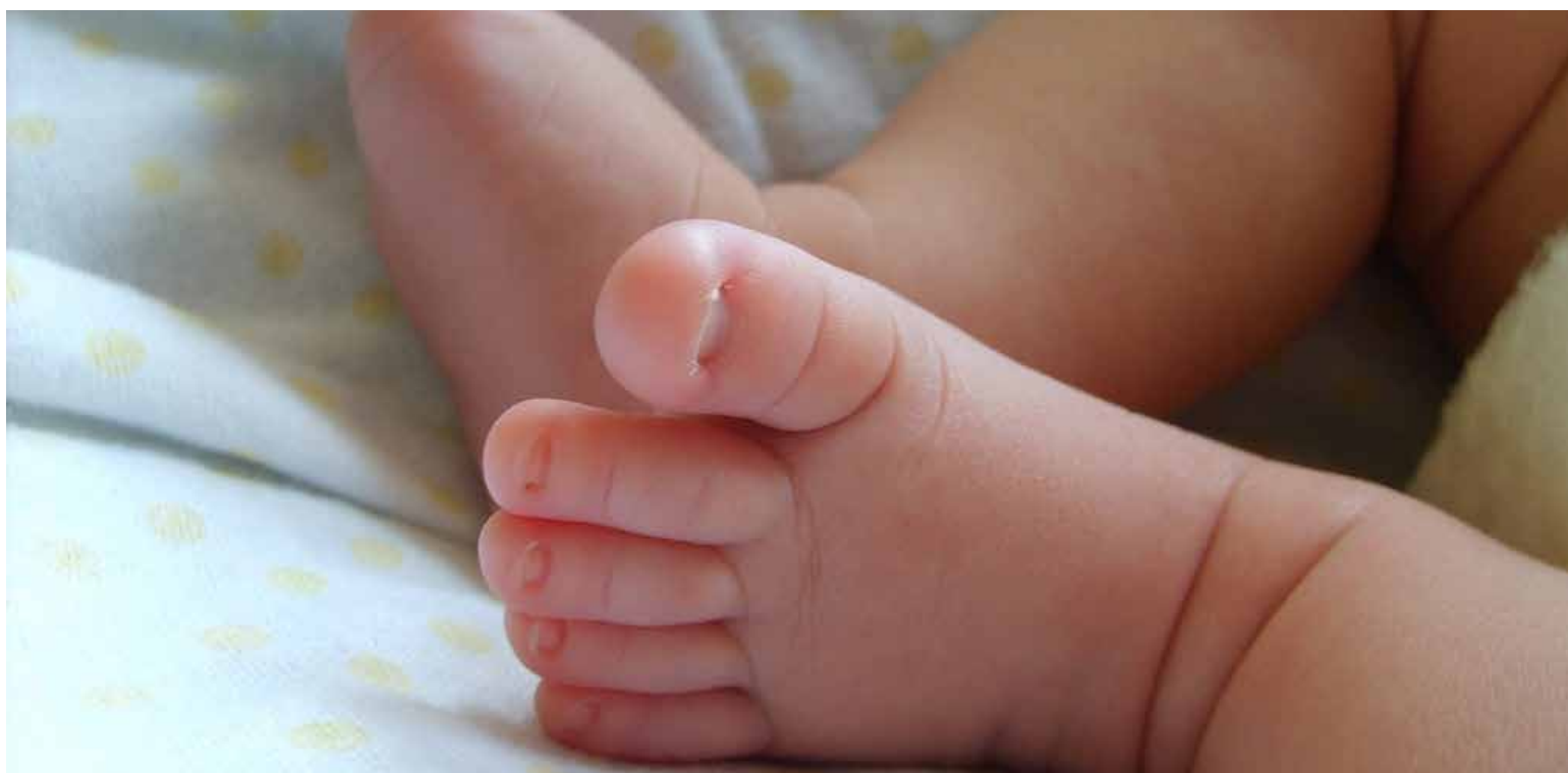
La Tortura a la que son sometidas las presas políticas en Colombia se extiende a sus hijos y familiares. El caso de la hijita de una presa política, de menos de 3 años de edad: violada en la cárcel.