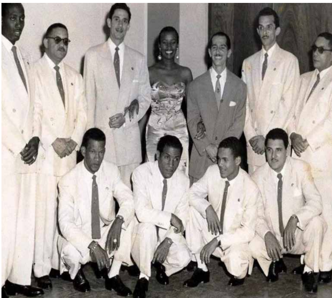
Inicio de la Sonora Matancera.