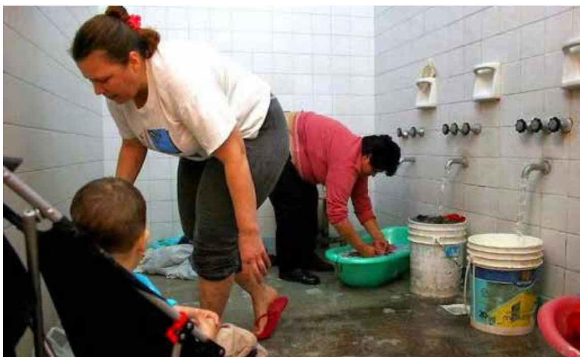
Las presas políticas son recluidas en las cárceles junto con sus pequeños hijos.

Enseguida su madre acudió a algunas de nosotras, sus compañeras de más confianza y nos narró lo ocurrido. Después de oírla nos miramos en silencio unas a otras y las lágrimas prontamente asomaron a nuestros ojos. Le dijimos a nuestra compañera que debíamos denunciar urgentemente el caso ante organismos defensores de derechos humanos y de las niñas y niños, antes que a la reclusión.