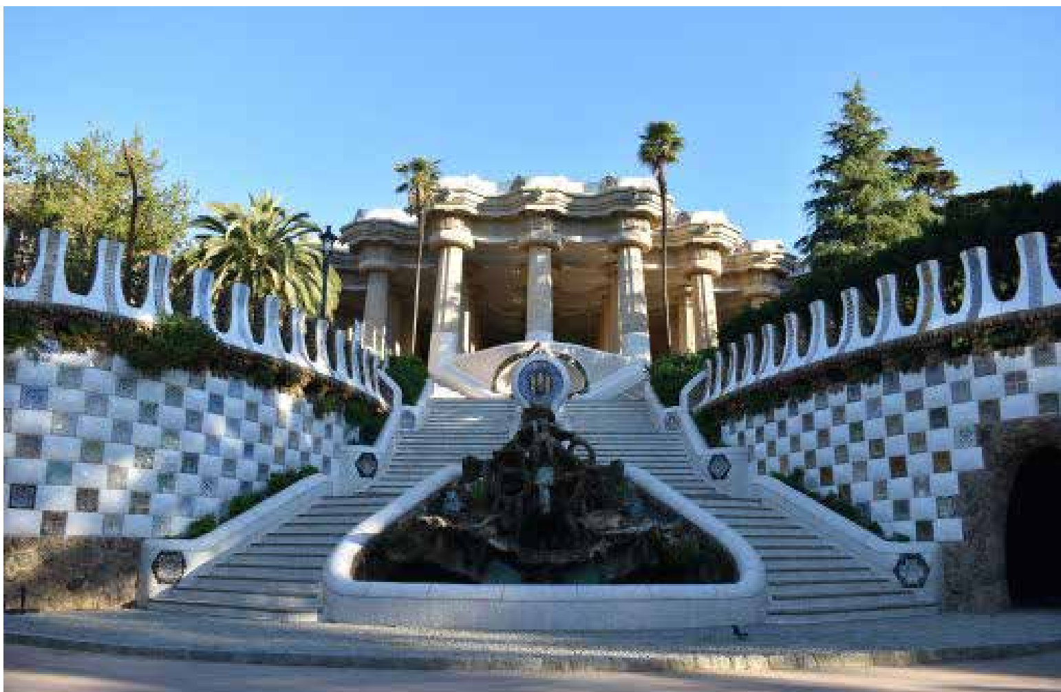
Parque Güell. Barcelona