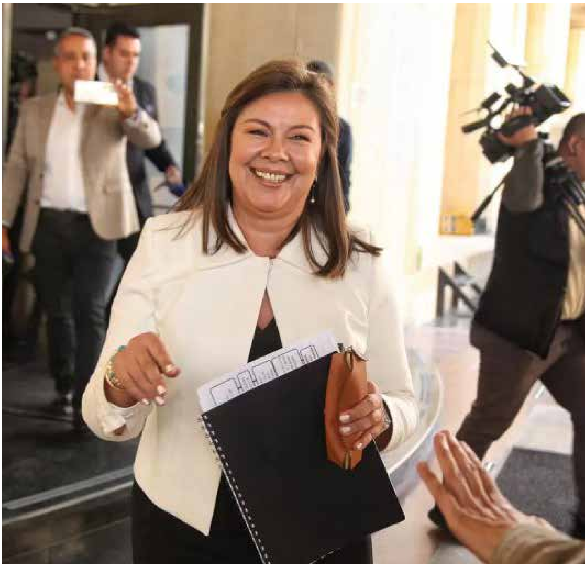
La nueva fiscal general de la Nación es una jurista que se ha dedicado su vida profesional a ejercer justicia

quez. Camargo Garzón, fue magistrada auxiliar de la Corte Suprema de Justicia como parte de la Sala de Casación Penal, siendo también ex fiscal delegada y auxiliar ante esta misma corporación. De igual manera, se desempeñó en el campo de la dirección de investigaciones por delitos comunes como fiscal delegada