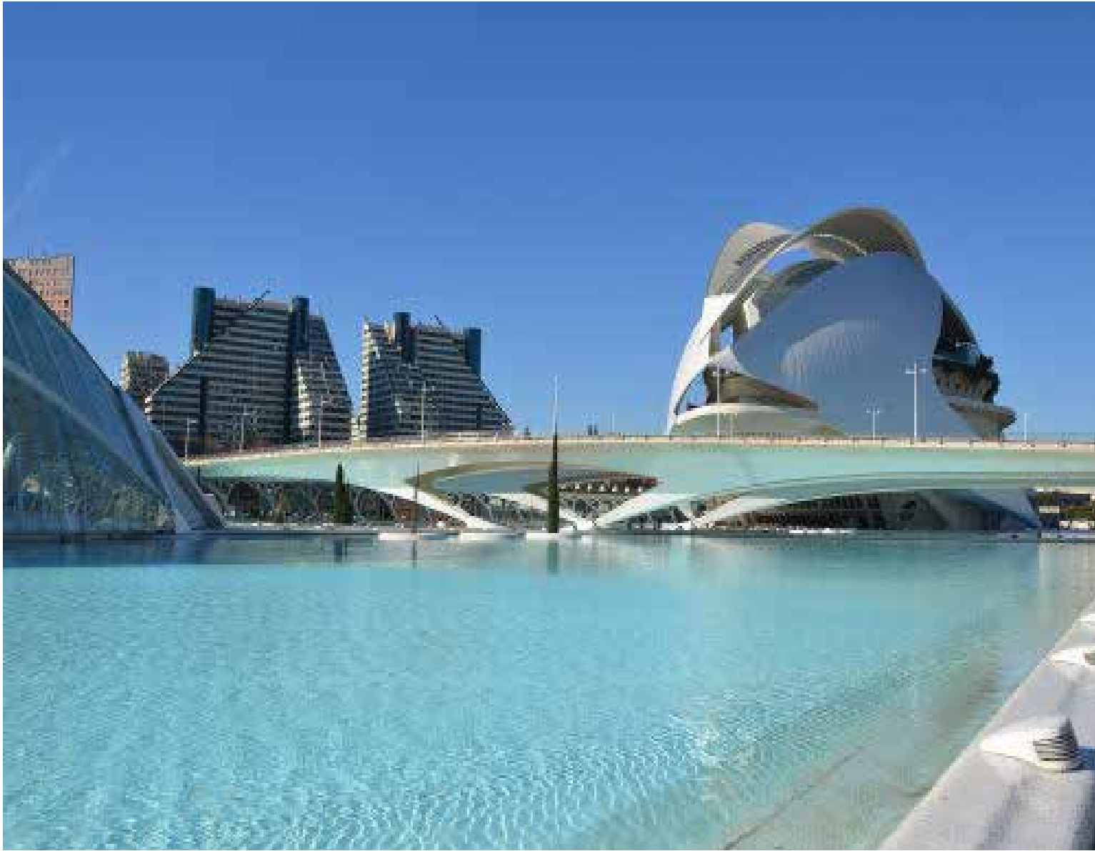
Puente de Monteolivete, detrás el Palacio de las Artes Reina Sofía haciendo parte de los Jardines del Turia. Valencia.

tran el zoológico Bioparc y la Ciudad de las Artes y las Ciencias. Si vas con niños, tenéis que visitar el cercano parque de Gulliver dedicado al famoso gigante de cuento. Próximo a la zona central del jardín del Turia, también te recomendamos los jardines del Real y los de Monforte.