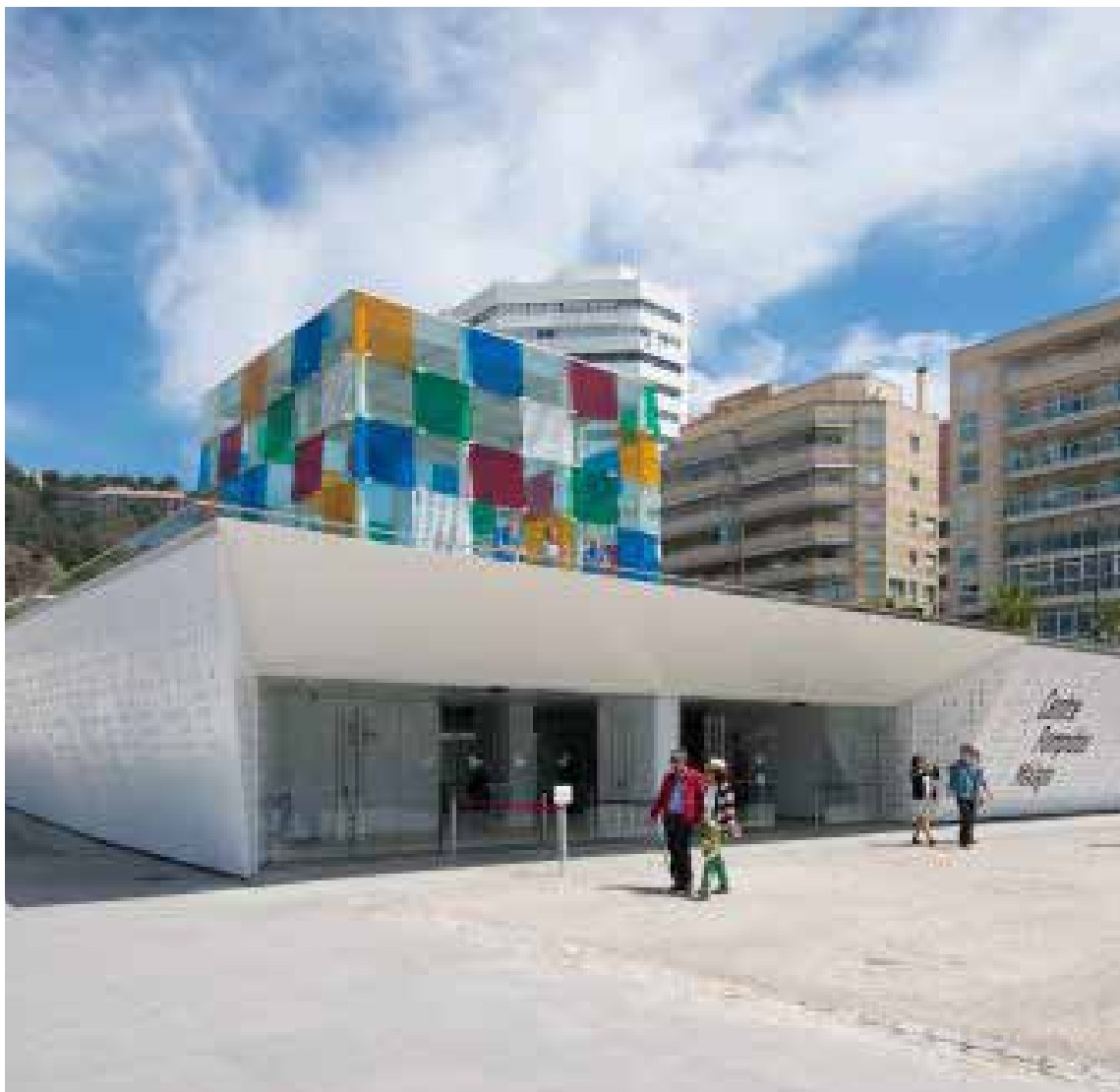
Centro Pompidou, Málaga

Recorrer el Parque María Luisa en coche de caballos (llamados calesas en Sevilla) es una experiencia única, cien por cien andaluza y que te permitirá conocer los jardines, la Plaza de España y otros monumentos como la Giralda, la Catedral o el Real Alcázar. Éste último es un extraordinario ejemplo de arte mudéjar y sus jardines son imprescindibles (te resultan