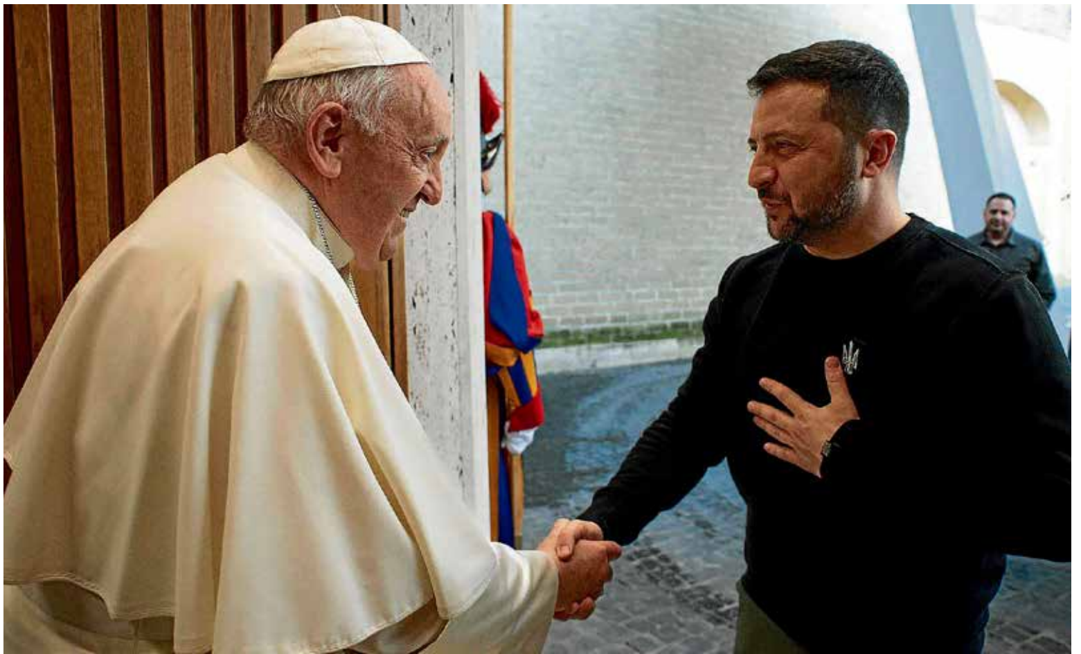
El papa Francisco pidió a Ucrania sacar la bandera blanca para terminar la guerra. Zelensky utilizado por el occidente negó la petición papal.

Los halcones, encabezados por el gobierno de Zelensky y los fabricantes de armas de tantos países de la OTAN no acep-