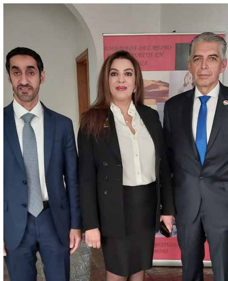
Intercambio de periodistas entre Colombia, Marruecos y Emiratos Árabes Unidos abordaron los embajadores de esos dos países y el presidente del Círculo de Periodistas de Bogotá.