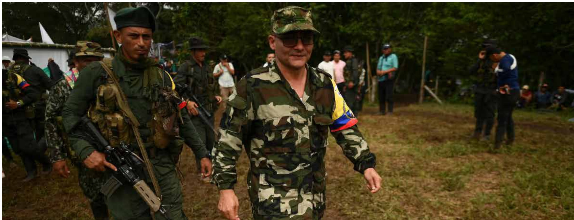
Las FARC se consolidan en el Cauca, Nariño y Valle.