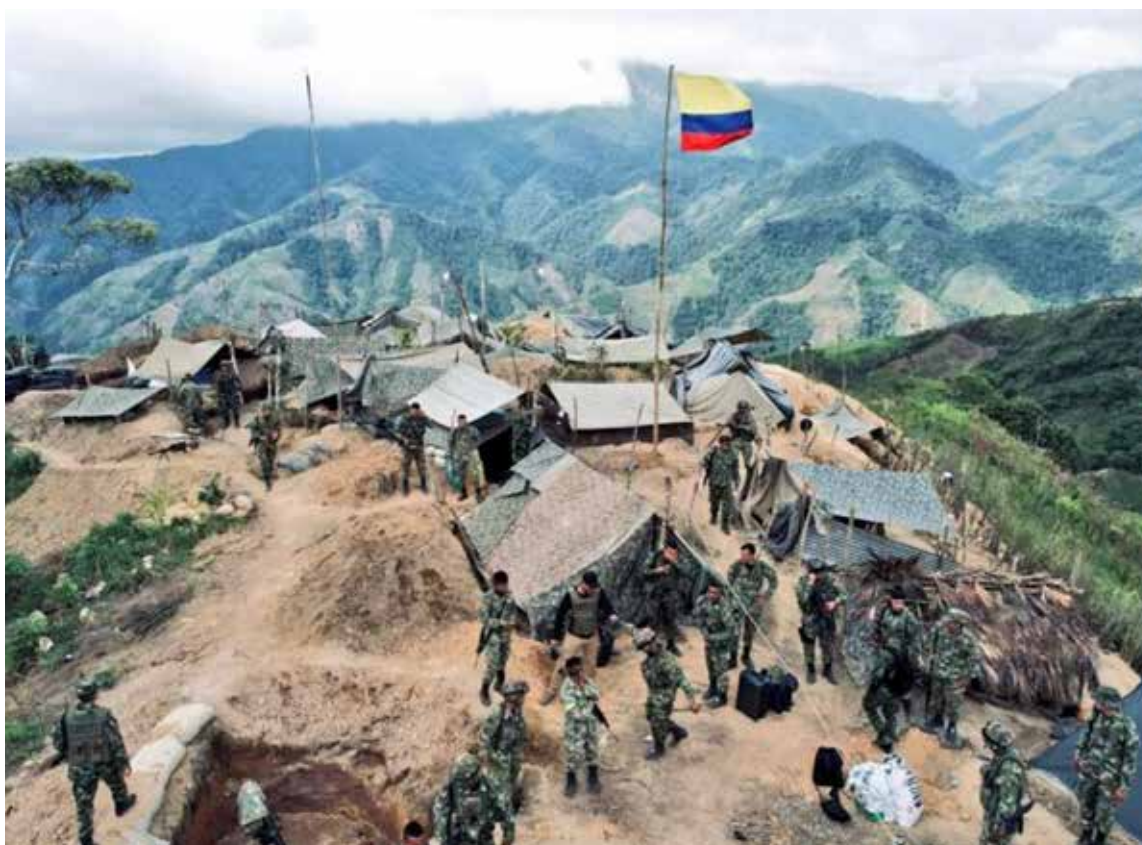
El Ejército de Colombia, por instrucciones presidenciales, tomó control del cañón del Micay y sacaron a las FARC.

Explicó que ese cambio requiere dotar a los territorios de «unas condi-