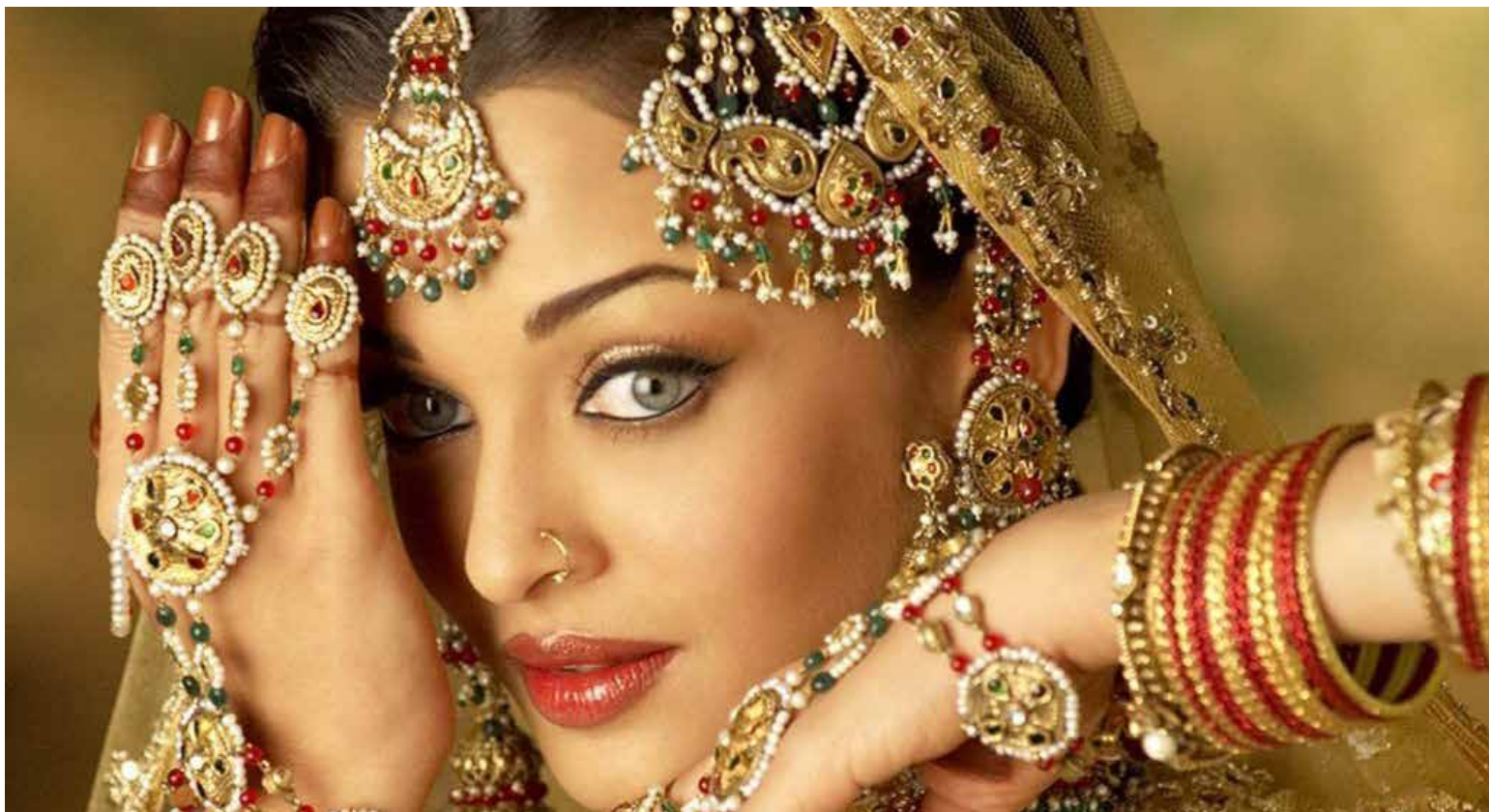
Joyas de la India en Bogotá

El Consejo de Promoción de Exportaciones de Joyas y Gemas (GJEPC) con el apoyo del Ministerio de Comercio e Industria de la India y MUBRI junto con la Embajada de la India en Colombia traerán a Bogotá una delegación con empresarios del sector de joyería en oro terminado y diamantes naturales y cultivados en el laboratorio. Se reunirán en un almuerzo privado con empresarios y gremios colombianos del mismo sector hoy 27 de mayo 2024 en el Hotel Dann Cartón en Bogotá.