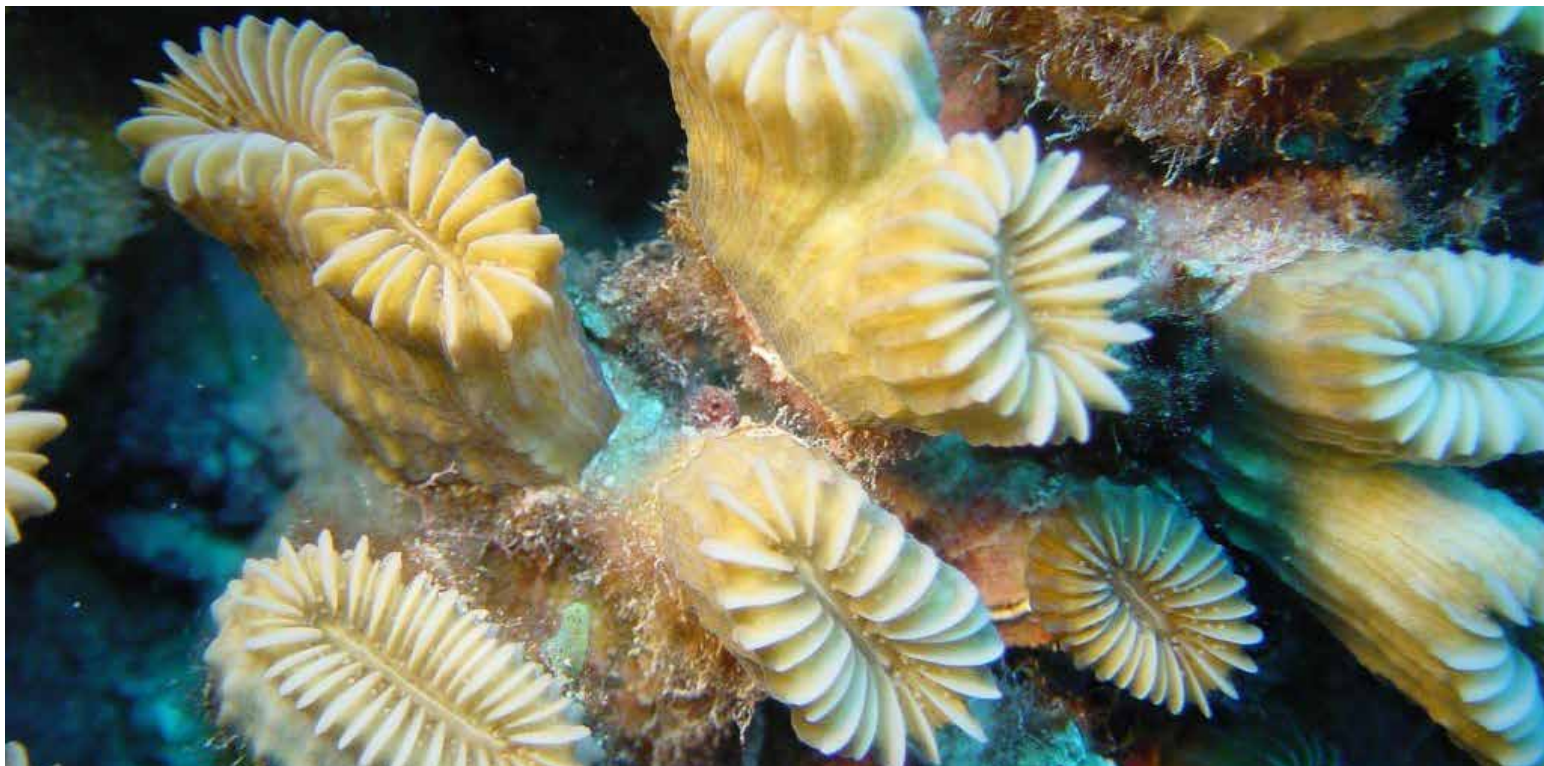
El laberinto de Las Doce Leguas de espléndidos sitios para la contemplación subacuática, con colonias de esponjas y grandes jardines de arrecifes.

Enriquecen sus 360 kilómetros de extensión el hermoso paisaje de 661 cayos, entre los que sobresalen los agrupados en el Laberinto de Las Doce Leguas, frente a la costa meridional de Camagüey y Ciego de Ávila, embellecido por el paisa-