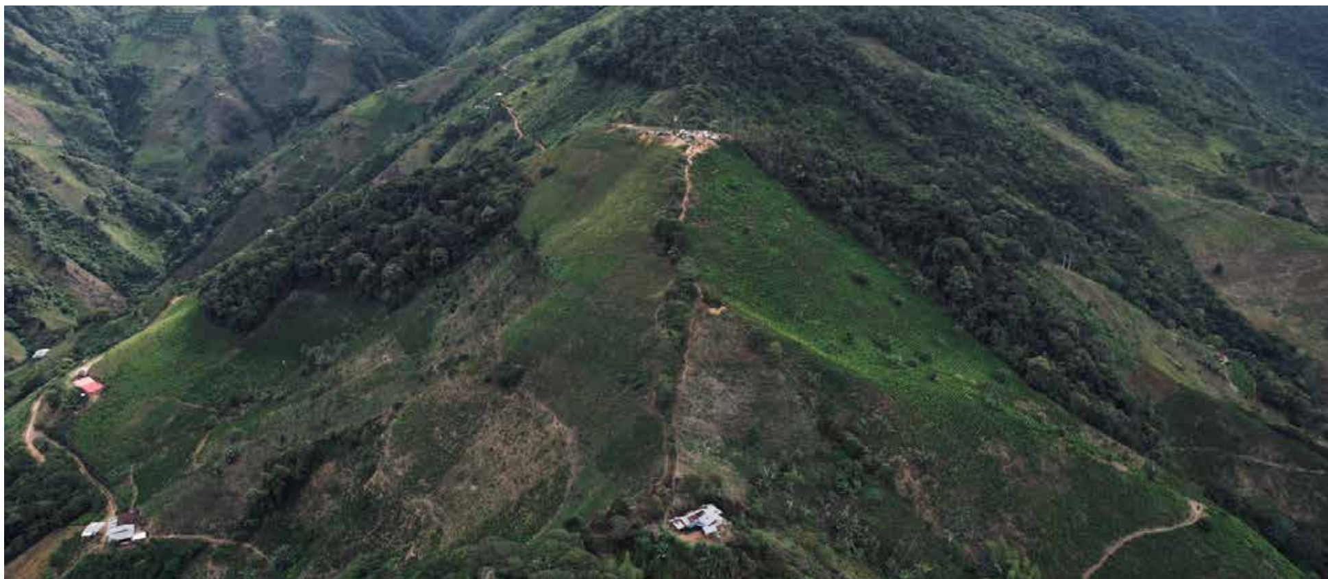
Cañón de Micay

E l presidente Gustavo Petro impartió instrucciones a sus ministros y directores de departamento para trabajar en la transformación social y económica de los territorios en el departamento del Cauca, como el Cañón del Micay, a partir de la sustitución de las economías ilícitas.