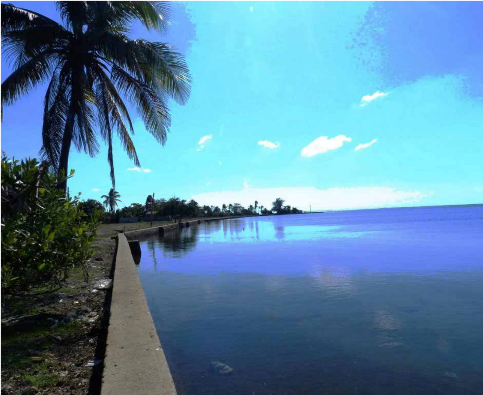
El paisaje lo dice todo.

vertebrados terrestre (9 reptiles, 62 aves), mientras que en Cayo Grande observaron 5 taxa de reptiles y 43 de aves. En tanto, en Caballones en total fueron 58. (Perrito de costa, Bayoya, Culebrina o Corre costa y Jubo de sabana). Destaca en el archipiélago la manifestación del Cocodrilo americano y la Iguana, en peligro de extinción. Solo 20 son