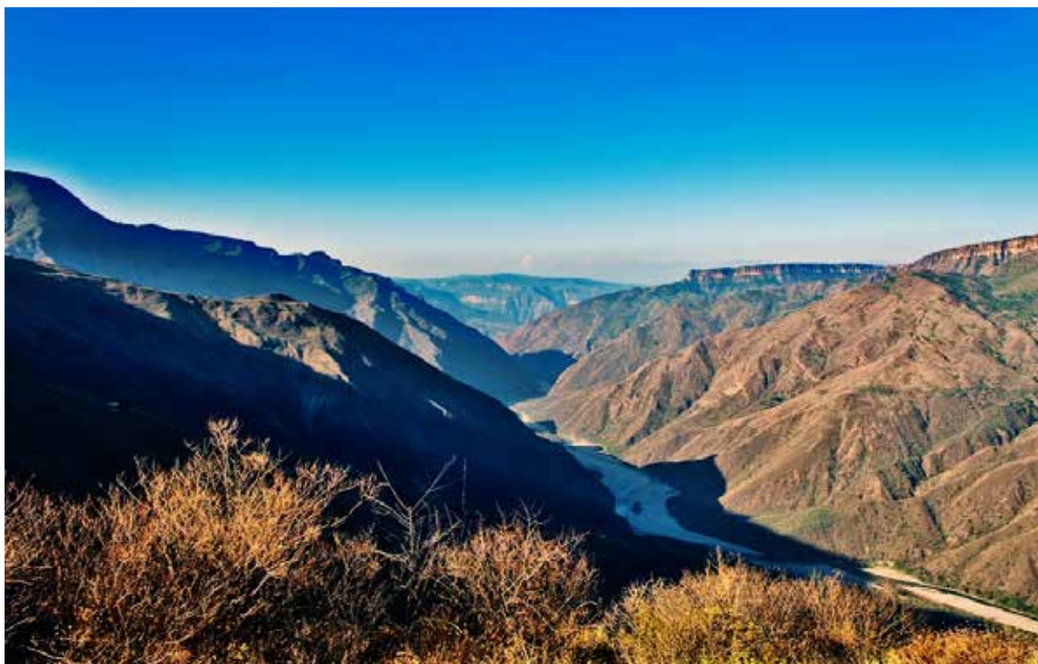
Cañon de Chicamocha

Ya sea que el auto o motocicleta tenga una caja automática o una de cambios manuales, se puede usar para disminuir la velocidad y mantener el ritmo necesario, como cuando se está detrás de un camión o cuando las curvas de la carretera exigen despla-