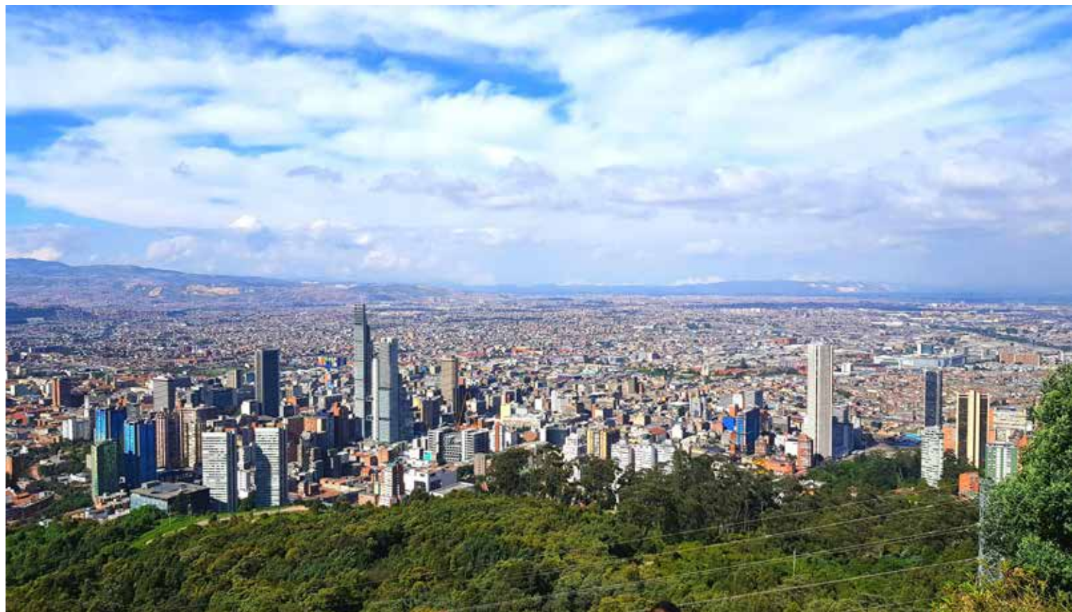
Bogotá Distrito Capital.

Este PDD establece las directrices para garantizar las condiciones de una Bogotá que reestablezca la confianza de la gente en su ciudad. Agregó, como lo decía el padre del alcalde: Bogotá pertenece a todos sus habitantes. Para ello el Plan propone cinco objetivos: Seguridad. Confía en su bien-estar. Confía en su potencial. Ordena su territorio y avanza en su acción climática,