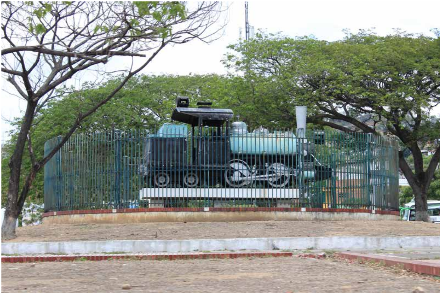
Monumento al ferrocarril de Cúcuta

La labranza del café entró a Colombia por la frontera oriental. La comercialización del grano, junto con la del cacao, fueron los impulsores del movimiento comercial de Cúcuta, ventaja que añadida a la importación de mercancías utilizando el puerto de Los Cachos estimularon el desarrollo de la ciudad, habitada por una emprendedora clase de comerciantes de origen europeo, prin-