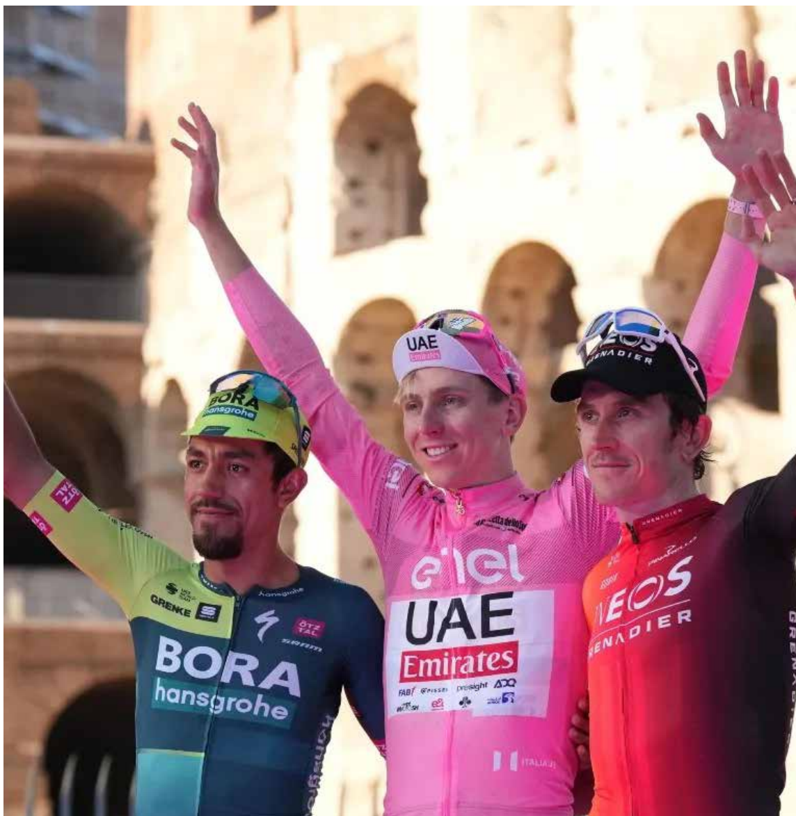
Daniel Felipe Martínez, de Colombia, Tadej Pogacar y Geraint Thomas, en el podio final del Giro de Italia 2024.

¿Pero cómo empezó en el ciclismo? ¿Cuáles son sus orígenes? ¿Cuál es su filosofía dentro y fuera del deporte? Conoce mejor a Tadej Pogacar.