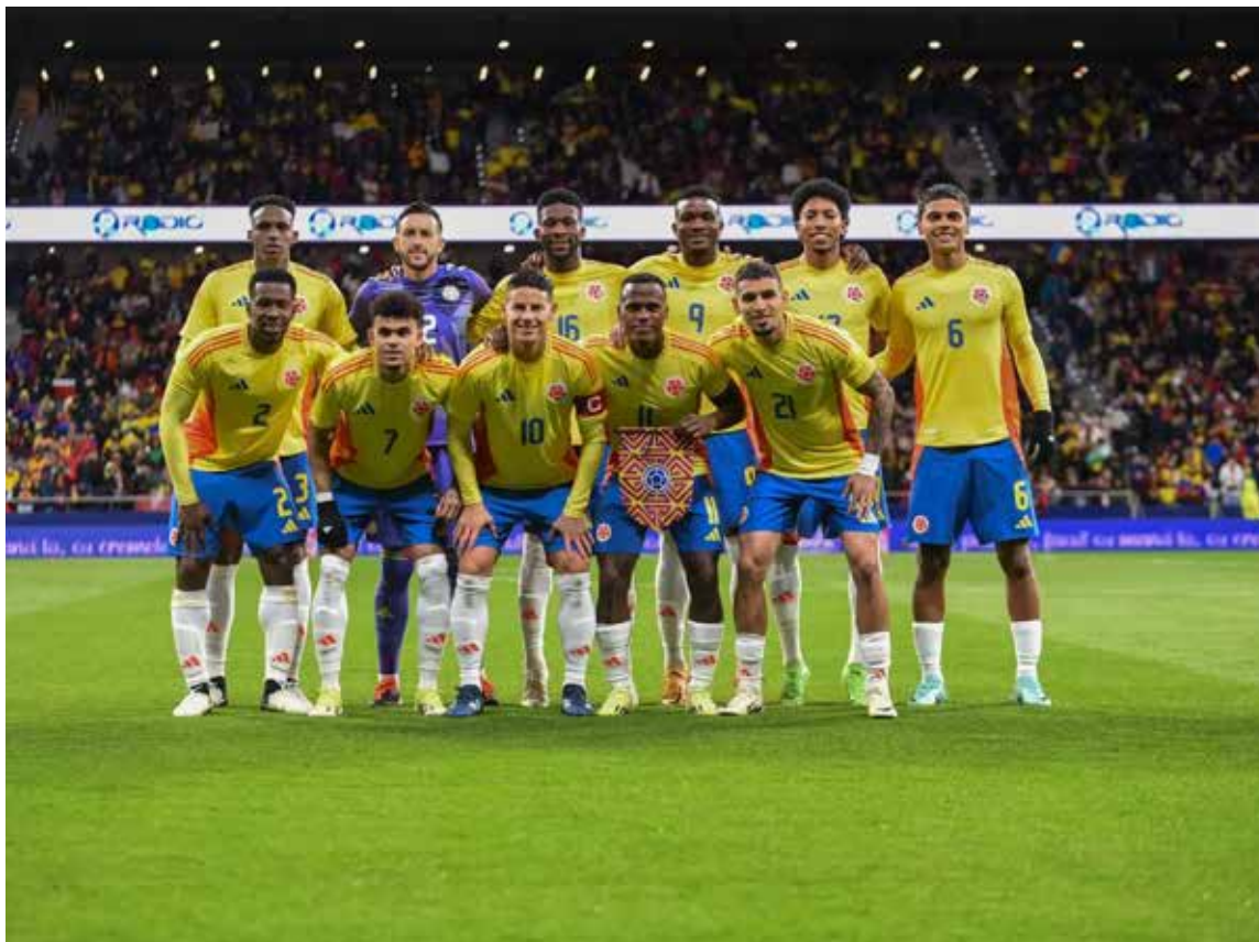
Selección Colombia, la ilusión de un país

Cuando con ella rueda la pelota reaparece el idilio de los aficionados que mezclan deseos con pasión, esperando rendimiento, destacadas actuaciones y resultados.