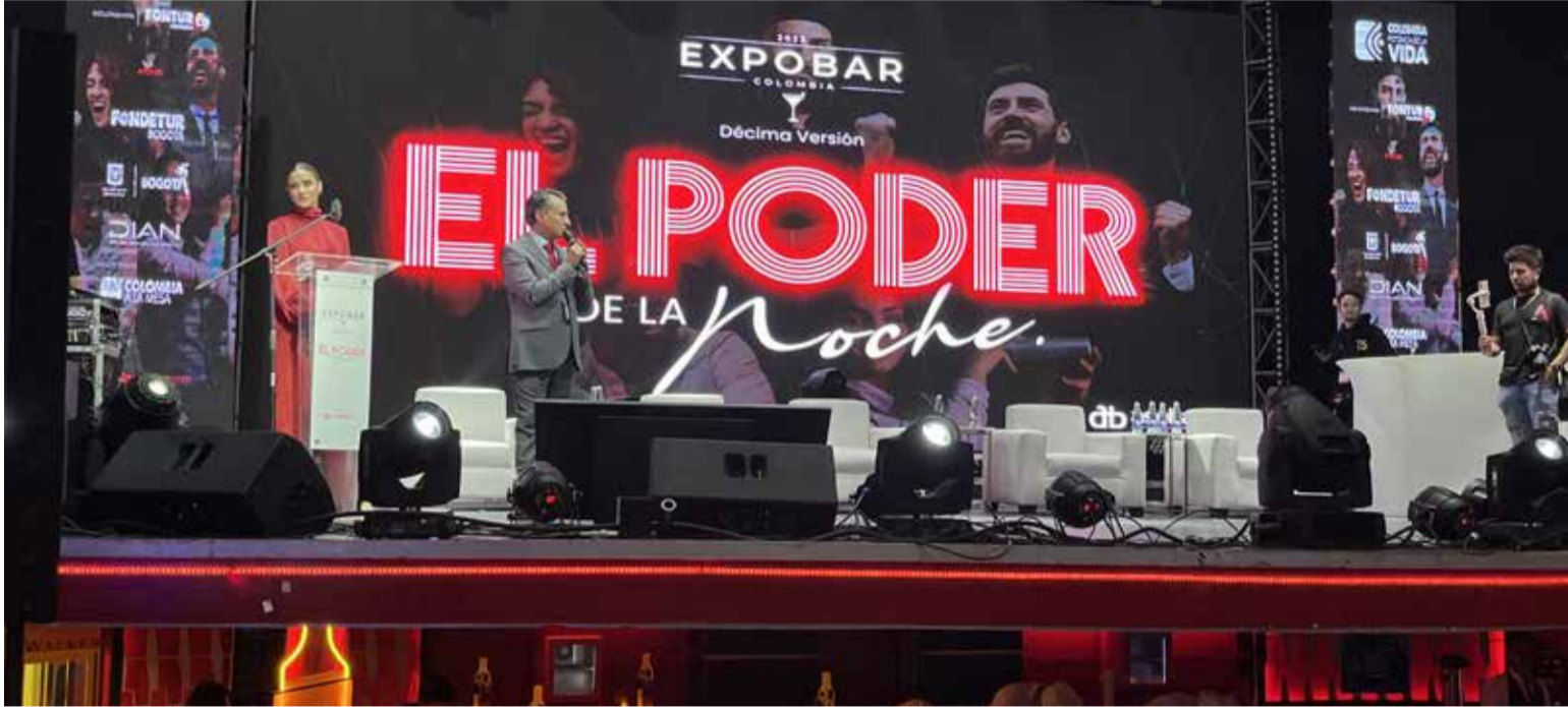
La undécima versión de Expobar llega con la celebración de sus 10 años