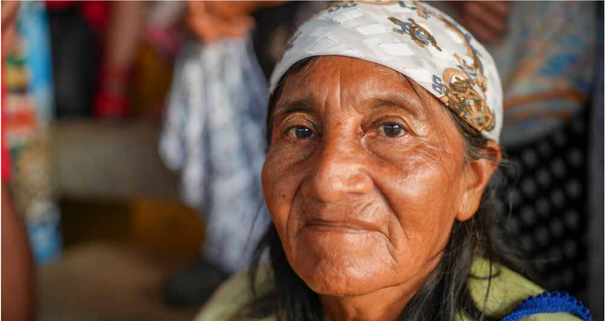
Habitante de Nazareth, a pesar de la emergencia confía en la ayuda de las autoridades nacionales.

N azareth, ubicado en el extremo norte del departamento de La Guajira. Nazareth tiene una población aproximada de 6.000 habitantes y es una zona que se ha visto gravemente afectada por las lluvias de los últimos días. En este momento, no hay acceso por vía terrestre, hay desabastecimiento de alimentos y el corregimiento permanece sin energía eléctrica.