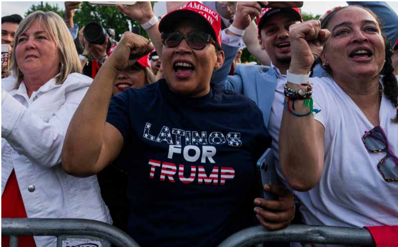
Latinos que apoyaron a Trump

En Colombia, de los 11 mil millones de dólares que cada año le transfieren a sus familias los integrantes de la diáspora regados por todo el mundo, se dice que por lo menos 6 mil millones de tales remesas provienen de los Estados Unidos.