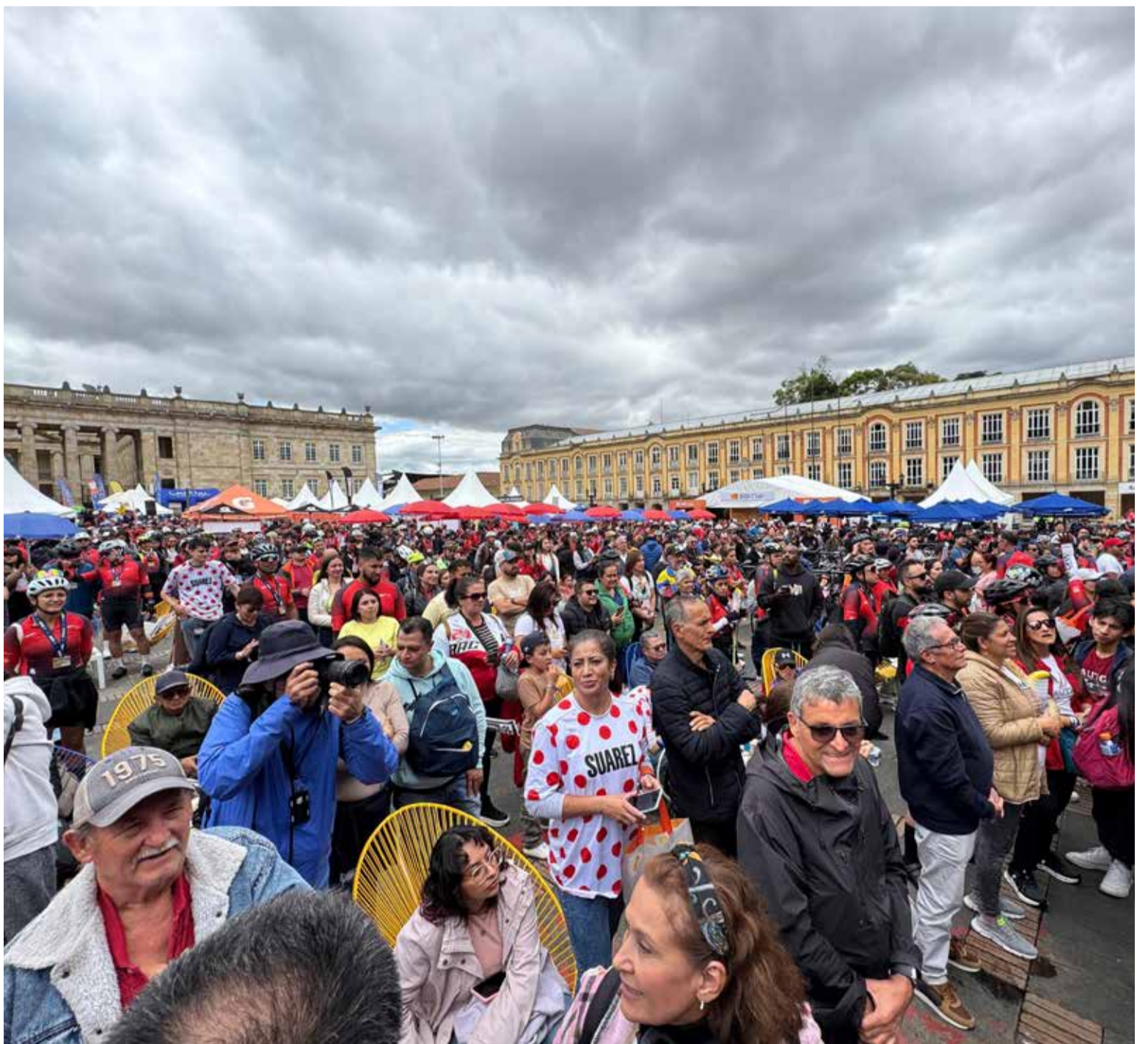
Los bogotanos llenaron la Plaza de Bolívar para poder observar la llegada de los ciclistas.

Ayer Bogotá pasó a la historia porque se celebró por primera vez en sus calles un Gran Fondo de Ciclismo que puso en la lupa este deporte que es fundamental para la movilidad de la capital del país.