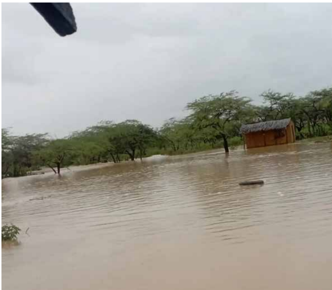
Todo bajo el agua.

El propósito de la visita del Gobierno nacional es visitar las viviendas más afectadas y entablar un dialogo cercano con esta comunidad para revisar de primera mano sus necesidades y encontrar soluciones. A la visita se suman otras