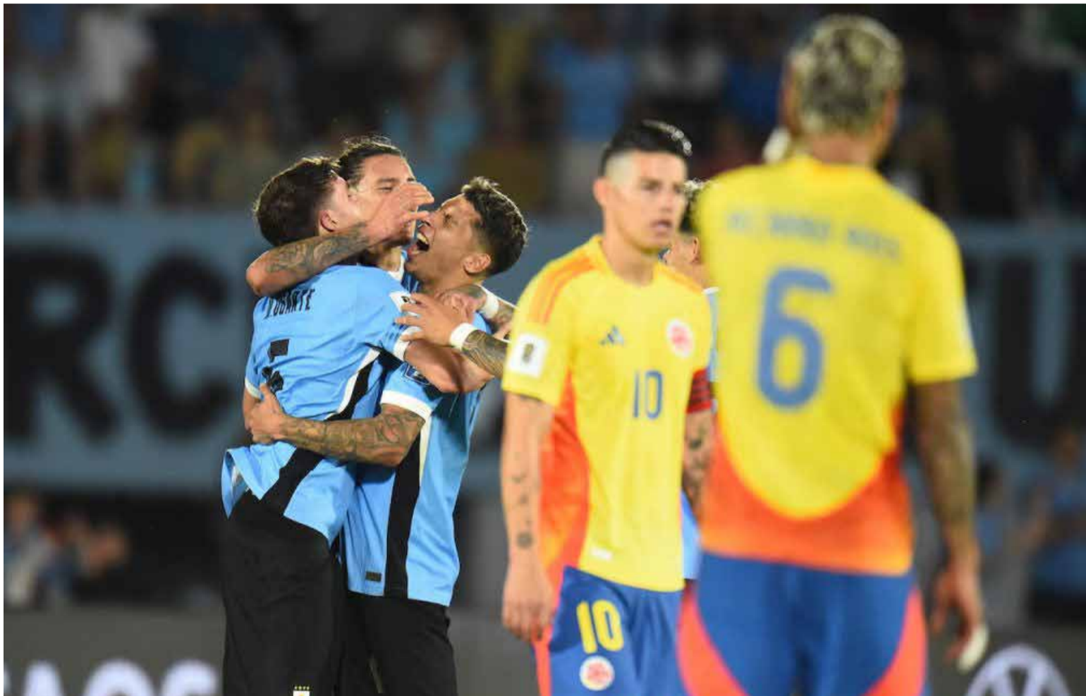
Uruguay festeja, Colombia lamenta.

Juego emocionante, picado, incierto, disputado, con dificultades para encontrar los espacios. Incómodo para los dos rivales, con resultado puesto solo al final. Uruguay con pases largos, Colombia con toques