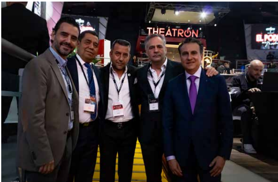
Directivos de Expobar

Este año será una jornada de tres días seguidos, dos en Bogotá y uno en Pereira, ciudad en la que se realizará por primera vez. La llegada de Expobar al Eje Cafetero, sin duda es de gran importancia por ser una región que cuenta con gobernanza nocturna y se ha convertido en uno de los destinos nacionales preferidos. Este evento tam-