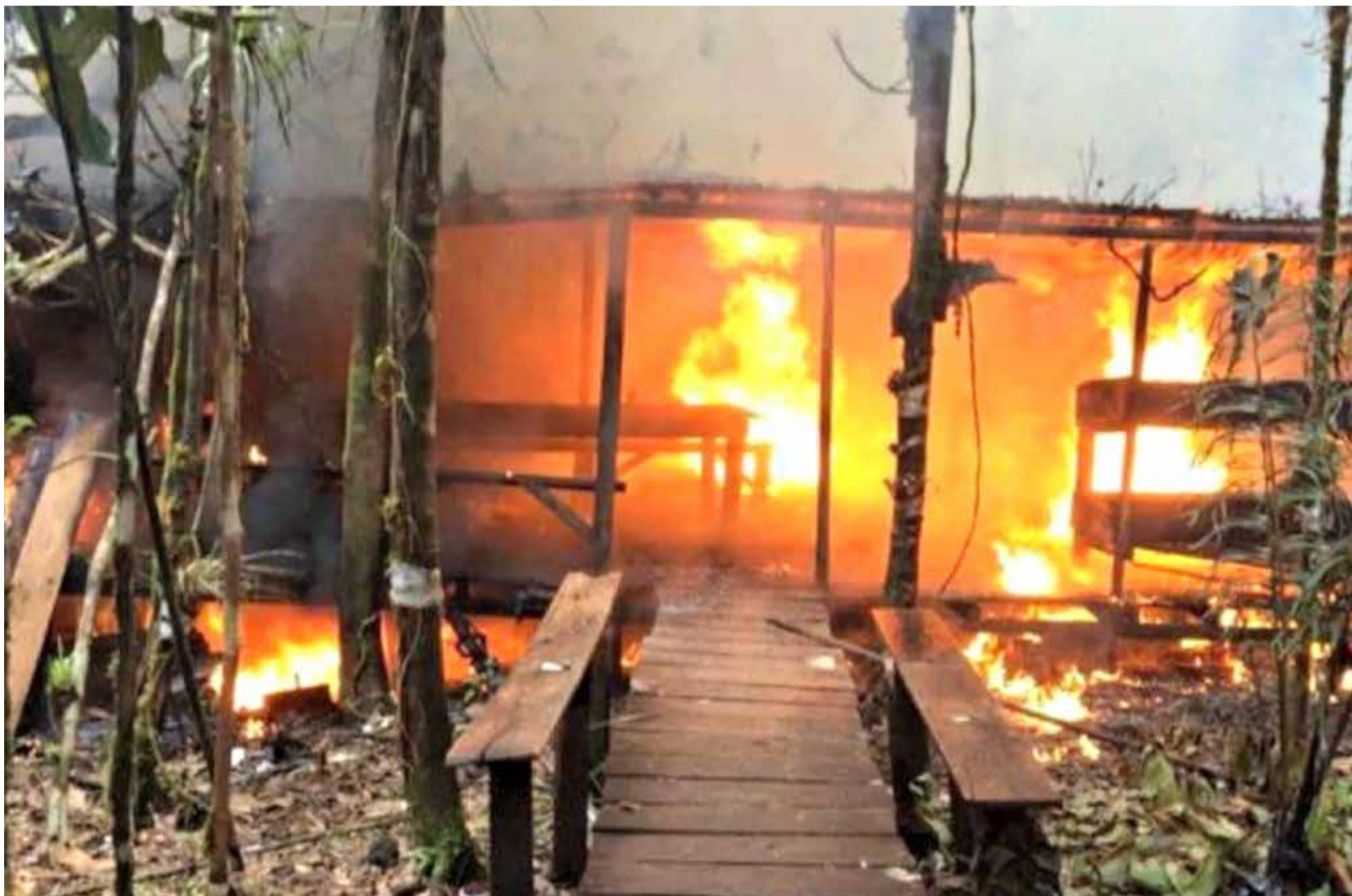
Uno de los laboratorios de cocaína destruidos por las autoridades colombianas.