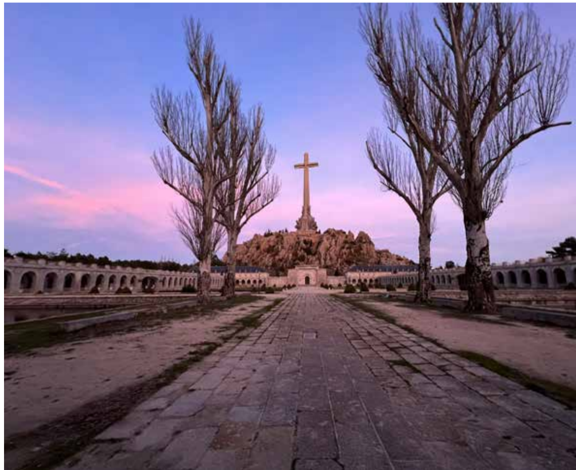
«Valle de los Caídos»

Una puerta de hierro, cerrada, hizo las veces de semáforo. El conductor detuvo el autobús, anunciando que era la parte más alta del risco. ¡Habíamos llegado! Estaba a 1.758 metros sobre el nivel del mar. ¡Yuju! Despepecé las piernas, bajando del vehículo después del último pasajero. Levanté la cabeza para alcanzar, visualmente, la punta de la cruz que estaba ahí, a varios metros. Era una cruz católica monumental. Desde abajo, sentía su tremenda fuerza. ¡Ra-