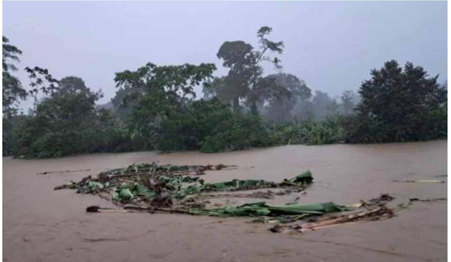
Chocó está inundado

Este proyecto había quedado en suspenso durante la administración anterior y actualmente