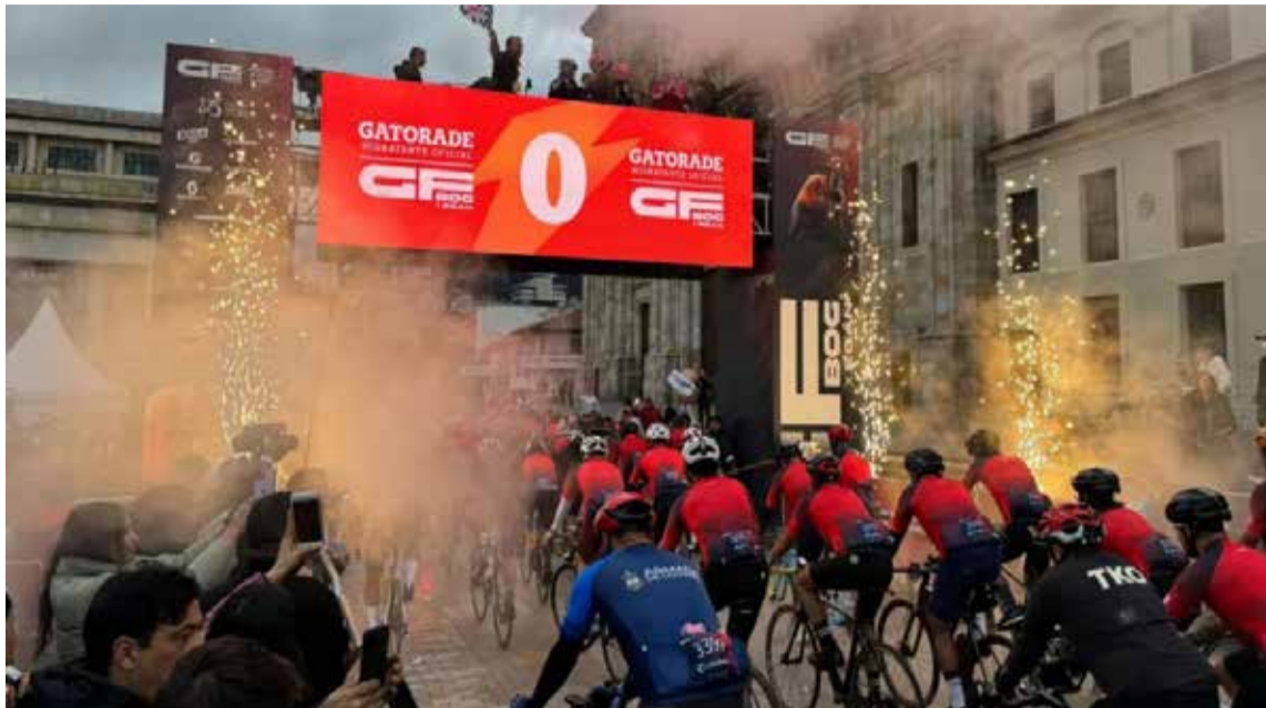
Salida del Gran Fondo de Ciclismo de Bogotá

Es importante recordar que Bogotá fue escogida para organizar este Gran