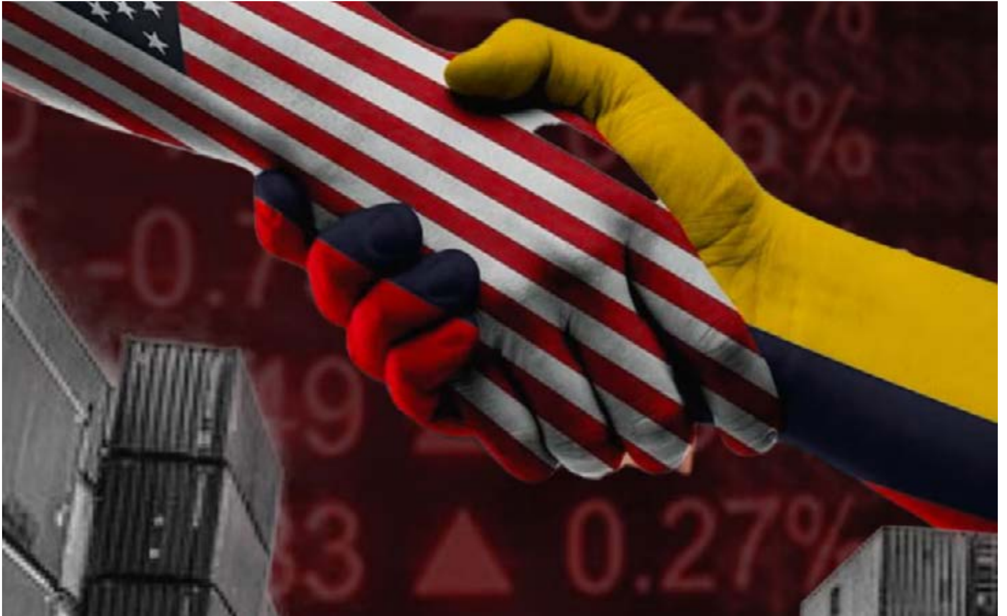
Colombia buscará renegociar el tratado de libre comercio con Estados Unidos

C olombia buscará renegociar los tratados de libre comercio con la Unión Europea y Estados Unidos, en el artículo que hace referencia al tribunal que dirime las demandas entre sus Estados-parte, anunció el presidente Gustavo Petro.