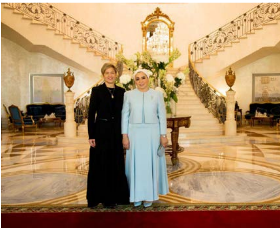
La primera dama de Egipto, Entissar Al Sisi, fue invitada a Colombia.

Entre los encuentros que sostuvo la señora Verónica Alcocer se destacan la reunión con su homóloga,