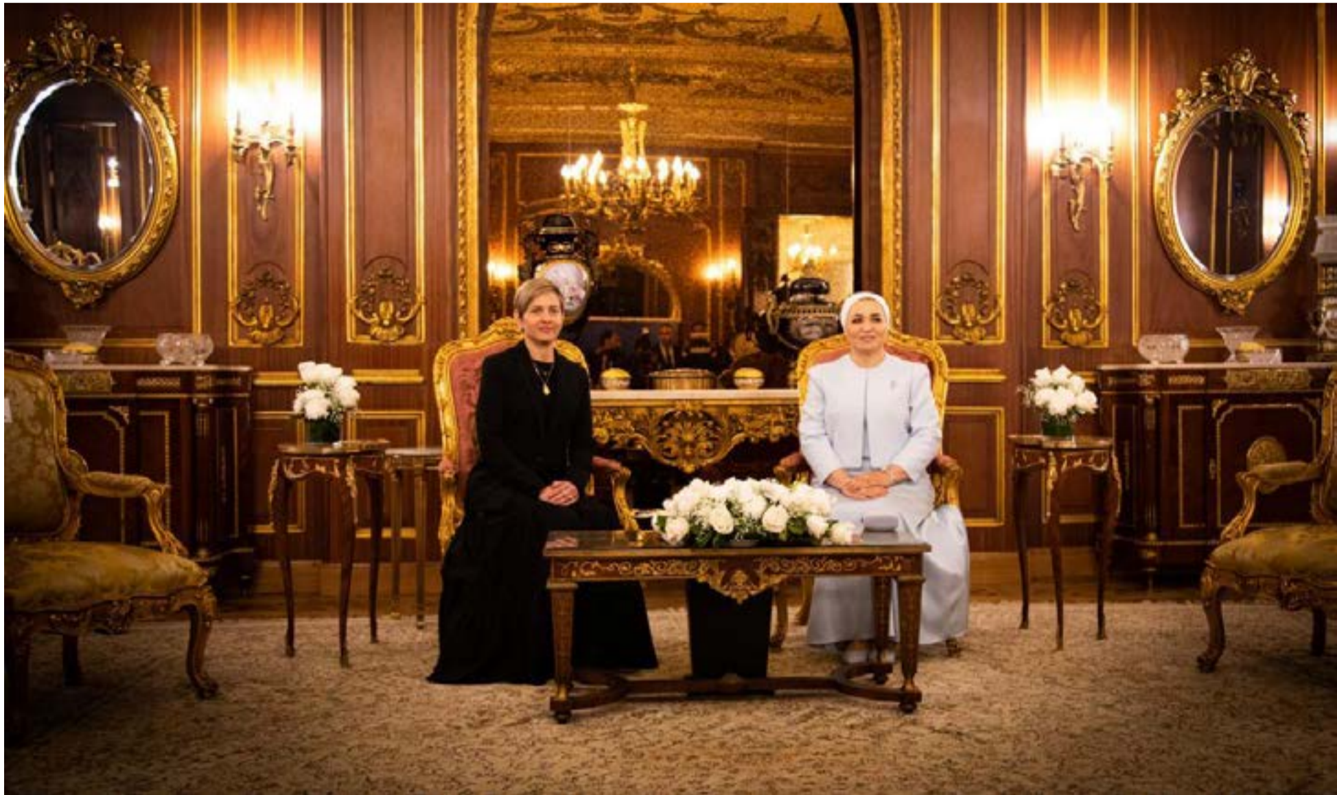
La primera dama de la Nación, Verónica Alcocer García y la primera dama de Egipto, Entissar Al Sisi.

La primera dama de la Nación, Verónica Alcocer García, adelanta una agenda de trabajo en Egipto, enfocada en fortalecer la cooperación internacional para impulsar los proyectos sociales que se adelantan en el país.