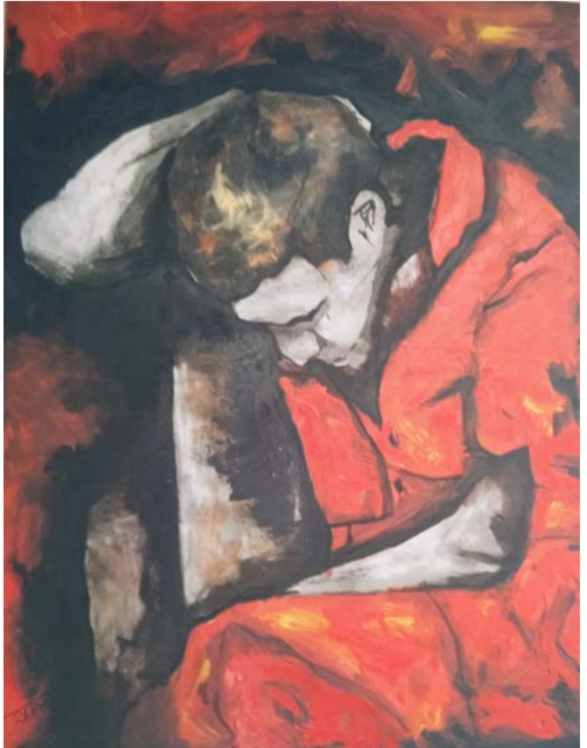
Los personajes son seres humanos en general, pero casi siempre busco el tema de su interioridad, de sus experiencias y cómo reaccionan a ello a ello.