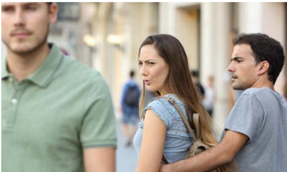
Los celos son un sentimiento de temor a perder a la persona amada.

Inseguridad: el hombre o la mujer celoso (a), sufre una inmensa inseguridad de lo que ella es y de lo que posee. En algunos casos puede deberse a situaciones difíciles del pasado o