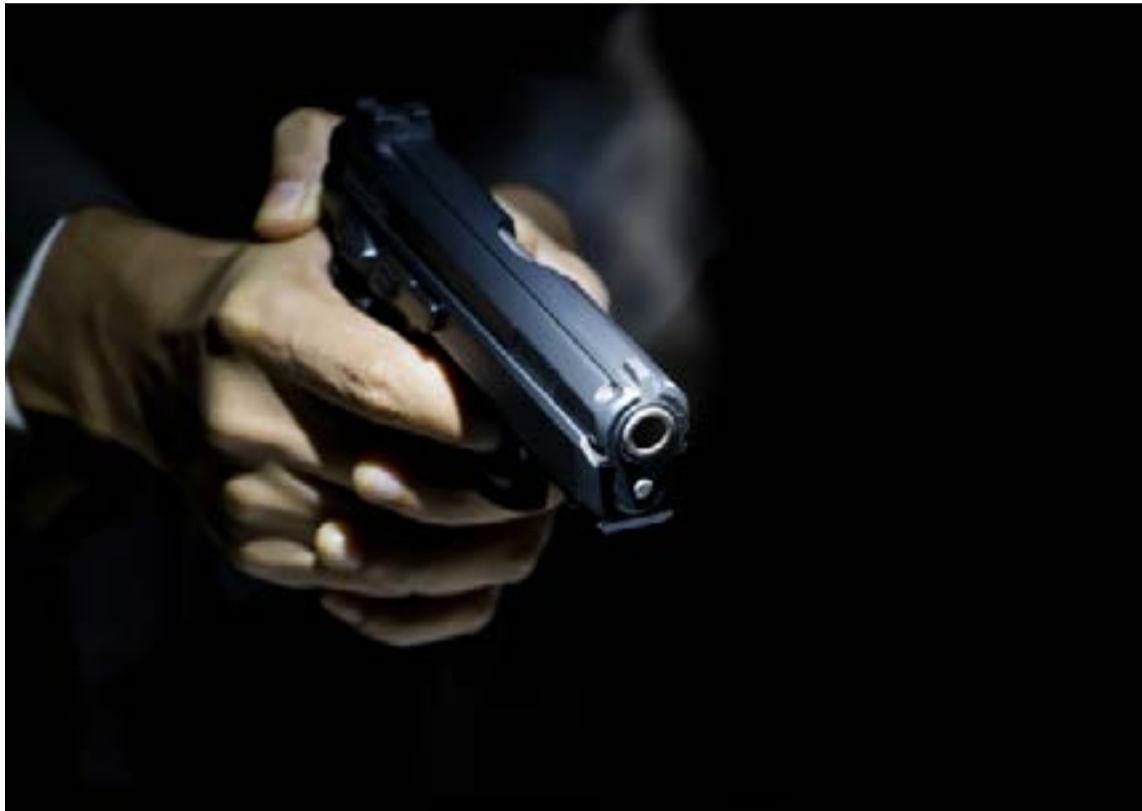
Habla el sicario

La Policía Metropolitana tiene información de que en Bogotá hay por lo menos tres de estas oficinas, que tienen como fachada negocios legales y prestan seguridad a «tra-