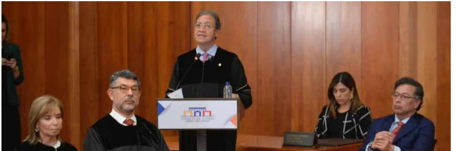
El presidente Petro en la posesión de los nuevos magistrados del Consejo de Estado.

En la ceremonia, que se llevó a cabo en el recinto de la Sala Plena del Consejo de Estado, el mandatario acompañó al juramento de los magistrados que harán parte de las secciones segunda, tercera y cuarta de este alto tribunal de lo Con-