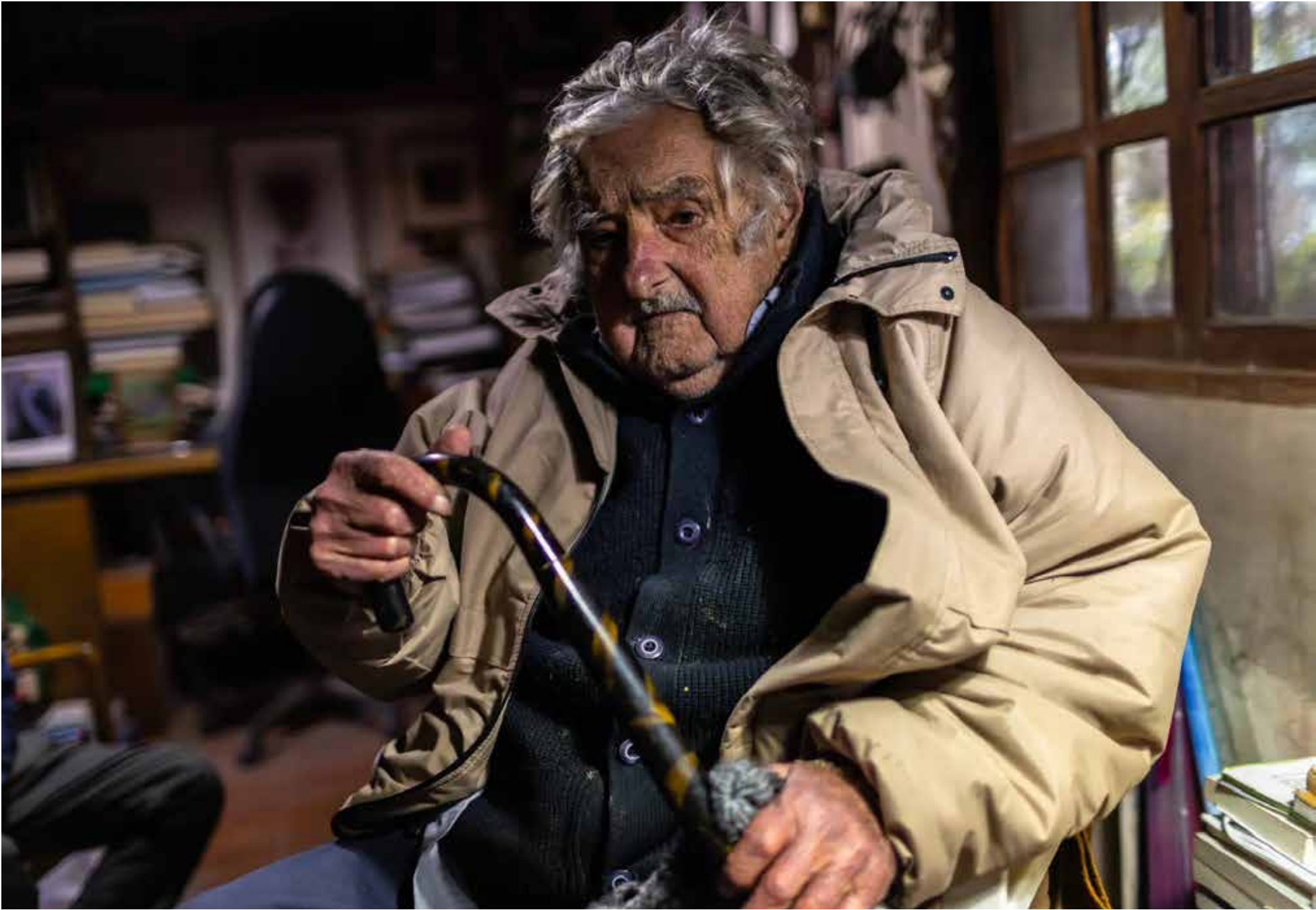
«Estoy peleando con la muerte»