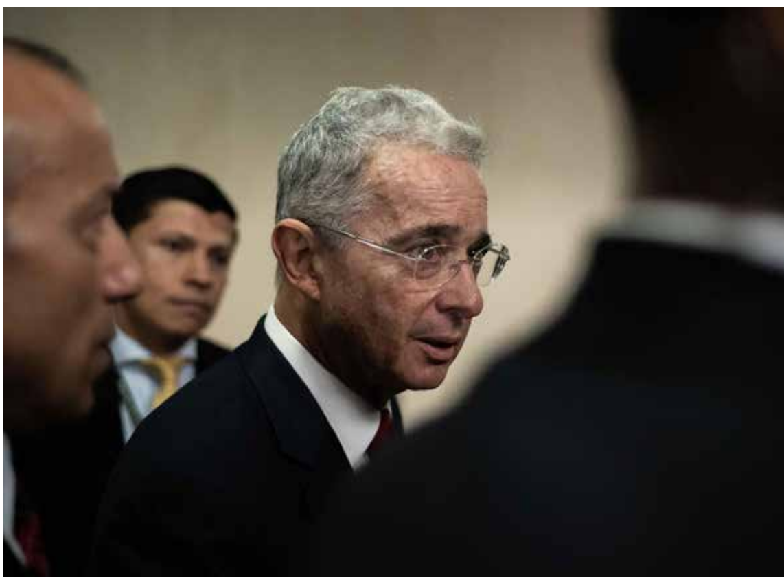
Álvaro Uribe, pasó de acusador a acusado. Sus contradictores dicen que le: «Salió el tiro por la culata»

El Tribunal Superior de Bogotá declaró legales las interceptaciones telefónicas realizadas al expresidente Álvaro Uribe