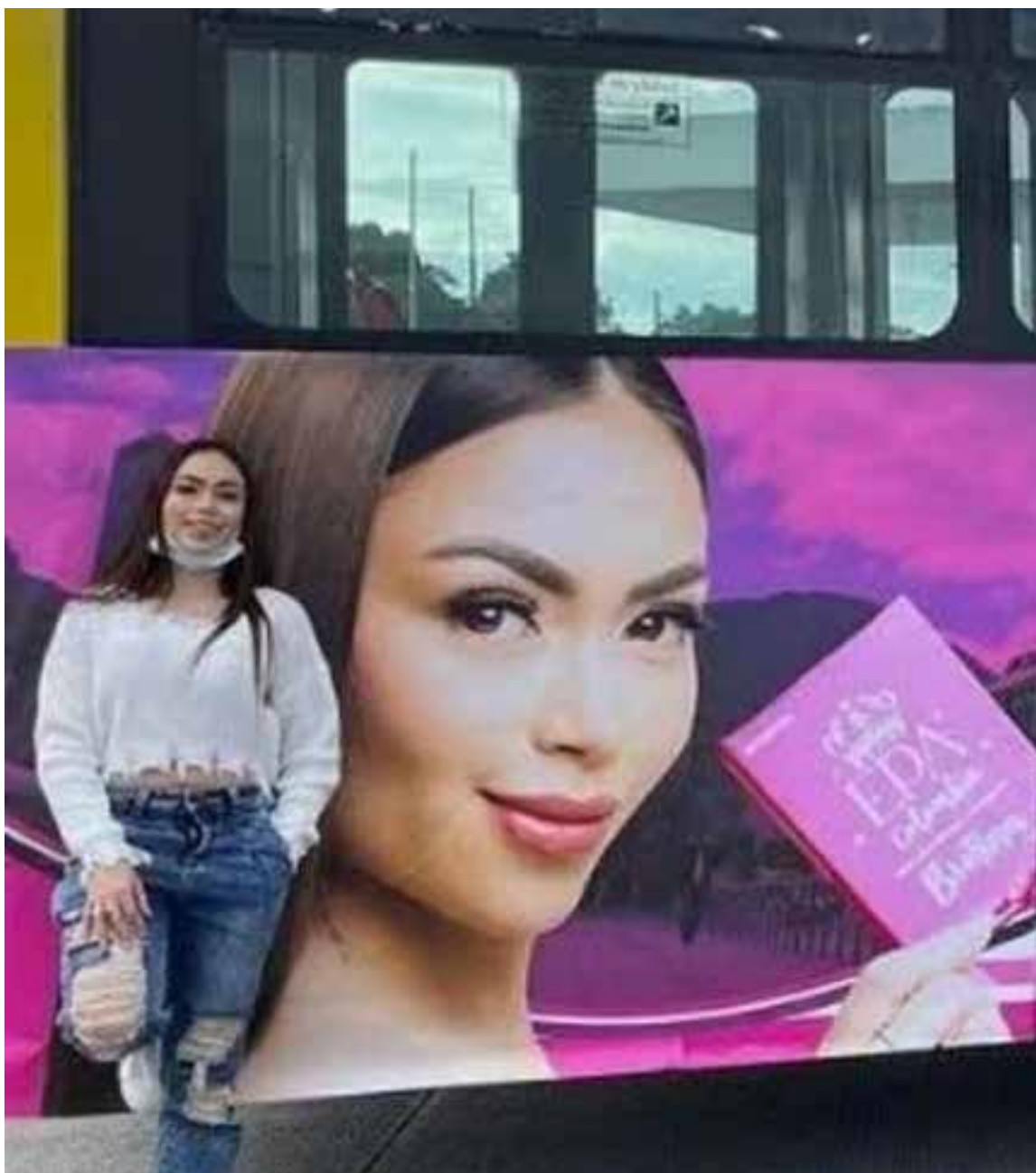
Luego Daneidy Barrera le pagó a la empresa Transmilenio el monto de $65.450.000 millones de pesos colombianos para promocionar sus productos.

La ciudadana Daneidy Barrera Rojas no asesinó, ni robo, ni extorsionó a nadie pero sí realizó unos hechos de vandalismo consistente en dañar bienes ajenos, perturbación en el servicio de transporte público e instigación a delinquir con fines terroristas; por su indebida acción millones de personas fueron afectadas. «Epa Colombia», haciendo eco a su apodo, mostró como un trofeo su hazaña vandálica en muchas redes sociales y la mayoría de co-