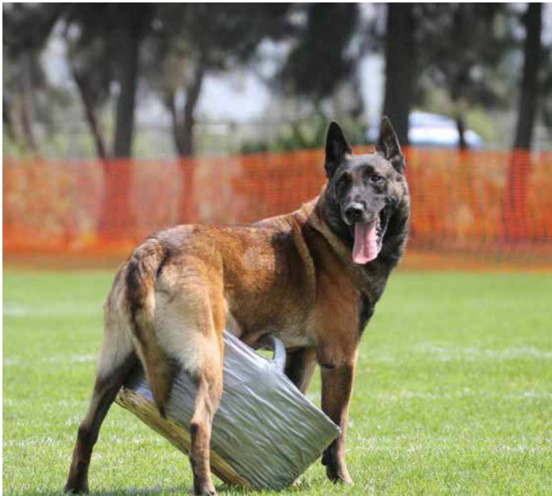
El ring francés es uno de los deportes de mordida de mayor tradición en el mundo, se practica originalmente en Francia desde finales del siglo XIX. Se utiliza como un programa en la selección de crianza de razas de perros de trabajo.

Este deporte satisface las necesidades instintivas básicas ya que le permite canalizar su energía por medio de la mordida y la caza de su presa. El resultado es un perro de mente estable y social que tiene un vínculo estrecho con su amo el cual disfruta de un perro saludable, ágil y obediente.