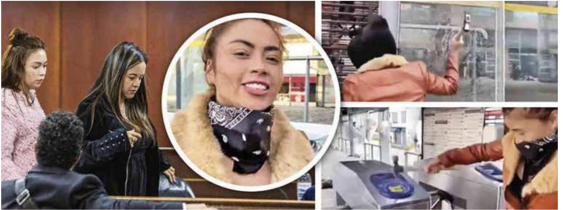
Primero vandalizó una estación del transporte público en Bogotá