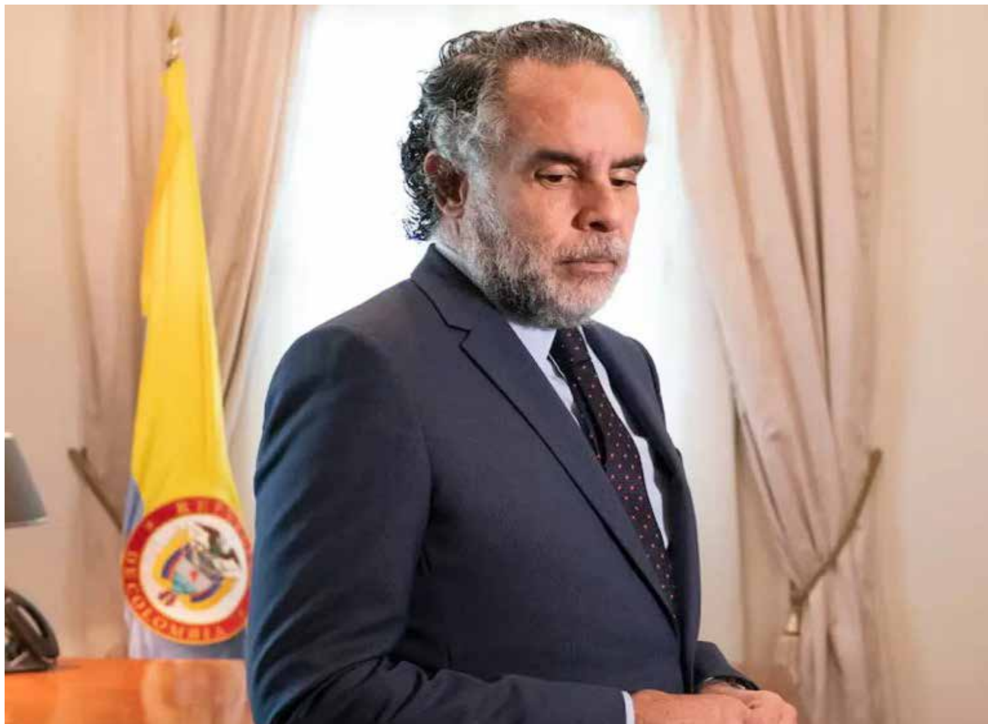
Armando Benedetti, Jefe de Gabinete Presidencia de la República.

Una polémica de grandes proporciones se desató en el país ante el nombramiento de Armando Benedetti, como Jefe de Despacho (Gabinete) en la Presidencia de la República.