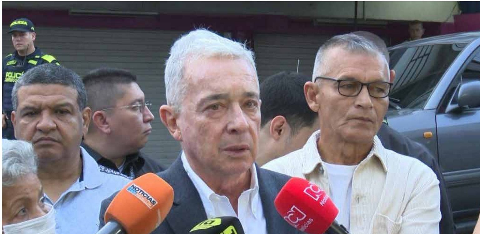
Álvaro Uribe en el banquillo de los acusados

El juicio en contra del expresidente Álvaro Uribe Vélez iniciará el próximo jueves 6 de enero a las 8:30 a.m.