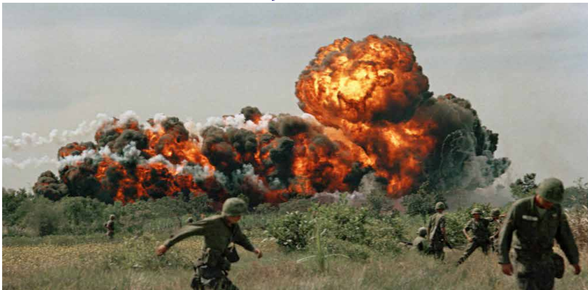
La guerra afectará a toda la humanidad.