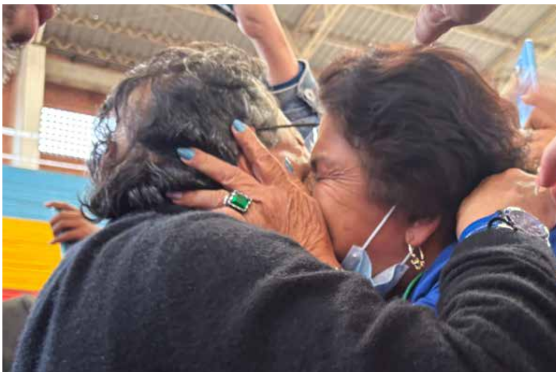
Petro se reunió con los recicladores en Sohacha y fue objeto de muestras de cariño.

El presidente de los colombianos, Gustavo Petro, recordó la persecución política desde la Procuraduría General de la Nación. «Nunca pensé que aplicar una sentencia de la Corte Constitu-