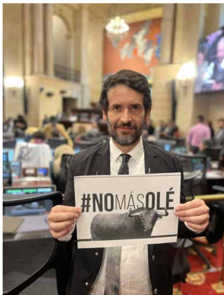
Juan Carlos Losada Vargas, representante a la Cámara

Es indudable el desprestigio del Congreso, pero también es indudable que hay excelentes congresistas que cumplen sus funciones de manera cabal y transparente.