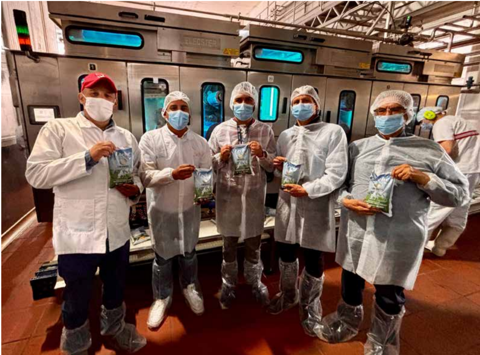
«Nuestro objetivo es comercializar esta leche a través de canales formales y que forme parte de programas sociales».

vocación lechera, beneficiando a más de 1.500 personas en la primera fase. La iniciativa busca asegurar que los pequeños productores puedan contar con un mercado formal y estable, clave para garantizar sus ingresos y mejorar la sostenibilidad de sus fincas.