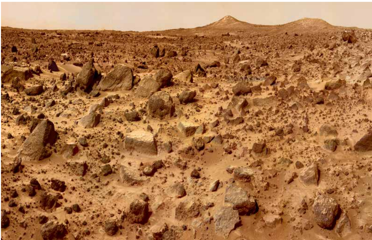
Partes de su superficie pueden haberse parecido vagamente a esta vista de Marte, uno de los planetas vecinos de la Tierra.

En 2100, las temperaturas podrían aumentar tanto que pasar unas horas fuera de algunas de las principales capitales del sur y el este de Asia podría resultar letales