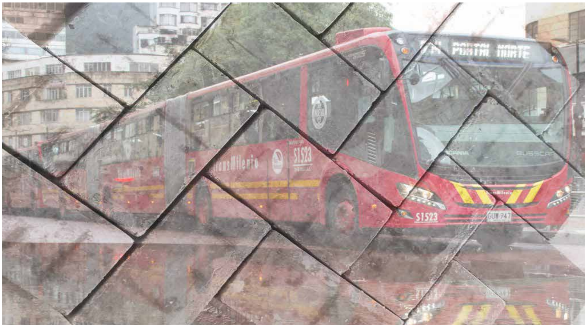
Los adoquines fabricados con material reciclado fueron más resistentes que los tradicionales.