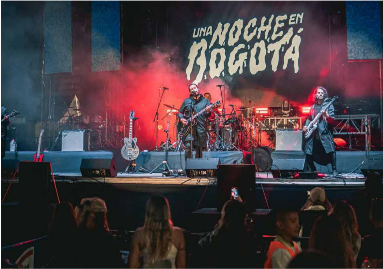
La banda colombiana de indie rock alternativo Una Noche en Bogotá