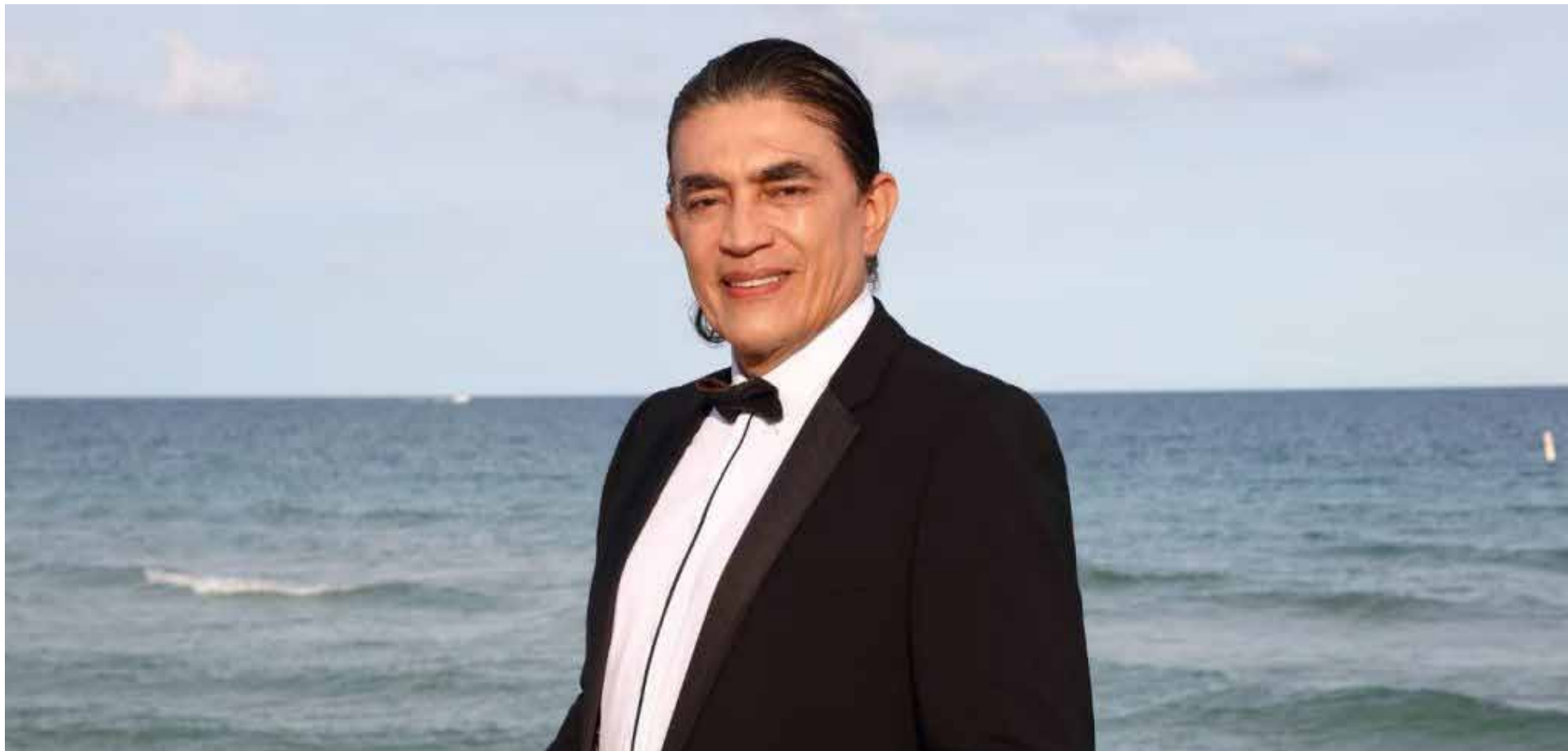
Gustavo Bolívar Moreno, precandidato presidencial.