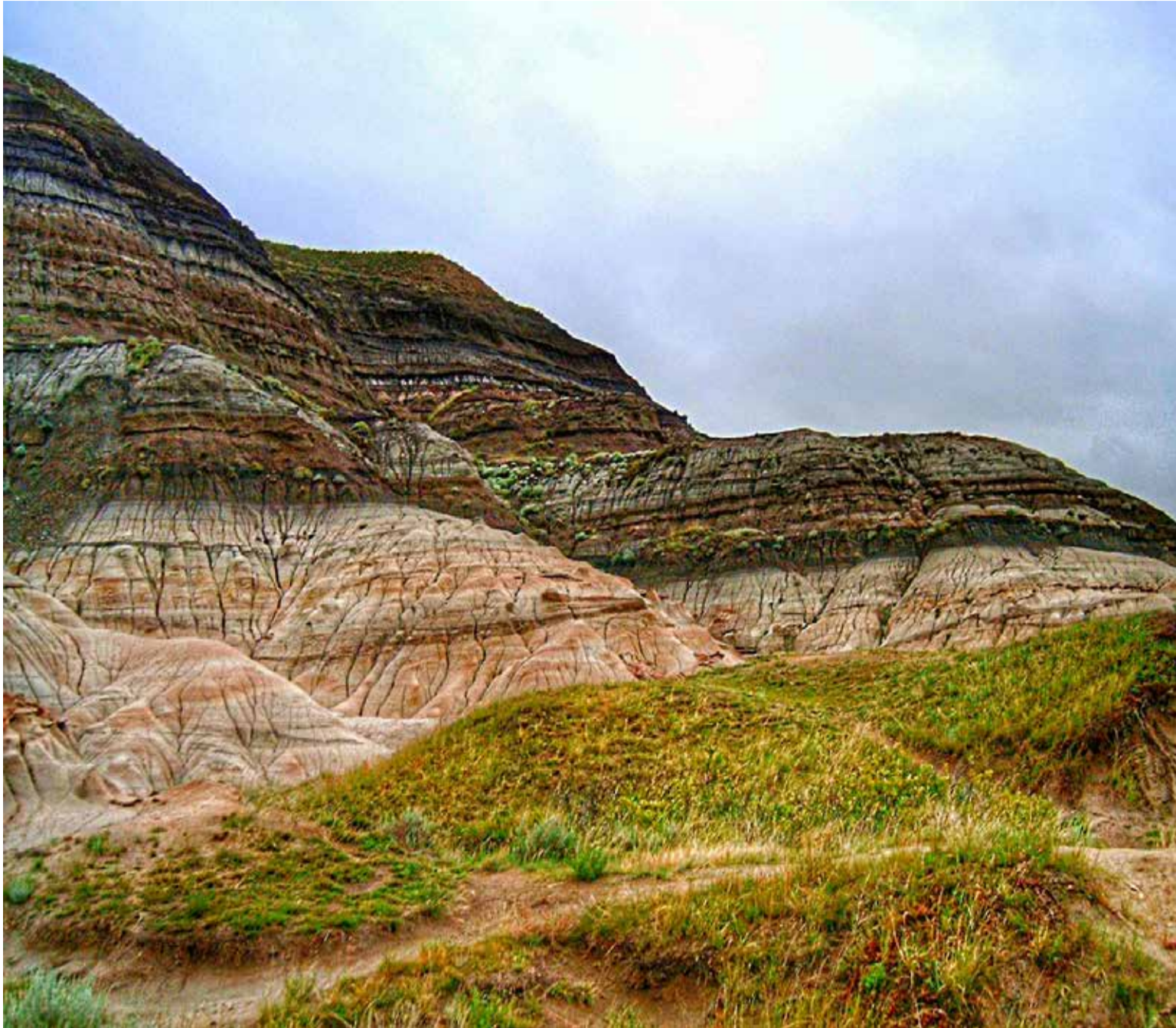
El efecto invernadero permite la reanudación masiva de la erosión, que absorbe CO2 en exceso. CO2.