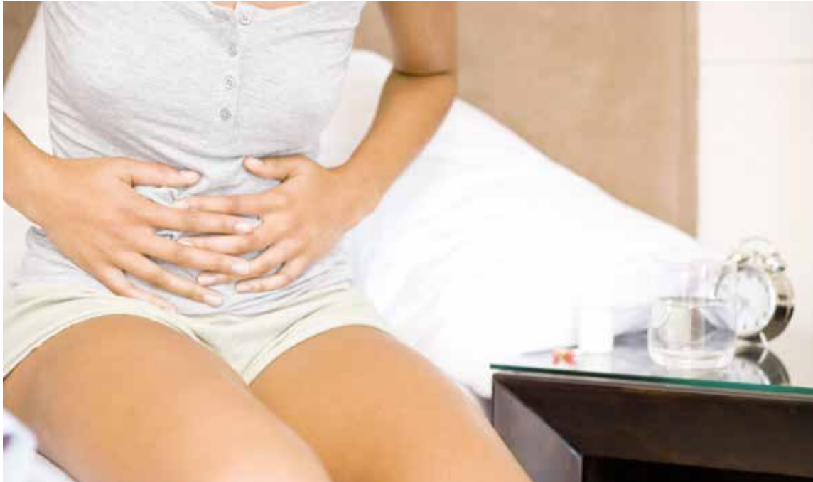
Los síntomas más comunes del recrudecimiento de la enfermedad son de dolor abdominal y diarrea.