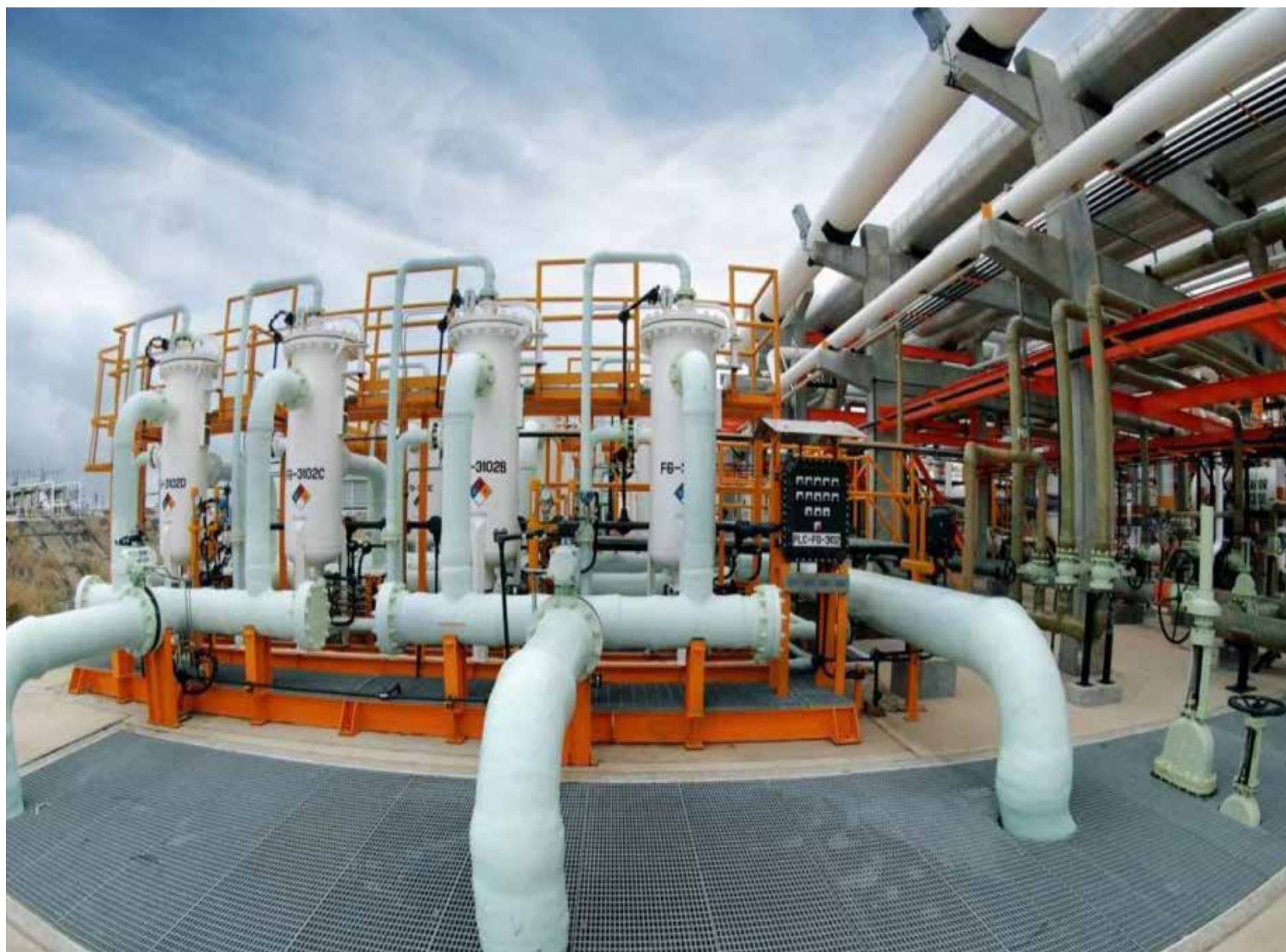
Planta de gas natural

E l Ministerio de Minas y Energía les pidió a las Superintendencias de Servicios Públicos Domiciliarios y de Industria y Comercio adelantar las acciones pertinentes «para proteger a los usuarios residenciales, comerciales e industriales en distintas regiones del país que se verán afectados por el alza en las tarifas»