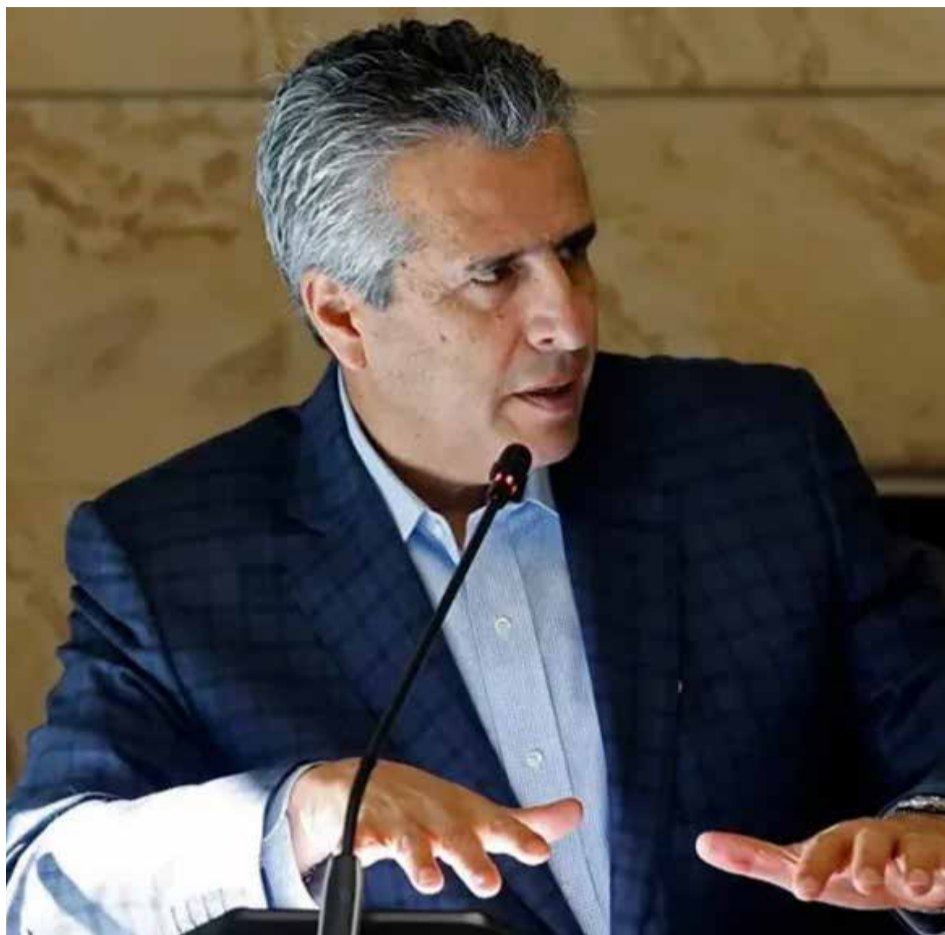
Luis Fernando Velasco, exministro.