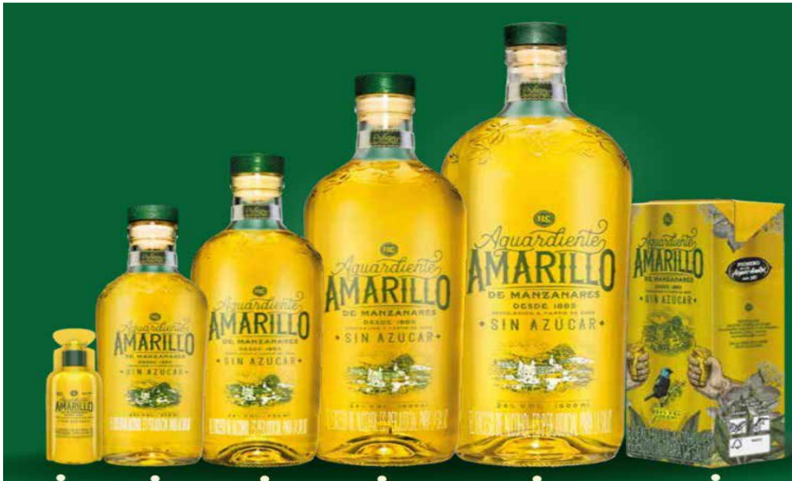
Aguardiente Amarillo de Manzanares

En un fallo que puede resultar histórico, la Corte Constitucional desmontó la decimonónica facultad que tenían los departamentos de autorizar o no el consumo de aguardiente. Desde la Constitución de