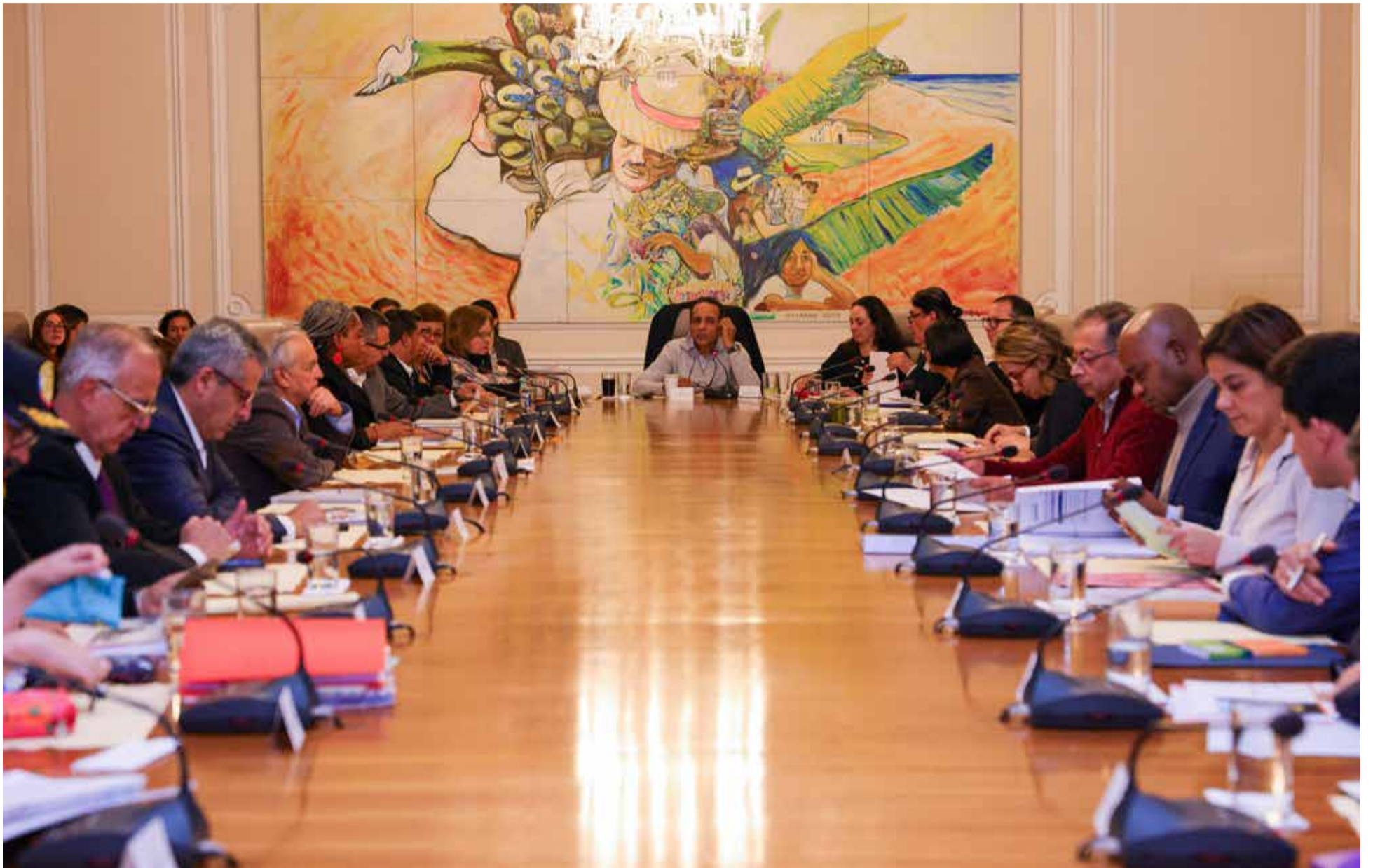
Buena parte de los ministros serán relevados de sus cargos

E l polémico Consejo de Ministros del gobierno Petro. Originó que el jefe del Estado solicitará la renuncia protocolaria de los ministros y directores de Institutos descentralizados.