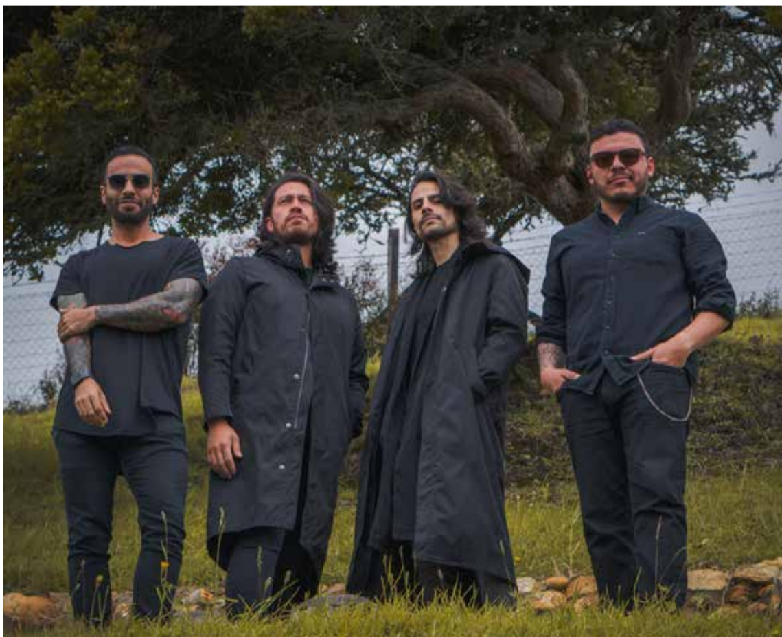
«Queremos que esta canción marque el estilo del grupo y del álbum que vamos a lanzar durante este 2025»

La banda colombiana de indie rock alternativo Una Noche en Bogotá inicia el año con nueva música y hoy presenta 'Resolución', una canción que habla de una persona que estuvo durante mucho tiempo en una relación tóxica con algo (no necesariamente una pareja), y después de mucho tiempo por fin pudo salir de ella y retomar su vida. Es una carta de liberación donde esa persona se dice a sí misma «ya salí del infierno, ya salí de la oscuridad», resolviendo todo lo malo que implicaba estar en esa relación y le da la