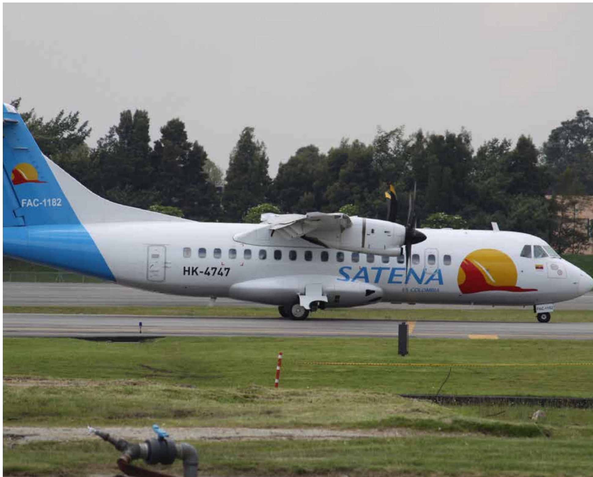
Satena la línea oficial del 58º Festival de la Leyenda Vallenata

Con el objetivo de atender la alta demanda de viajeros que se movilizarán hacia Valledupar para el 58º Festival de la Leyenda Vallenata, que se realizará del 30 de abril al 3 de mayo, Satena, la aerolínea de los colombianos, anunció el incremento de frecuencias en sus vuelos para movilizar a los asistentes a este evento emblemático