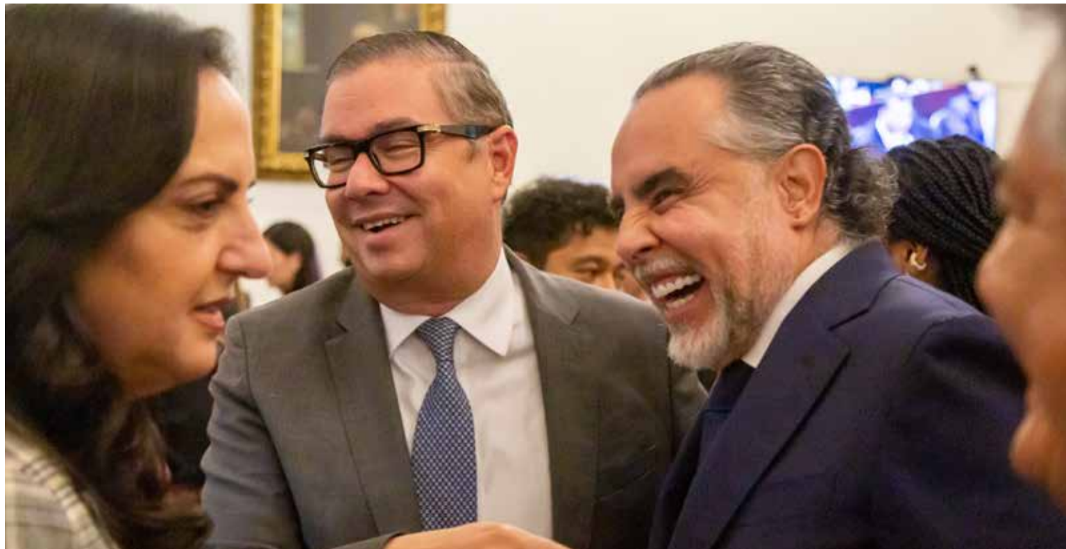
La bienvenida a Benedetti en el Congreso se la dieron María Fernanda Cabal del Centro Democrático y Fabio Raúl Amín, del Partido Liberal.

A rmando Benedetti, llegó al Congreso de la República, acompañado por varios funcionarios de la Casa de Nariño de la luego de haber sido nombrado como ministro del Interior.