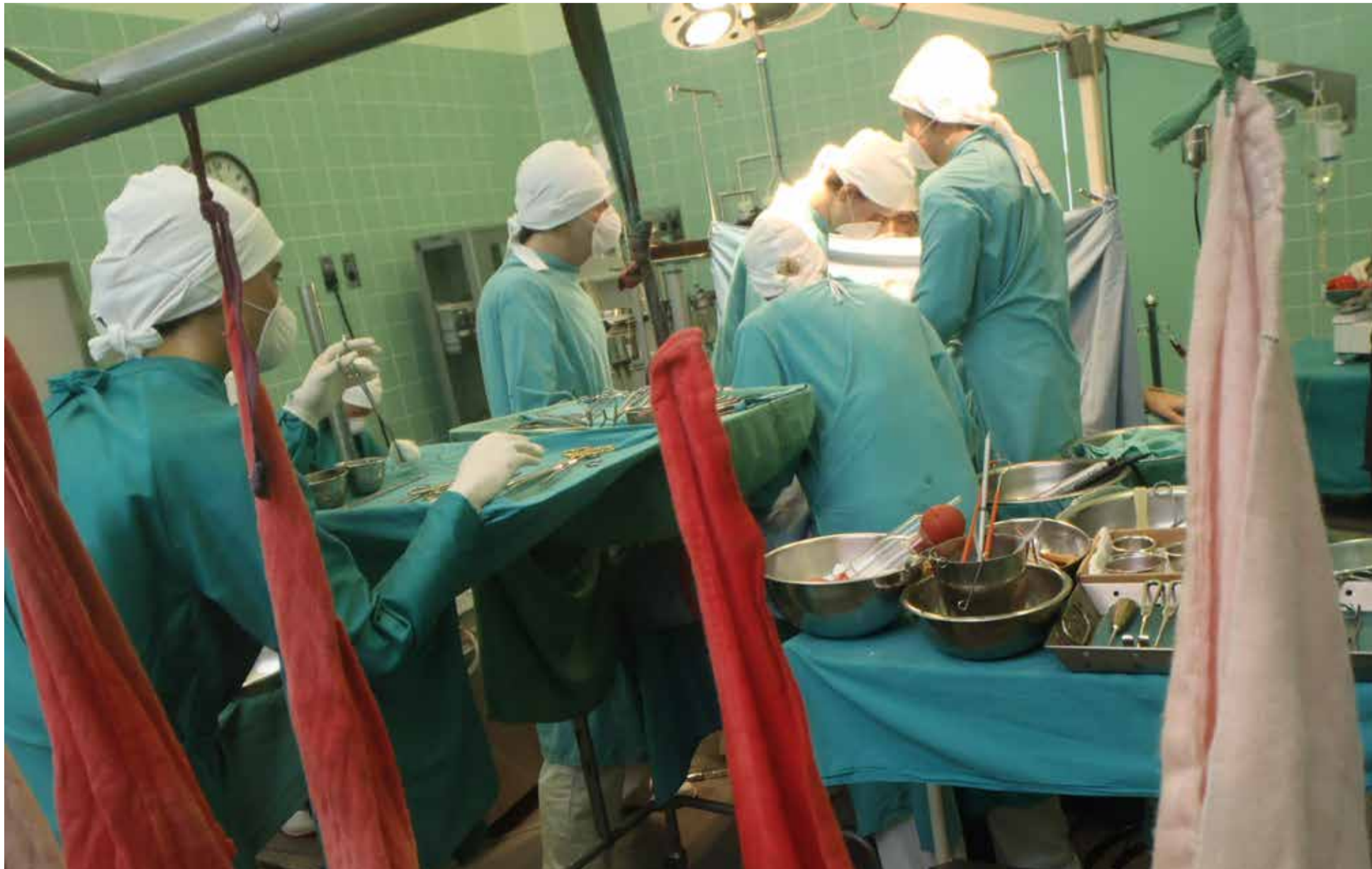
EL primer trasplante de corazón, realizado en Sudáfrica en 1967