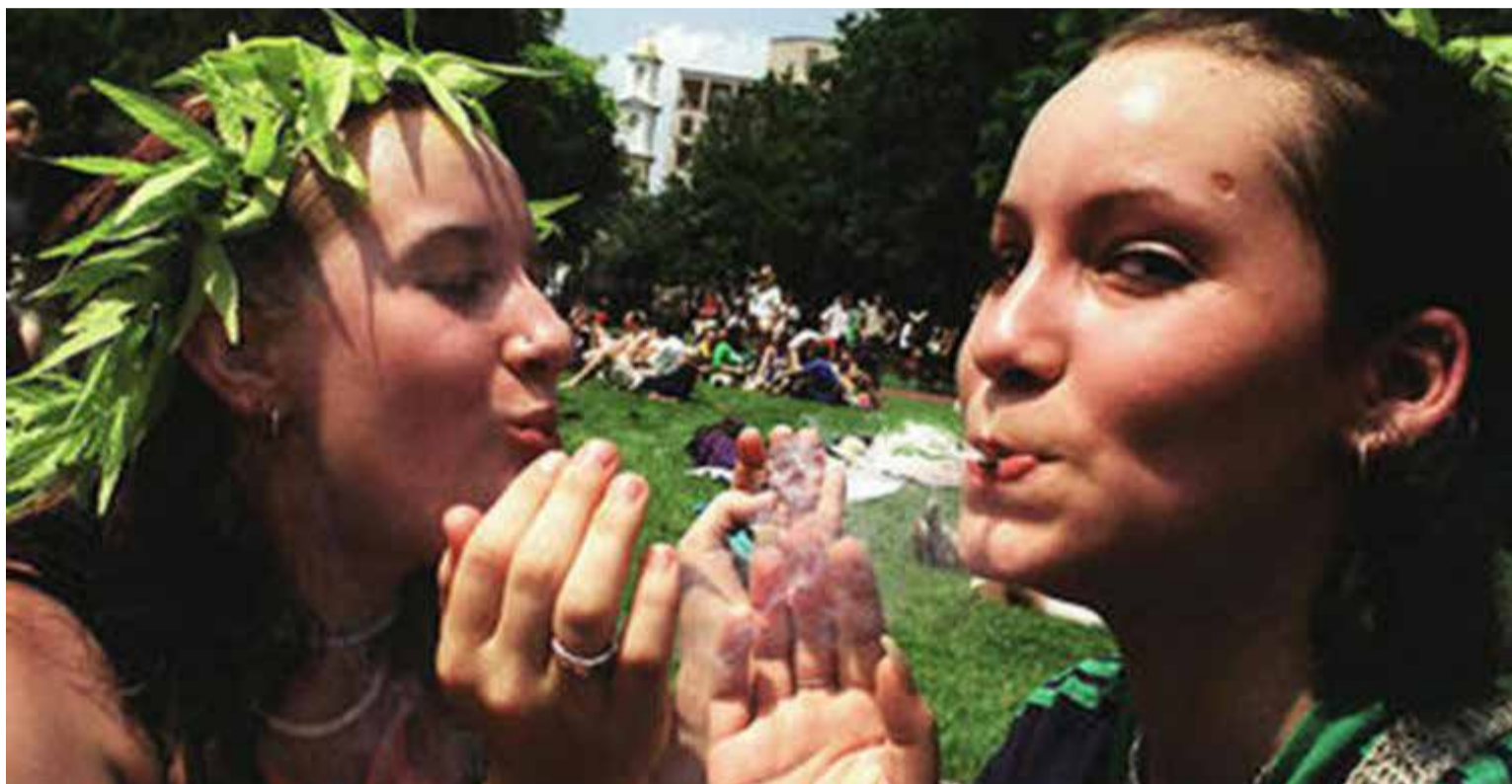
Al cabo de un mes de haber recibido el alta, entre los adictos a la cocaína que fumaron marihuana, el 77% se mantuvo en abstinencia.