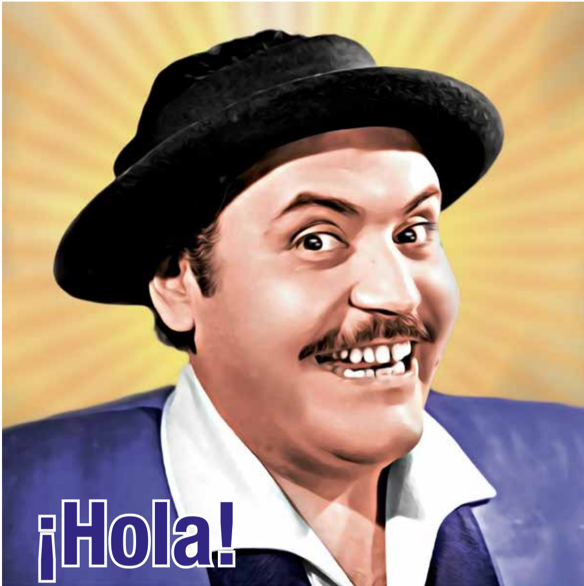
«No lo sé, puede ser, a lo mejor, tal vez, quién sabe...»:Capulina