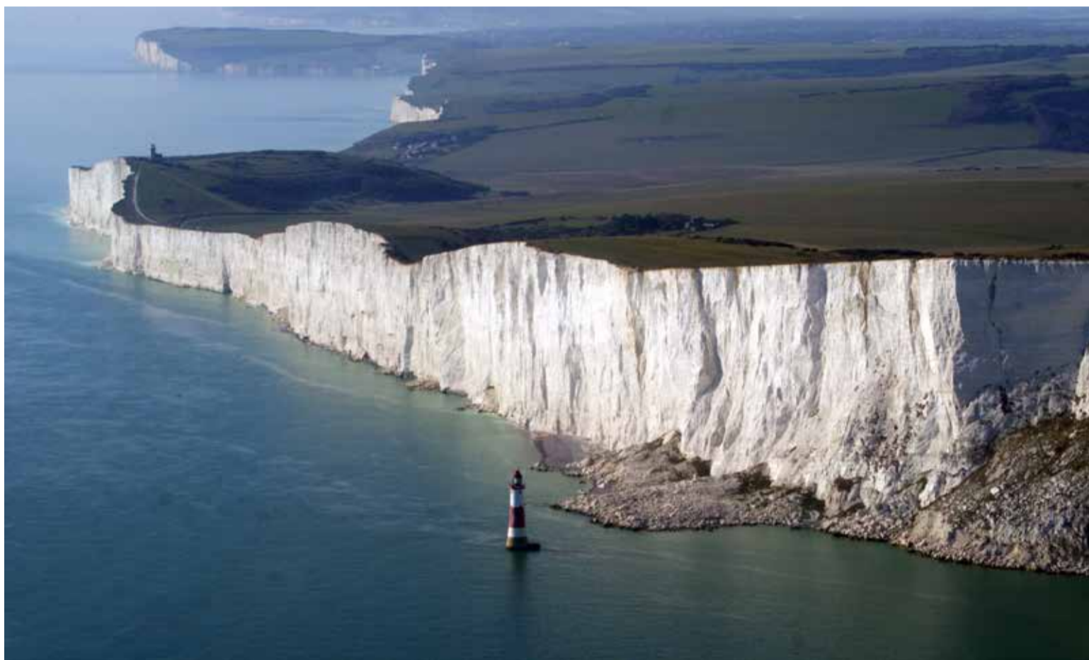
Agua de los océanos cada día ocupa mayor territorio en el planeta.