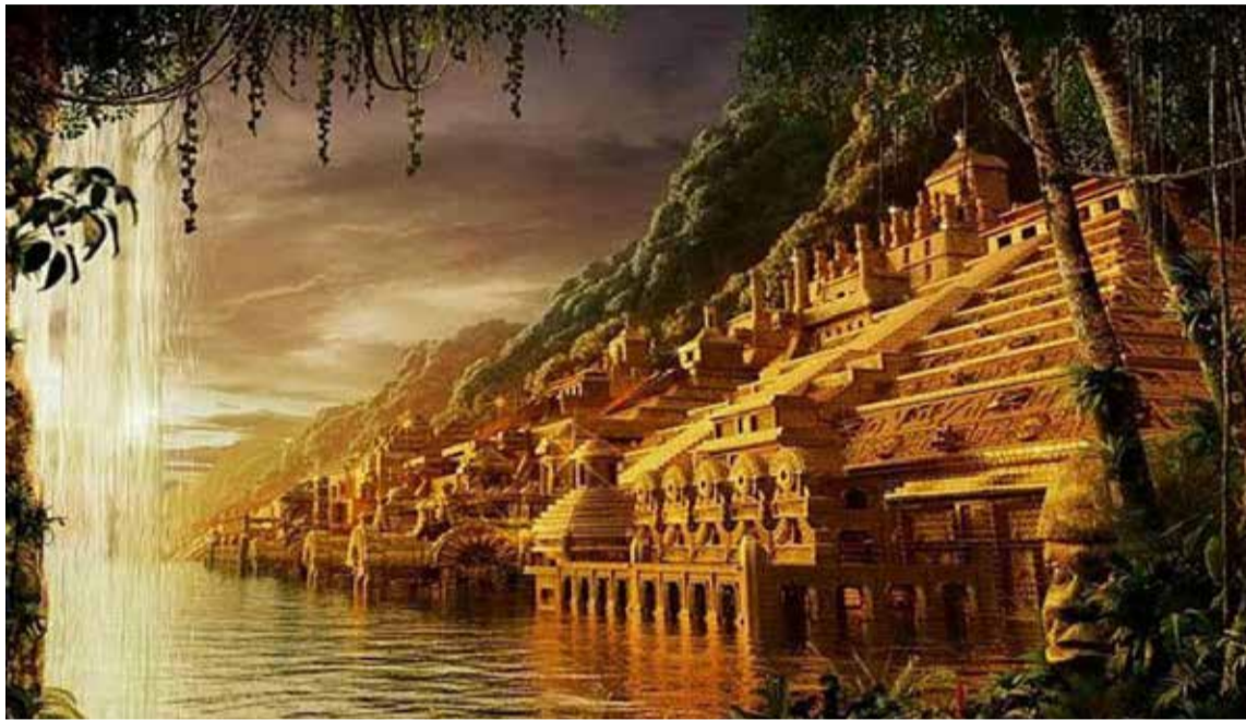
Los conquistadores españoles soñaban con encontrar un pueblo hecho en oro.

El término «El Dorado», en general, se aplicó a casi todas las creaciones