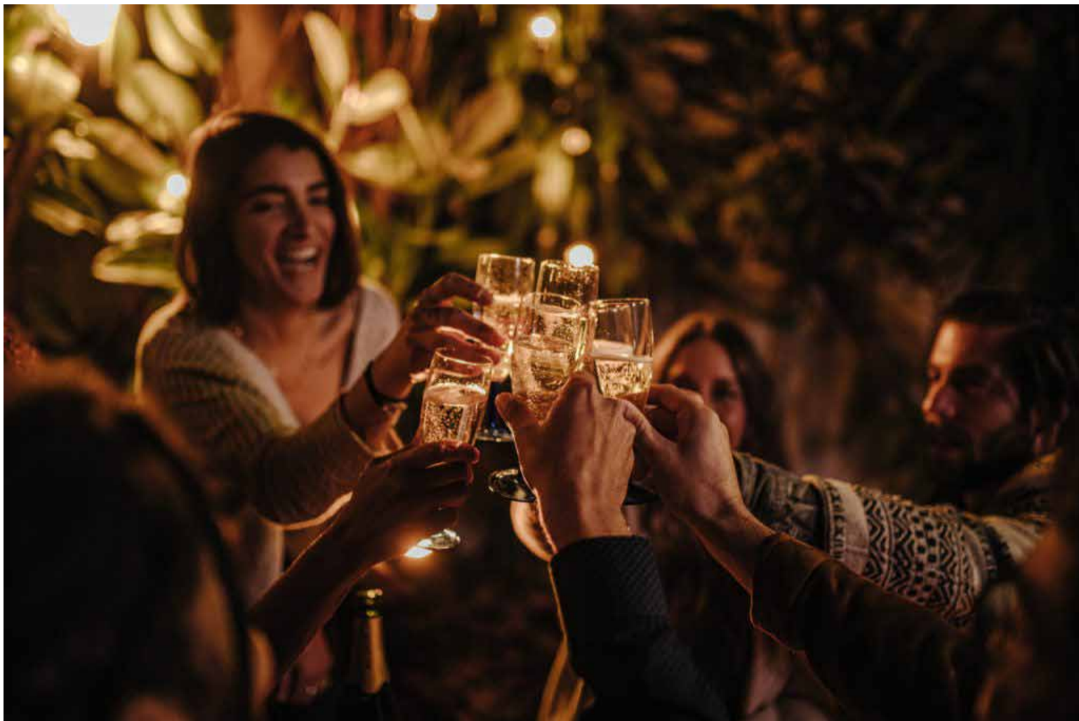
La Universidad de Navarra, busca voluntarios para investigar los efectos del alcohol en la población.

Asimismo, presenta que «el alcohol es un problema por su elevado consumo y sus efectos sobre la salud. Ya desde 2016 se sitúa como el primer factor de riesgo entre las personas de 15 y 49