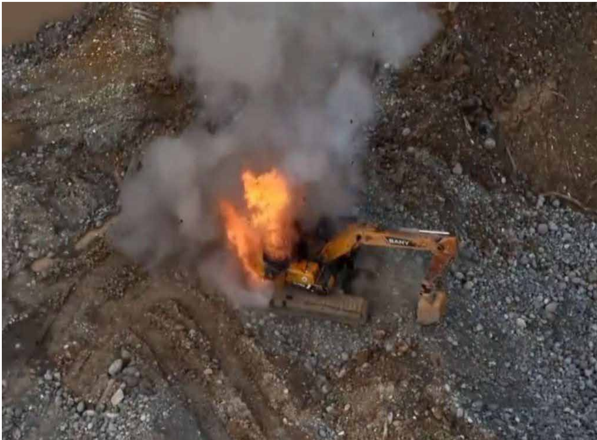
Maquinaria en la minería ilegal destruida por la fuerza pública.

P or instrucciones del presidente de la República, Gustavo Petro Urrego, y del Ministro del Interior (e) Gustavo García, el Gobierno nacional lideró un Consejo Extraordinario de Seguridad Ampliado en Chocó, que definió las acciones para garantizar los derechos fundamentales de los habitantes y contrarrestar el accionar de los grupos armados ilegales en esta zona del país.