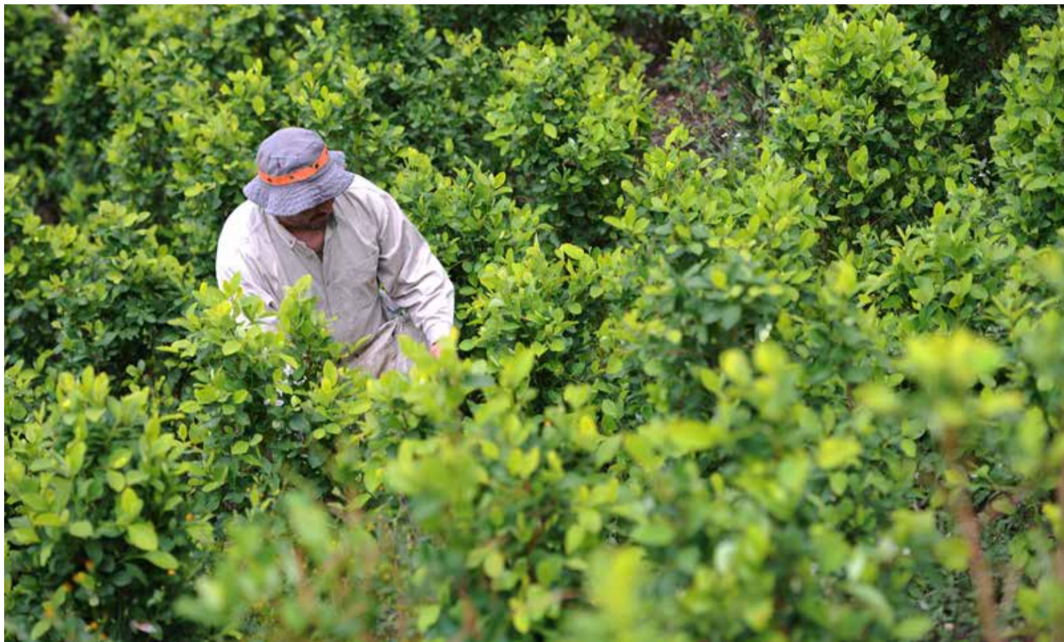
Cultivos de coca

Cauca. Lenguaje como la gobernanza del proyecto, los costos operativos y la administración de los recursos financieros, hace parte de las acciones a seguir en los próximos meses. «La investigación del proyecto de industrialización de los cultivos ilícitos, ascenderá a 700 millones de dólares».