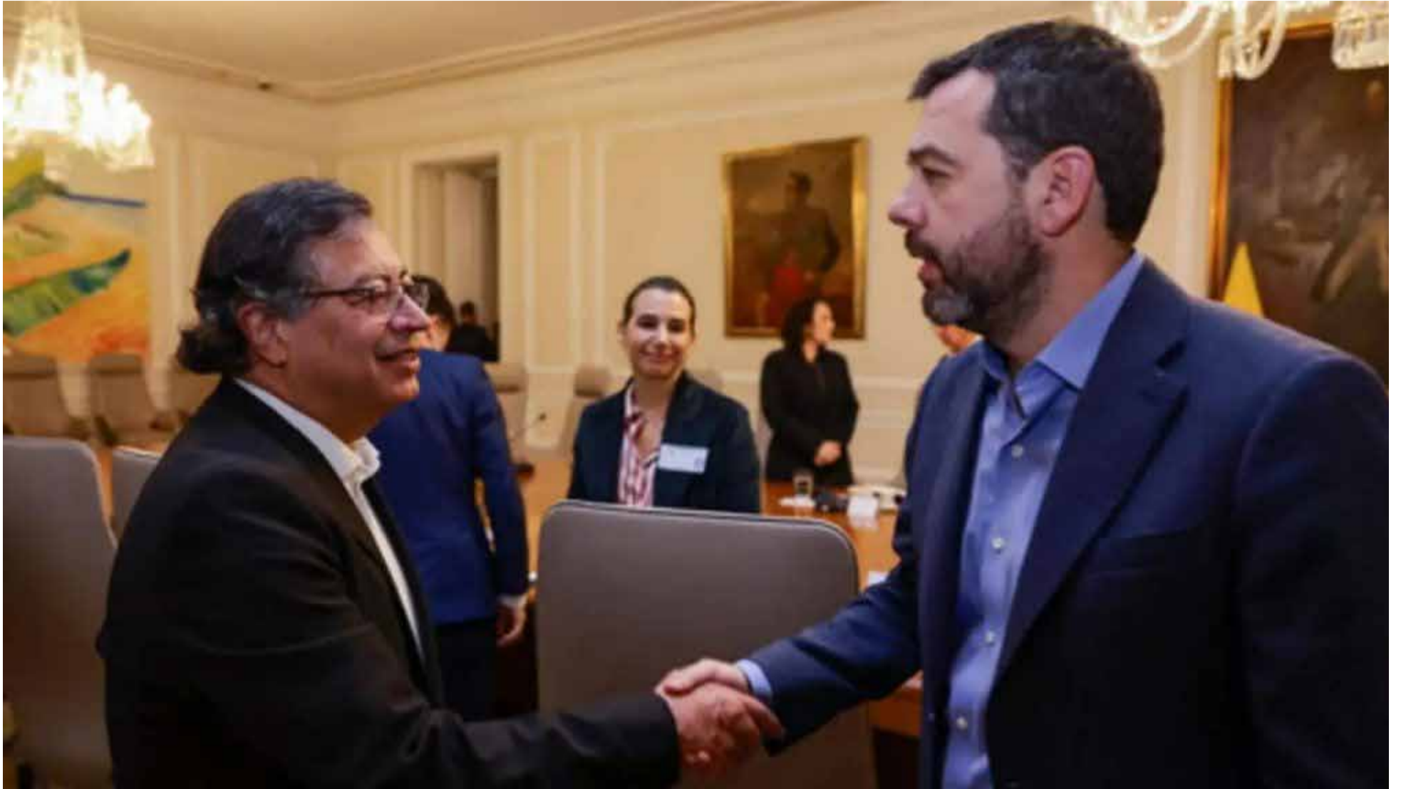
El presidente Petro y el alcalde Galán enfrentados por elecciones 2026

Sabana de Bogotá es un tema que aborda aspectos legales, ambientales y de desarrollo urbano.