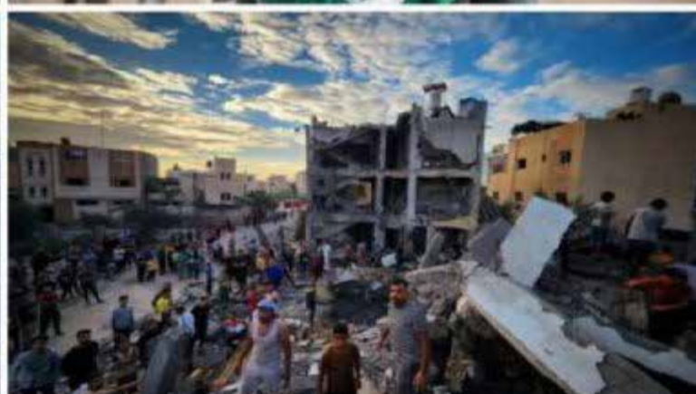
Guerra en Palestina

po hicieron soñar que un organismo como las Naciones Unidas sería el sitio más indicado para dirimir cualquier conflicto y minimizar una escalada mundial como la que se vivió y cómo se está viviendo ahora.