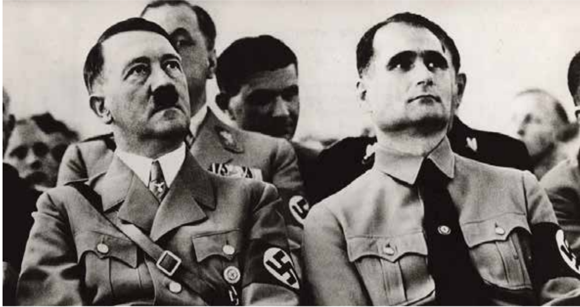
Adolf Hitler and Rudolf Hess in Munich, 1936

Hess había nacido en 1894 en Alejandría (Egipto). Se enroló en el ejército dentro del grupo de infantería para combatir como soldado en la primera guerra mundial. Años después, el partido nazi lo engatusaría con las ideas —entonces revolucionarias— que pregonaba en Alemania; lo atraparía como un águila que coge, por las garras, a su presa. En Múnich —hermosa ciudad alemana— participó en una revuelta que buscaba propinar un golpe de estado, pero el motín, por falta de apoyo, se convirtió en fracaso. Terminó en la cárcel acompañado de sus revoltosos amigos nazis. Y aquí, en este recinto de puertas metálicas, tuvo la sorpresa de su vida: en la misma cárcel se encontraba Adolfo Hitler. Durante el tiempo de encierro, ayudó al líder del Partido Nacional Socialista Obrero Alemán (NSDAP) a escribir algunas