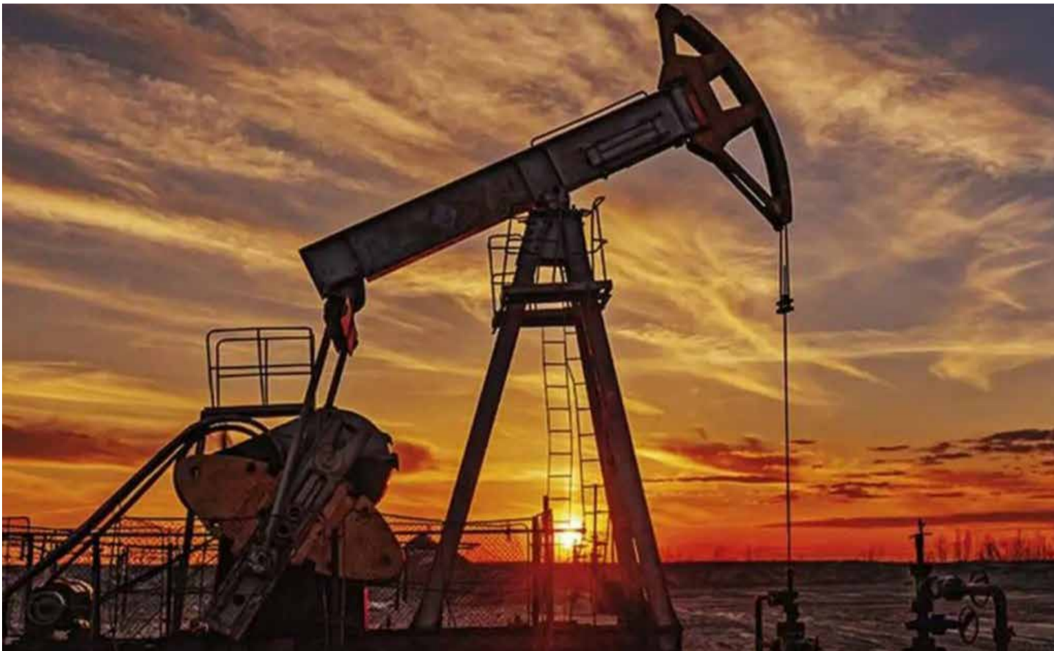
Ecopetrol se equivocó en la negociación con Repsol sobre el pozo CPO9 en Guamal, Meta.

¿Pero cómo disimularan la platica que Ecopetrol dejó de ganarse? Con Que el accionista mayoritario no rebuzne no se tapa el mal negocio.