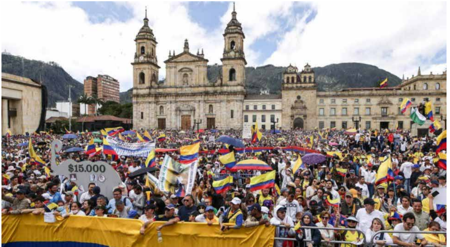
Las centrales obreras hicieron un llamado a los trabajadores para reclamar los derechos negados por la oposición de derecha.

Petro ha declarado el 18 de marzo como día cívico, permitiendo a los