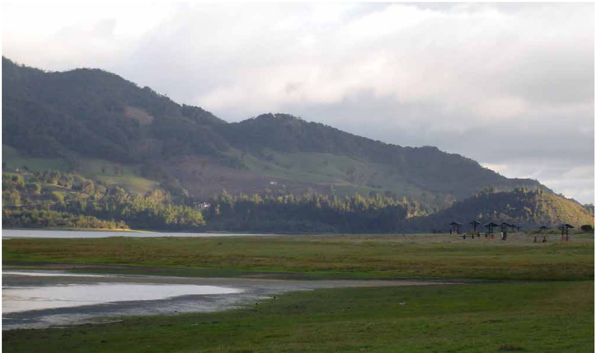
Sabana de Bogotá en las inmediaciones del embalse del Neusa.