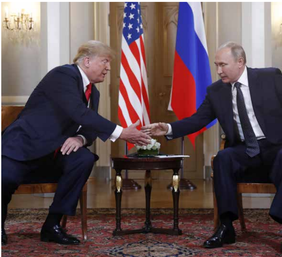
Una vieja amistad une a Trump y Putin.

El presidente ucraniano, Vladímir Zelenski, ha acusado a Rusia de intensificar los ataques, afirmando que en la últi-