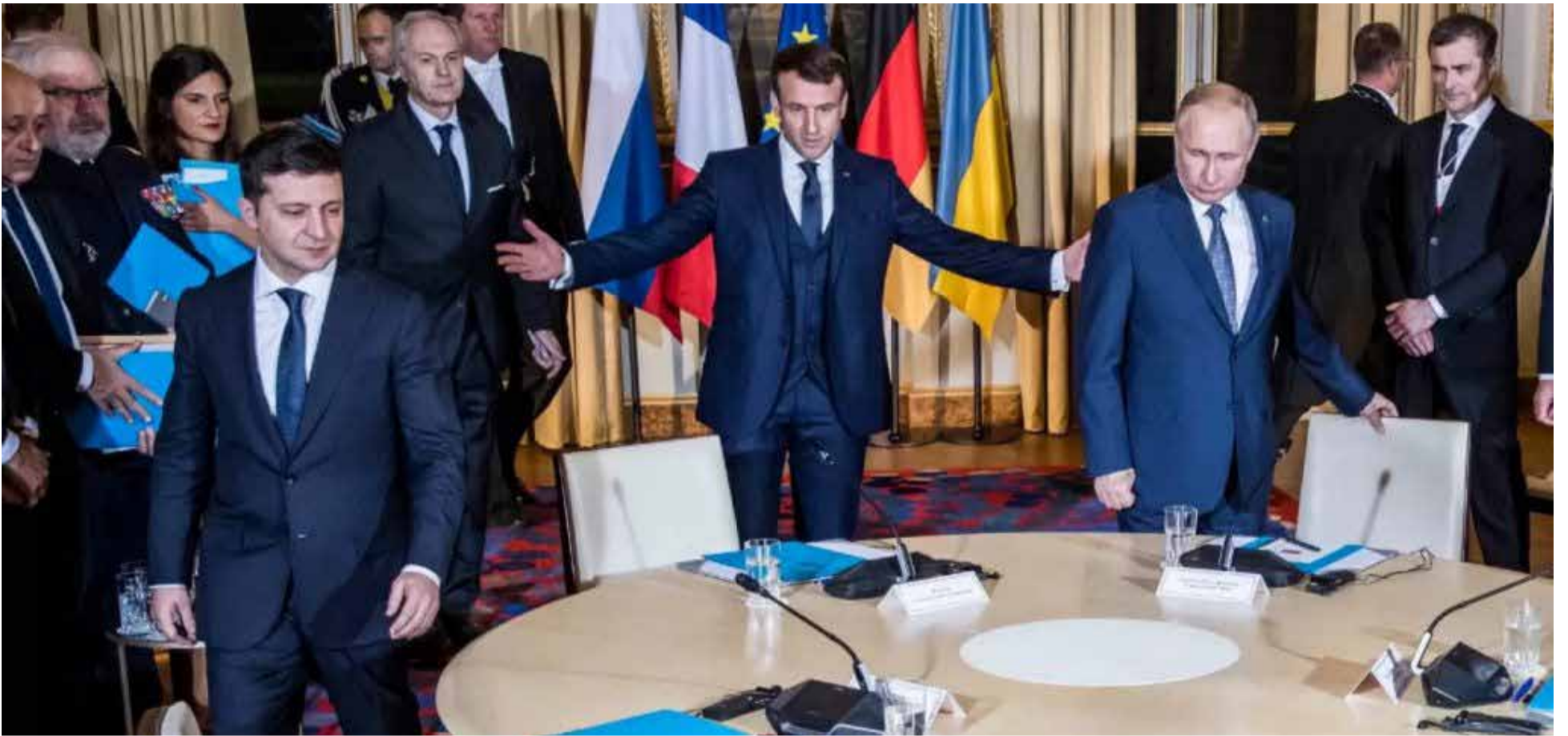
El único encuentro entre Putin y Zelenski, sus rostros indican la enemistad.

La guerra entre Ucrania y Rusia continúa sin una resolución definitiva. Recientemente, Estados Unidos propuso un alto el fuego de 30 días, aceptado por Ucrania, mientras que Rusia aún no ha dado una respuesta oficial.