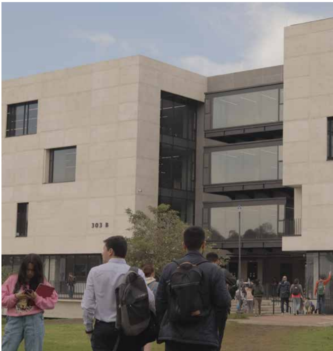
Universidad Nacional la número uno en Colombia.

La burocracia y la politización del sistema educativo son problemas persistentes en la educación pública y ahora en la privada. El manejo de los recursos destinados a la educación superior no siempre es transparente ni eficiente, lo que provoca una distribución inequitativa de los fondos. En muchas ocasiones, las decisiones sobre el sistema educativo son influenciadas por intereses políticos o económicos de algunos directivos, lo que impide una mejora real y sostenida de la calidad de la educación. Las falencias de la educación superior en Colombia son multifacéticas e incluyen problemas de acceso, calidad, adecuación a las necesidades del mercado laboral y manejo de recursos. Superar estos desafíos requiere un enfoque integral que contemple reformas estructurales, mayores inversiones en el sector educativo y una mejora en la relación entre las universidades y el entorno socioeconómico del país. Solo de esta