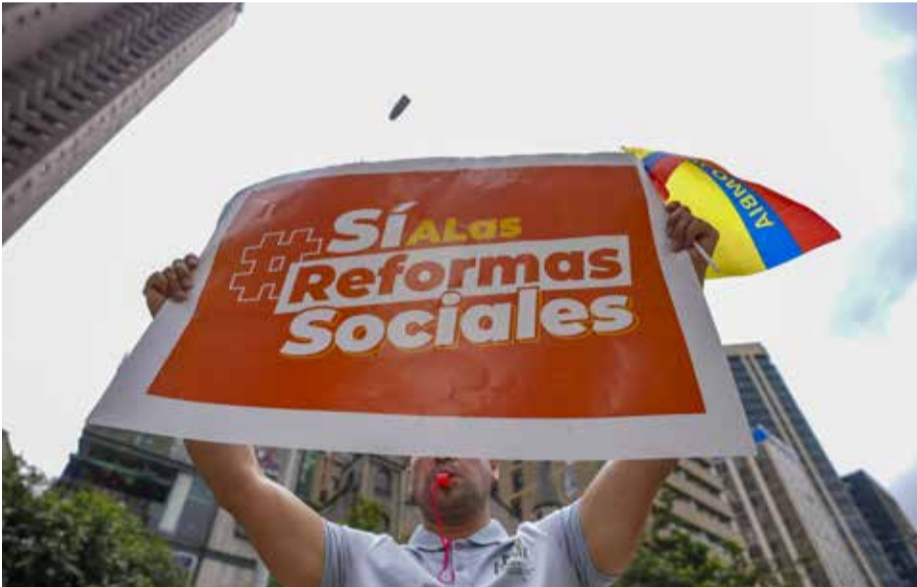
Apoyo a las reformas sociales