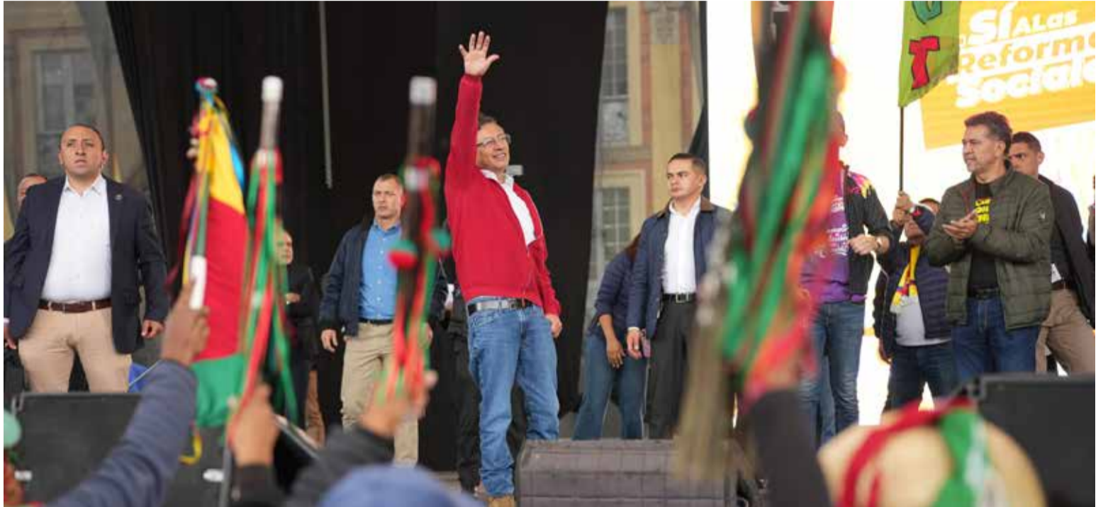
Petro liderando un pueblo

«La marcha del pueblo es histórica, no es una marcha más. Hasta en los rincones más recónditos, el pueblo salió. Se demuestra la enorme sensibilidad que se despertó en toda la población como reacción al impropio que han cometido los 8 senadores de la comisión séptima en contra del pueblo de Colombia. Es una ruptura abierta contra la constitución, motivada exclusivamente y abiertamente por la codicia»: Gustavo Petro Urrego, presidente de los colombianos.