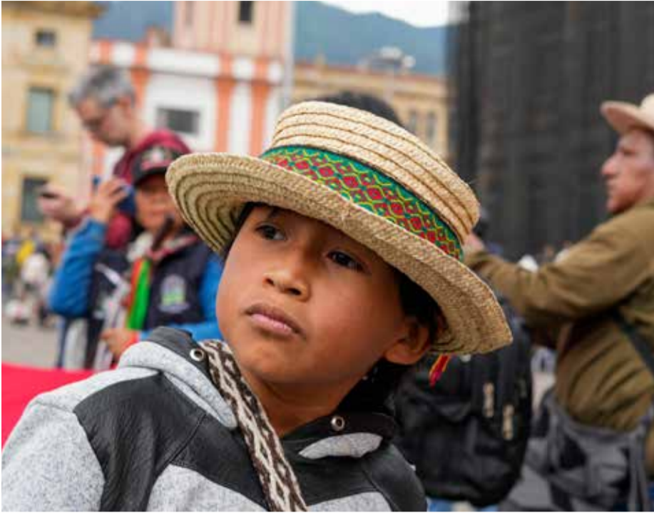
El futuro de Colombia