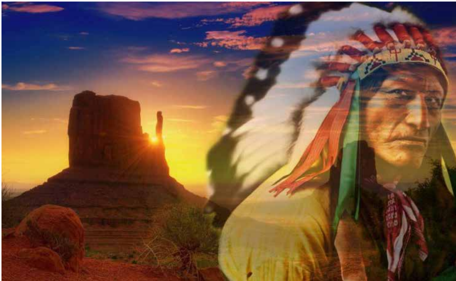
Indígenas norteamericanos fueron diezmados

Aquí intervino la Corona Española para proteger a los indios en su derecho de posesión inalienable. Se les dio condición de nación y fueron proscritos los embargos de la tierra y los bienes o venta a los colonos y se frenó