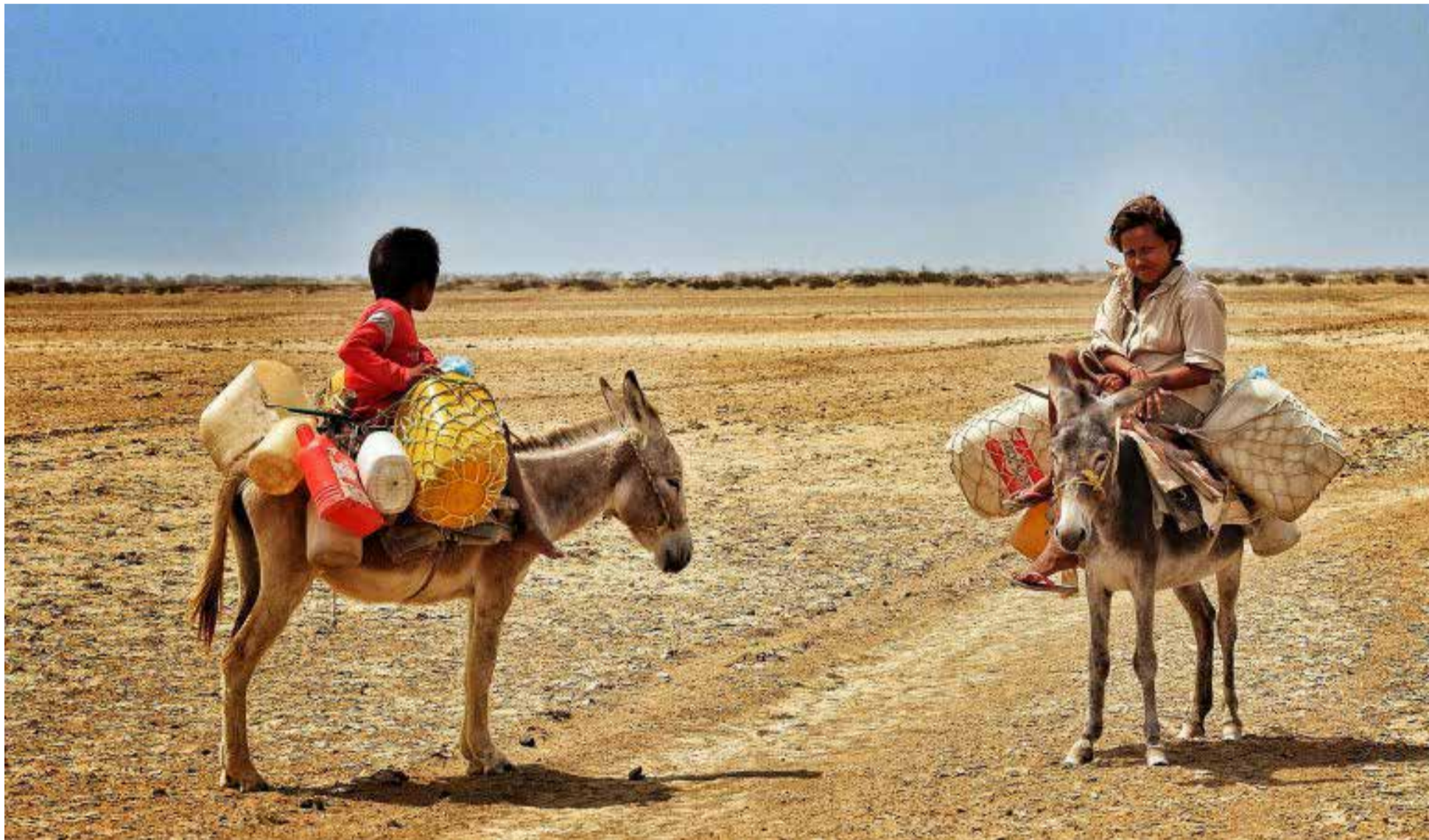
La Guajira en plena sequía