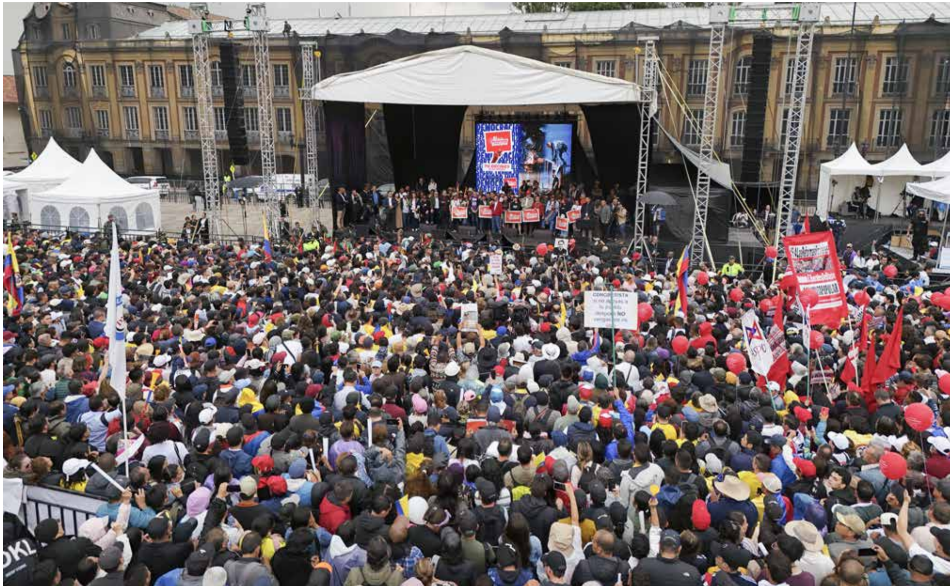
Petro anunciando que la consulta pop

«Así que quedan convocados: arranca la consulta popular, la movilización es permanente y creciente». Con estas palabras, el presidente Gustavo Petro se dirigió a una multitud reunida en la Plaza de Bolívar de Bogotá, donde miles de colombianos participaron en una manifestación en apoyo a las reformas sociales promovidas por el Gobierno del Cambio.