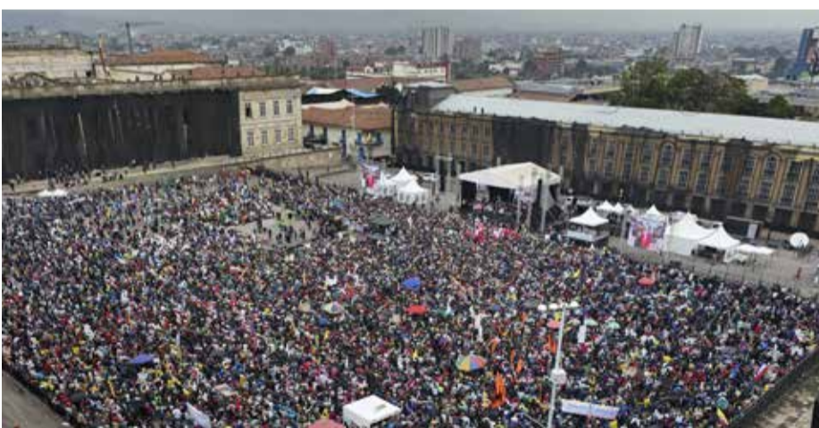
El poder de un pueblo