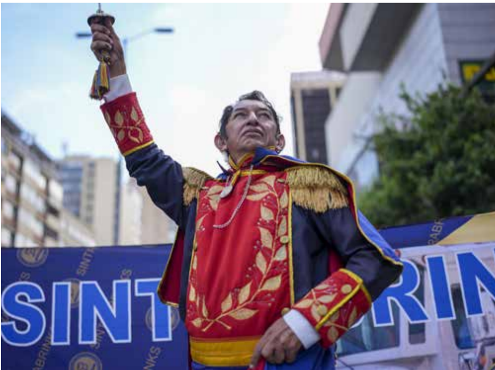
«Simón Bolívar» salió a respaldar la consulta popular.