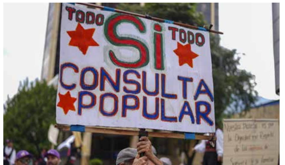
Respaldo a la consulta popular