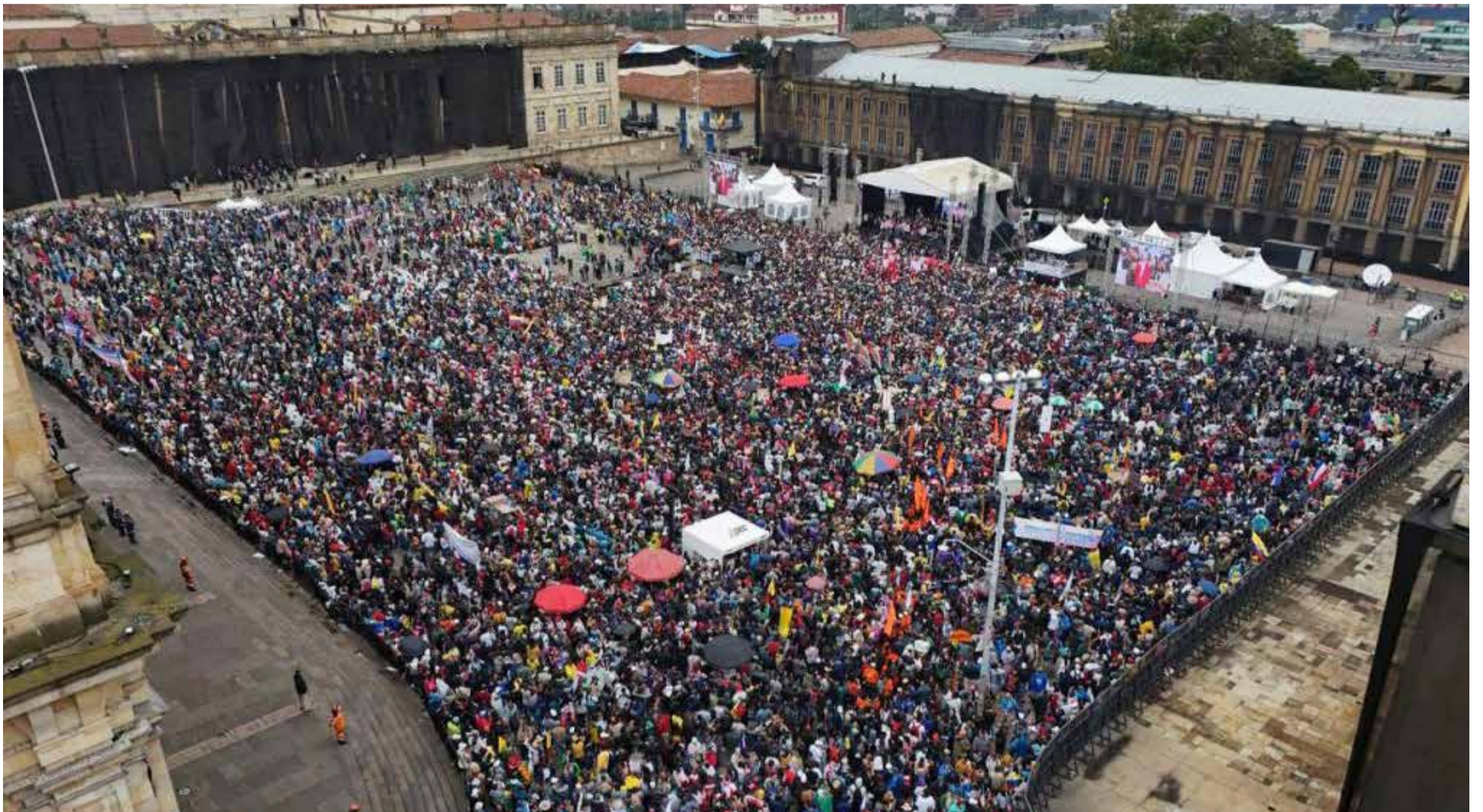
La plaza de Bolívar registró un lleno y cerca de 12 cuadras alrededor para apoyar la Consulta Popular.