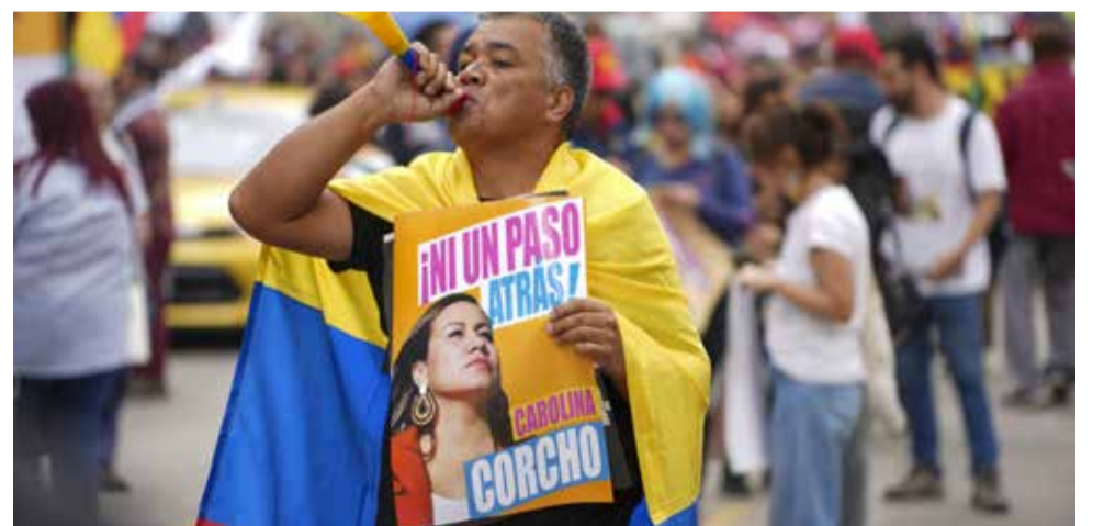
Lanzamiento de una candidata