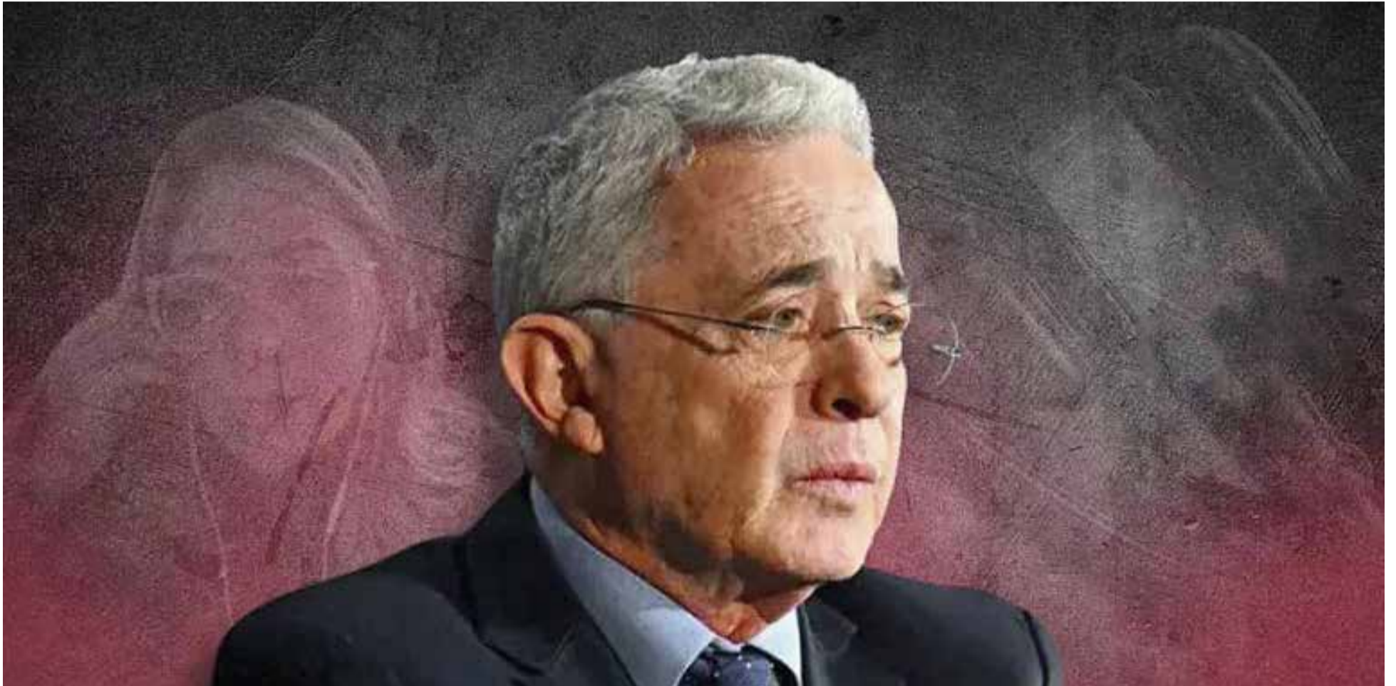
Álvaro Uribe Vélez, el acusado