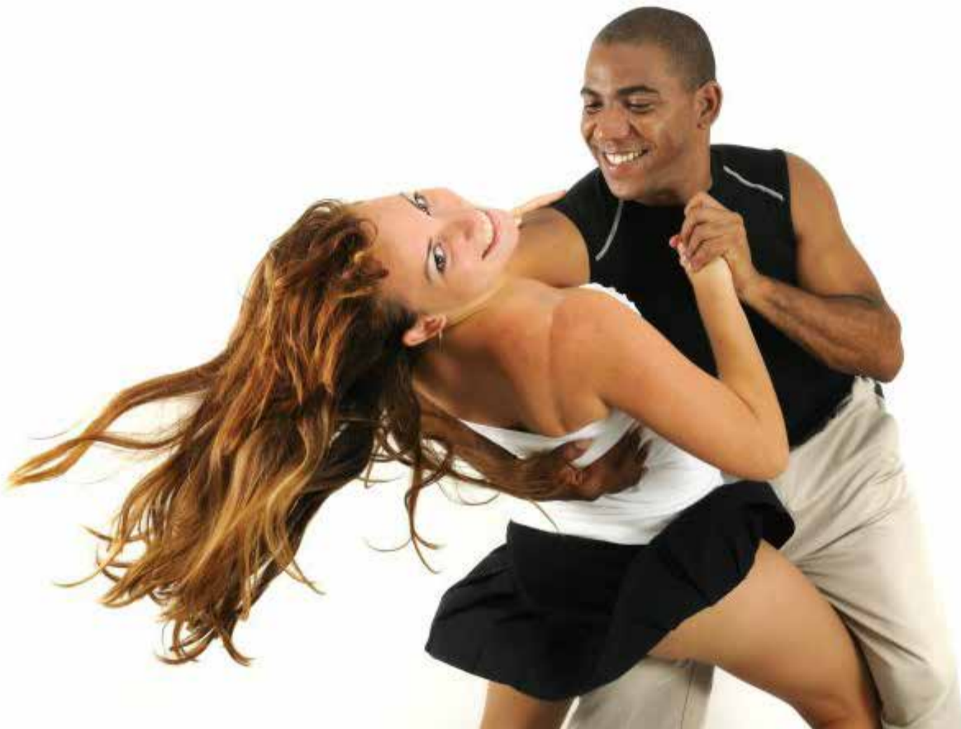
La salsa una forma de gozar la vida.

Con la literatura y la salsa se articulan dos expresiones artísticas que bien pueden hacer de su integración una herramienta para fomentar la cultura de las letras y la música. «Leer la salsa y bailar la literatura» es una propuesta cuyo propósito será llevar a todo el país encuentros entre los exponentes de estas dos expresiones artísticas.