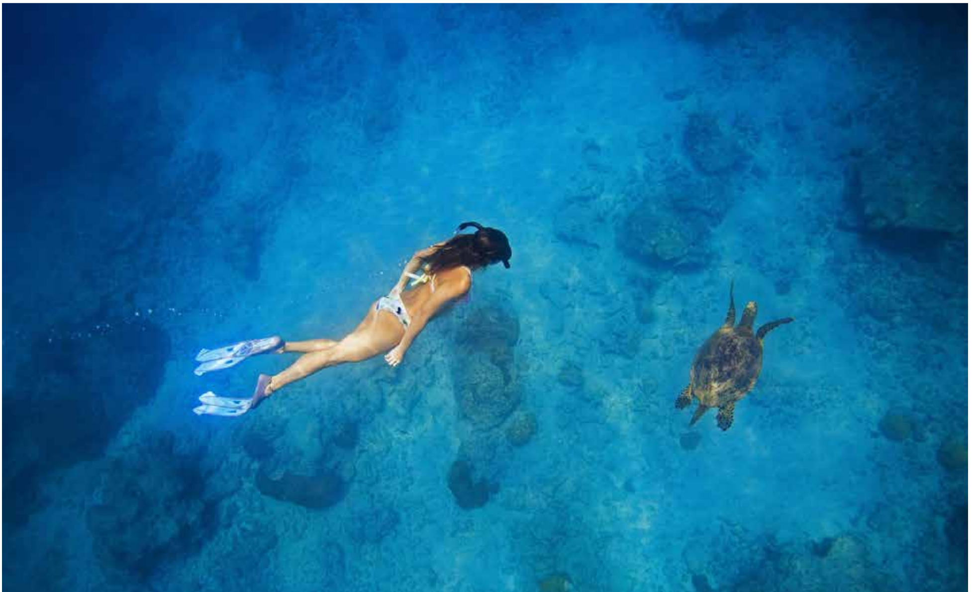
La universidad de la vida, de la pura vida