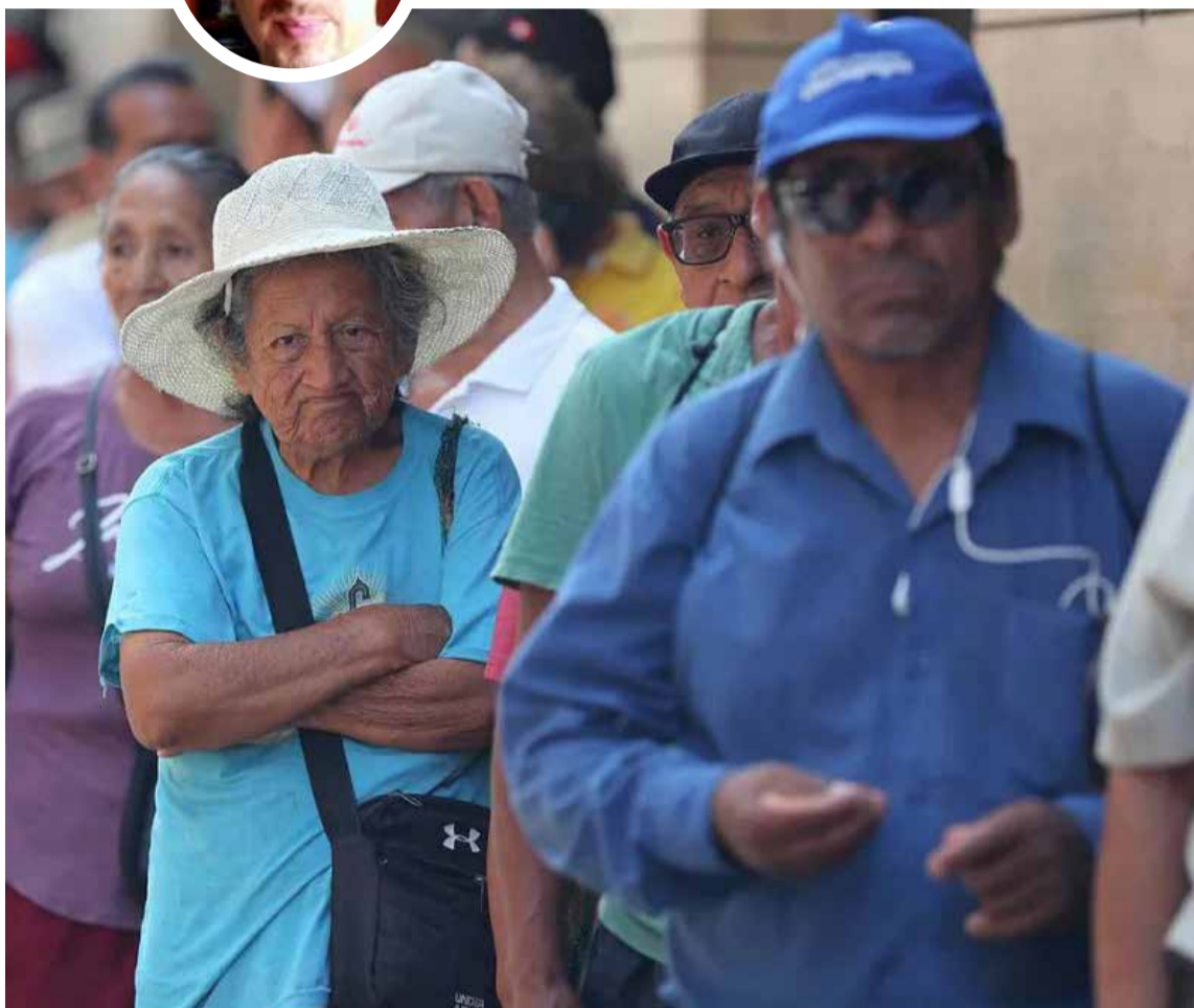
Pensionarse parece ser una utopía o ilusión efímera que solo es comparable con el realismo mágico de García Márquez.

pensión y jubilación, que decretó el gobierno de Javier Milei.