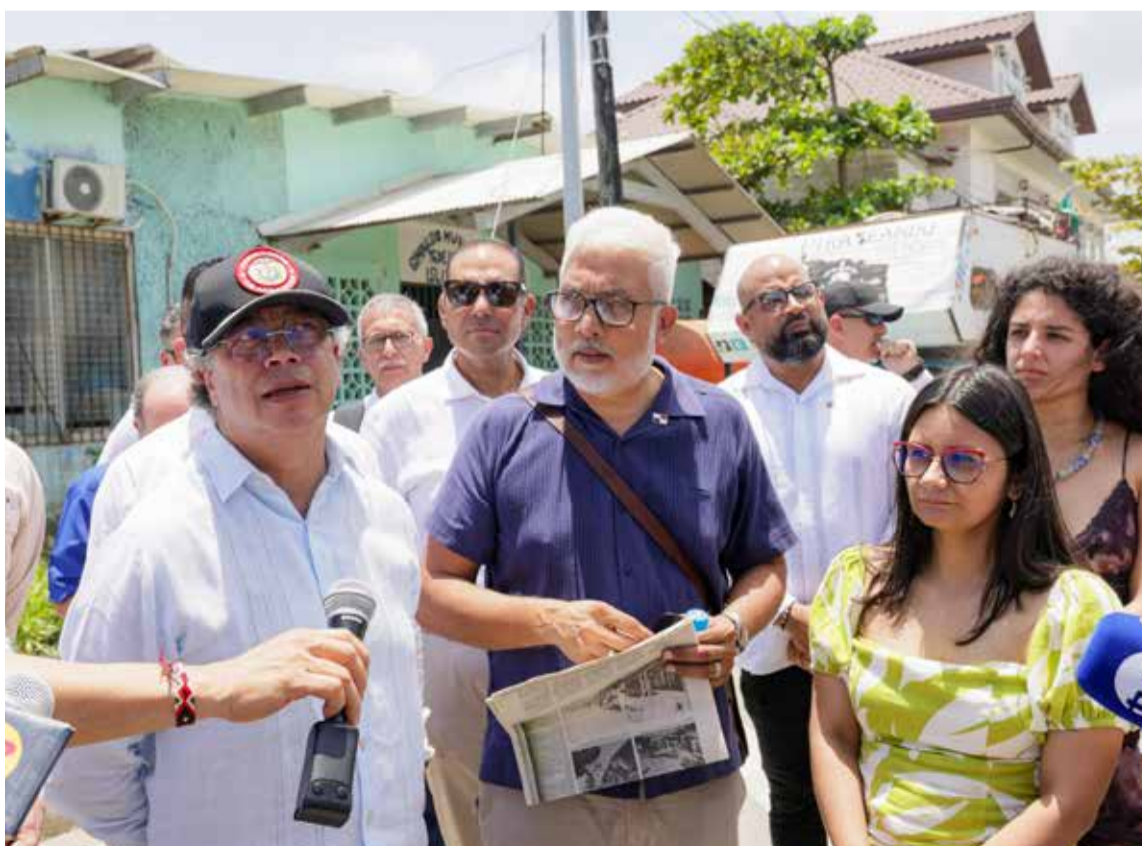
Recorrido por los hechos históricos del ataque del 8 de marzo de 1895

En el marco de la Visita Oficial, José Raúl Mulino Quintero, Presidente de la República de Panamá, recibió en el Palacio de las Garzas, a Gustavo Petro Urrego, Presidente de la República de Colombia. Los mandatarios reafirmaron el compromiso de ambos Estados por seguir fortaleciendo los lazos históricos que los unen y sostuvieron un productivo diálogo en el cual revisaron los diferentes temas de la agenda bilateral, regional y global, destacando el alto nivel de entendimiento e interés recíproco en profundizar los tradicionales lazos de amistad y coo-