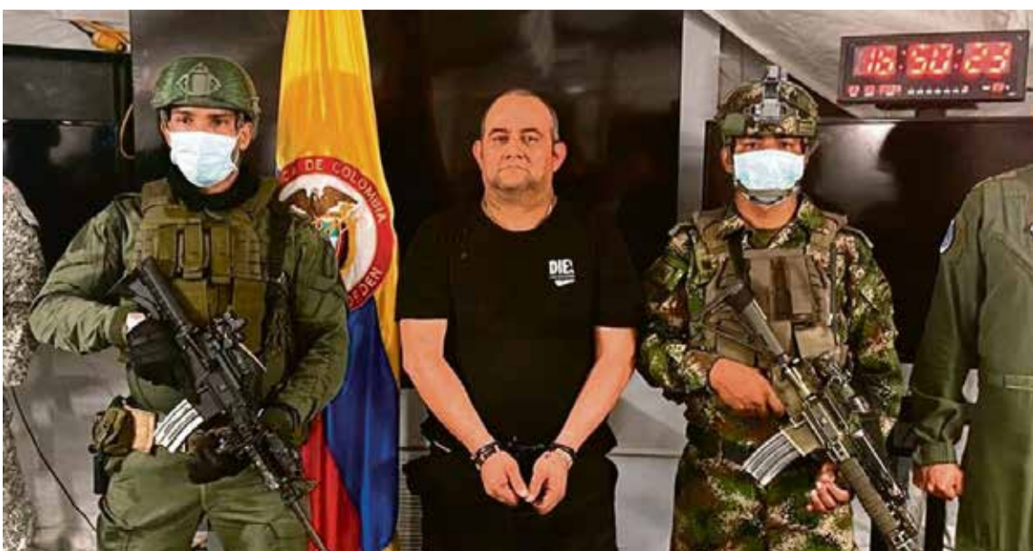
Dairo Antonio Úsuga, alias «Otoniel»: Líder del Clan del Golfo

5. Dairo Antonio Úsuga, alias «Otoniel»: Líder del Clan del Golfo, una de las organizaciones criminales más poderosas en Colombia en la actualidad. Fue capturado en 2021 y es conocido por su implicación en el narcotráfico y otros delitos.