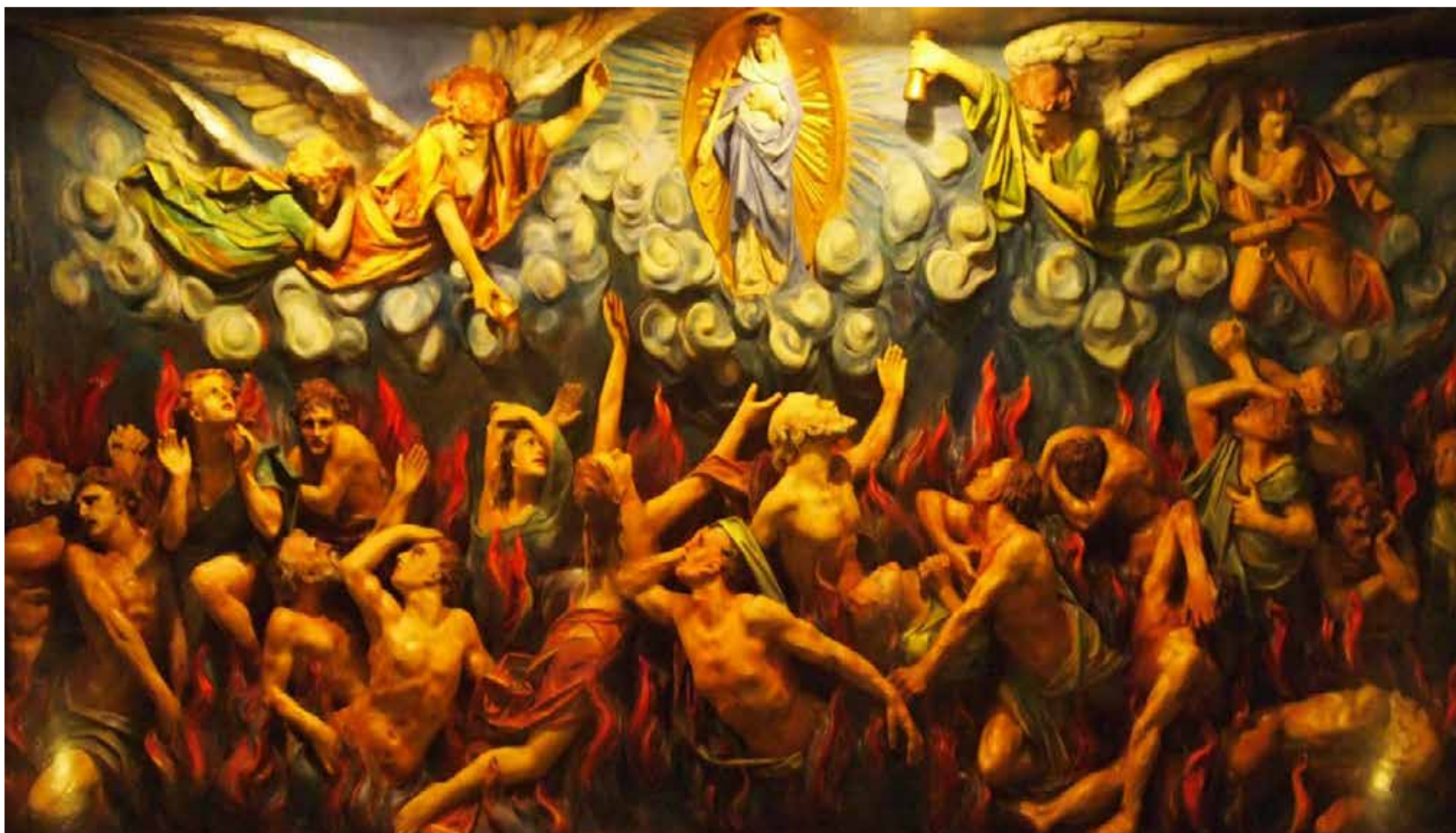
Colombia en el purgatorio

L orenzo en un laberinto, víctima de sus errores. Colombia, sin fútbol, en el purgatorio. Y los futbolistas, sin despeinarse. Sin responsabilidad. Con tolerancia a su bajo rendimiento.