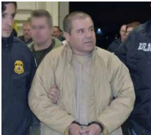
Joaquín Guzmán «El Chapo» Loera