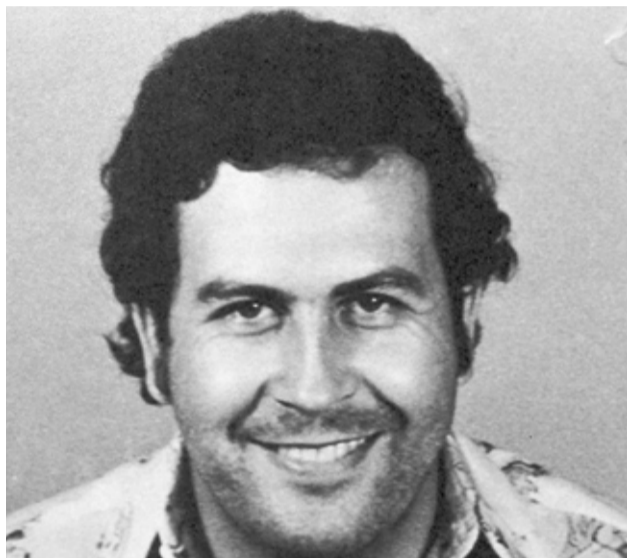
Pablo Escobar: Fundador del Cartel de Medellín