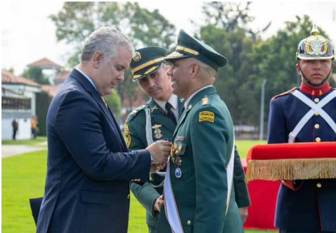
El general Eduardo Enrique Zapateiro Altamiranda, recibió las más altas condecoraciones en el gobierno del presidente Iván Duque.

El periodista Daniel Coronell en su columna del