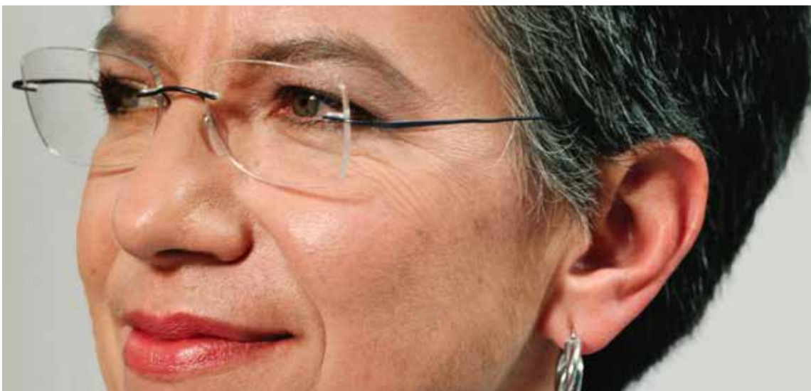
Claudia López, precandidata presidencial

2. Álvaro Uribe Vélez: Ex-presidente y líder del partido Centro Democrático, ha tenido una influencia considerable en la política colombiana durante más de una década, siendo un referente para muchos en el sector conservador.