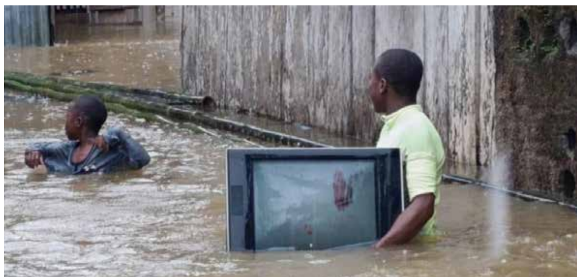
Los chocoanos con el agua al cuello.

se encuentra en la fase de estudios y diseños participativos. Se espera que en un plazo de cinco meses se presente un anteproyecto tanto a la UNGRD como a la comunidad de Bojayá. Este esfuerzo cuenta con un terreno proporcionado por la comunidad y un presupuesto proyectado de 17 mil millones de pesos para los estudios y 50 mil millones de pesos para la construcción y el urbanismo. De acuerdo con