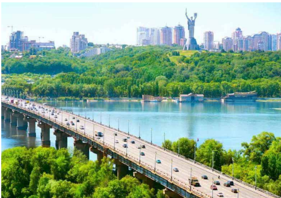
El puente del Patón

dos veces. Invadieron a Ucrania vengativos y ansiosos, para alcanzar las dichosas aguas que la naturaleza les ha negado. Ya tienen un área marítima –ilegal– considerable. Por ahora se quejan poco, lloran menos, se irritan dos veces, en vez de diez. Sin embargo, la sed de acaparar lo foráneo sigue en pie, como una indestructible torre de cemento.