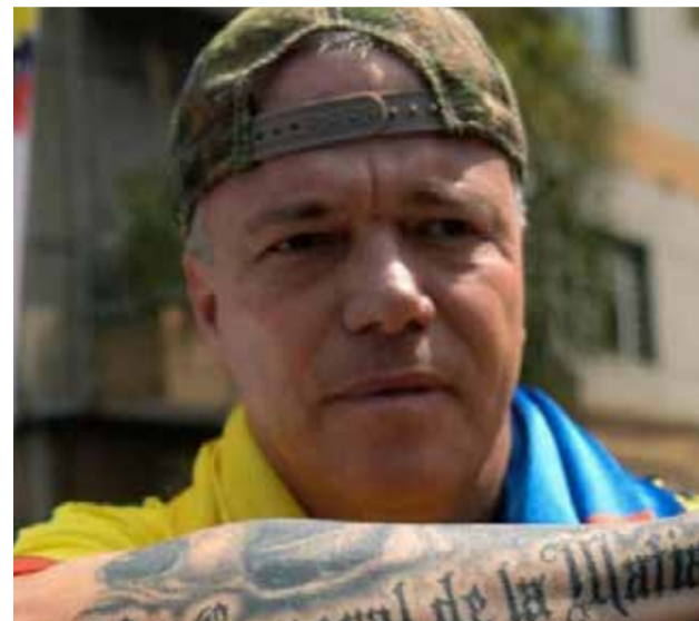
Jhon Jairo Velásquez: Conocido como «Popeye»

Colombia ha enfrentado una historia compleja de violencia y crimen organizado, y varios individuos han sido notorios por su papel en actividades criminales. Aquí te menciono a cinco de los criminales más conocidos en la historia reciente del país: