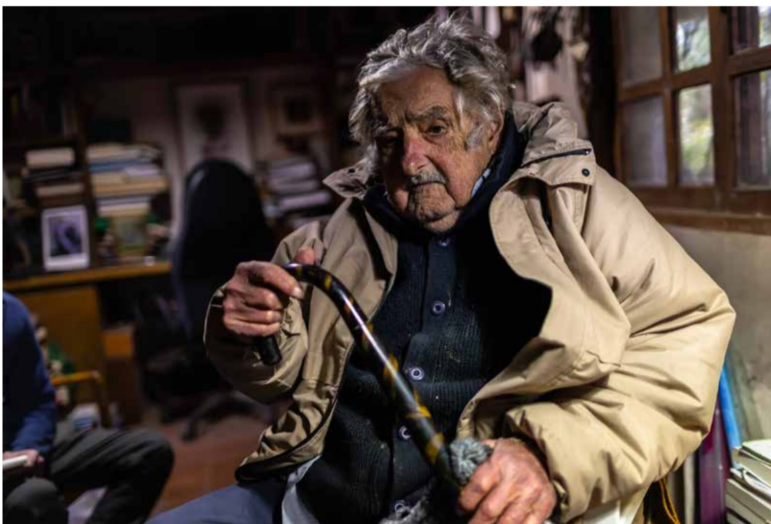
«Estoy peleando con la muerte»

Autodidacta, aprendió los asuntos vitales que afectan a la humanidad, con una vocación innata de servicio público, que