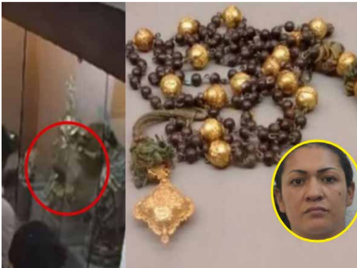
Rosario, que perteneció al Papa Pío XII, posee un valor estimado de 2 millones de dólares (más de 8.000 millones de pesos colombianos).