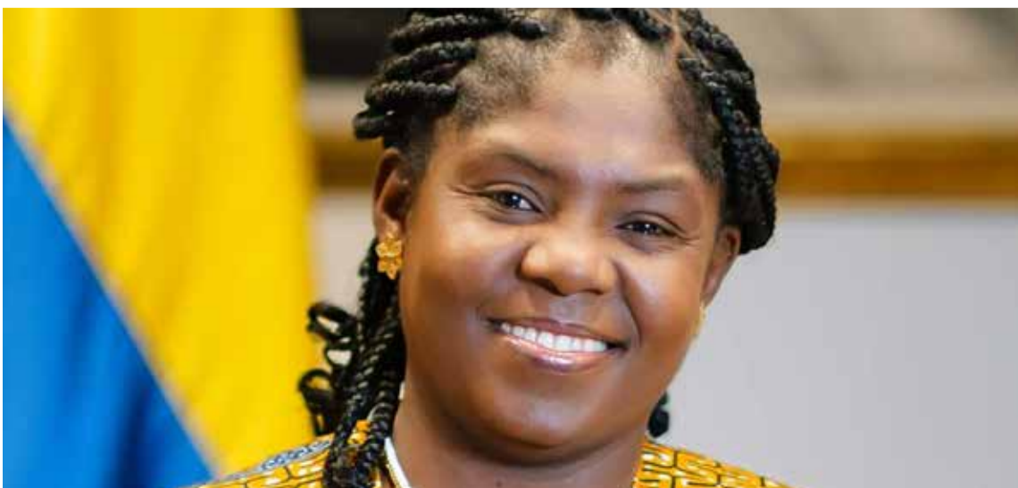
Francia Márquez, Vicepresidenta de Colombia.

4. Claudia López: Actual alcaldesa de Bogotá, ha sido una voz importante en temas de urbanismo, derechos humanos y equidad de género.