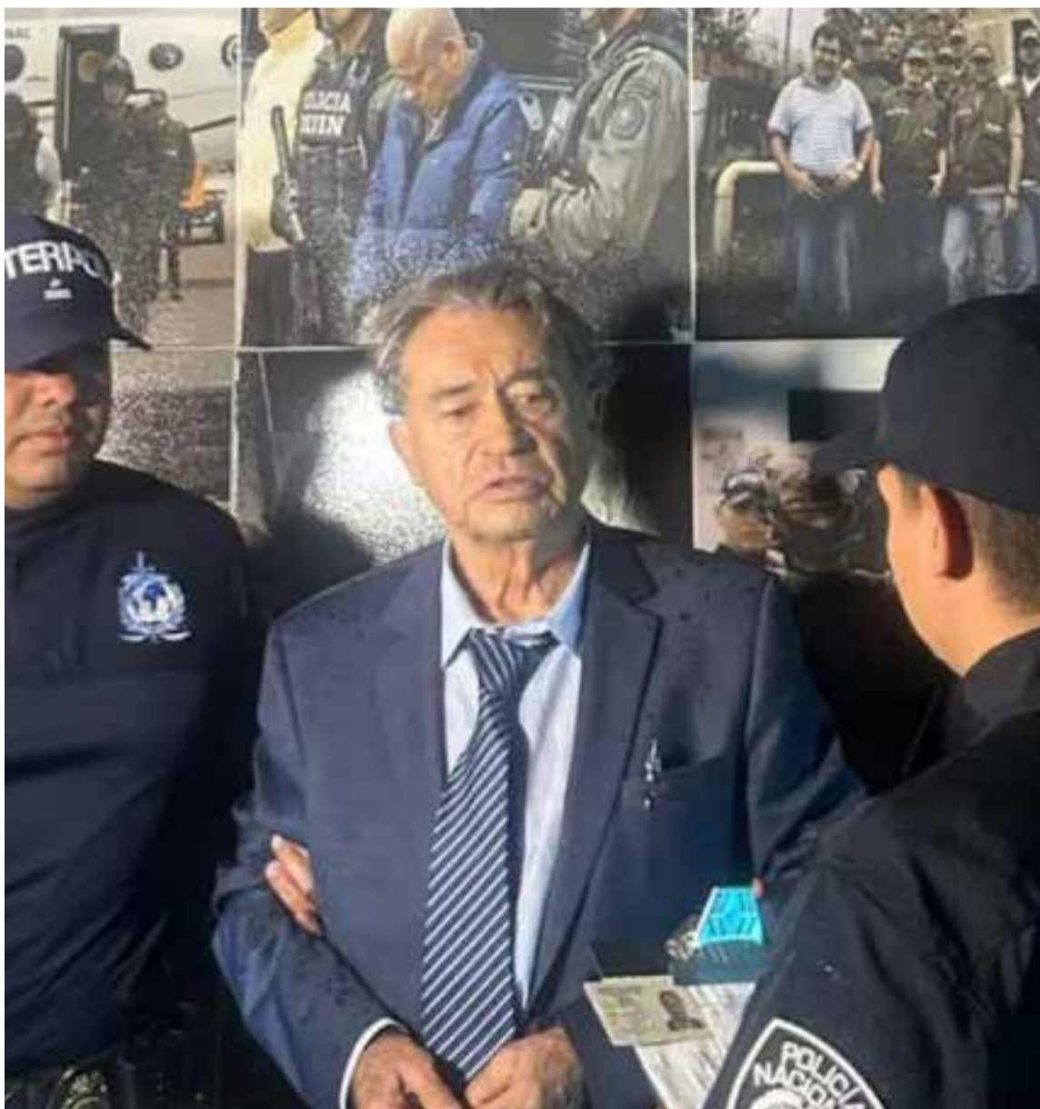
Carlos Lehder, al llegar a Bogotá en el momento de su captura.

Como se recordará, Carlos Lehder fue capturado el 4 de febrero de 1987 en una finca de Guarne (Oriente antioqueño). Se convirtió en el primer gran capo del narcotráfico en ser extraditado hacia Estados Unidos, donde estuvo cumpliendo una pena de 38 años de prisión luego de ser el testigo estrella contra el expresidente de Panamá, general Manuel Noriega, lo cual evitó la cadena perpetua a la que inicialmente fue condenado.