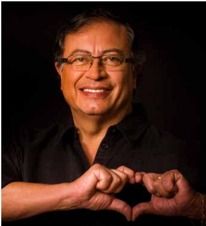
Gustavo Petro Urrego, presidente de Colombia.