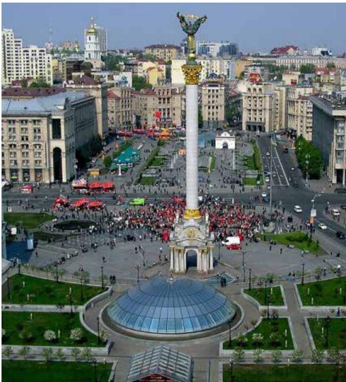
El Monumento a la Independencia

Estas escenas ocurren desde el año 2022. Desde el día en que los rusos invadieron la primera provincia del oriente de Ucrania. Los corajudos rusos se atrevieron a pisar el interior de su vecino, sin ser invitado, sin autorización, rompiendo las fronteras, que deben ser líneas sagradas en las relaciones internacionales. Entraron armados, dispuestos a dar una ba-