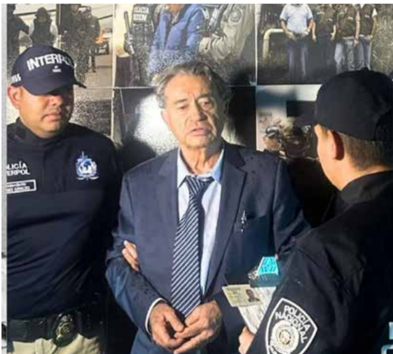
Carlos Lehder: Cofundador del Cartel de Medellín

3. Jhon Jairo Velásquez: Conocido como «Popeye», fue uno de