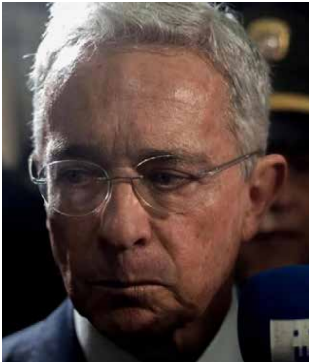
Álvaro Uribe Vélez, expresidente de Colombia.