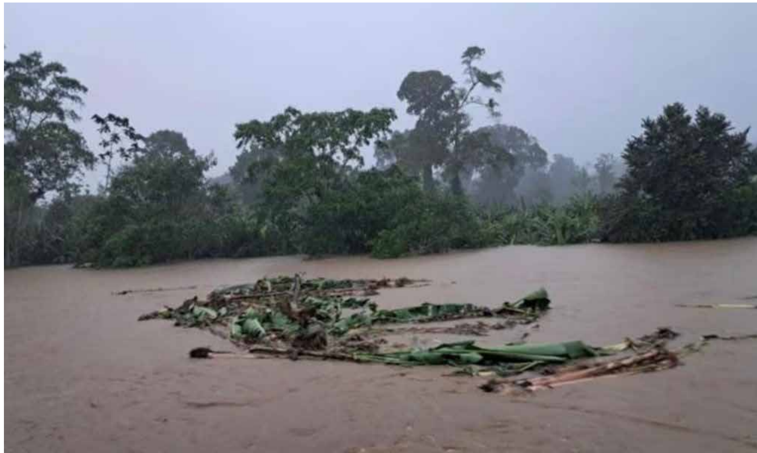
Chocó está inundado

Este proyecto había quedado en suspenso durante la administración anterior y actualmente