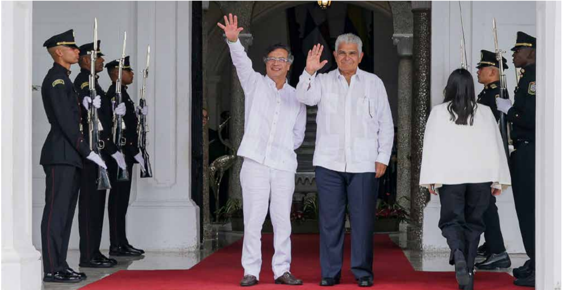
Recibimiento con honores al Presidente de la República de Colombia Gustavo Petro Urrego, por parte de José Raúl Mulino Quintero, Presidente de la República de Panamá.

En el marco de la Visita Oficial, José Raúl Mulino Quintero, Presidente de la República de Panamá, recibió en el Palacio de las Garzas, a Gustavo Petro Urrego, Presidente de la República de Colombia. Los mandatarios reafirmaron el compromiso de ambos Estados por seguir fortaleciendo los lazos históricos que los unen y sostuvieron un productivo diálogo en el cual revisaron los diferentes temas de la agenda bilateral, regional y global, destacando el alto nivel de entendimiento e interés recíproco en profundizar los tradicionales lazos de amistad y coo-