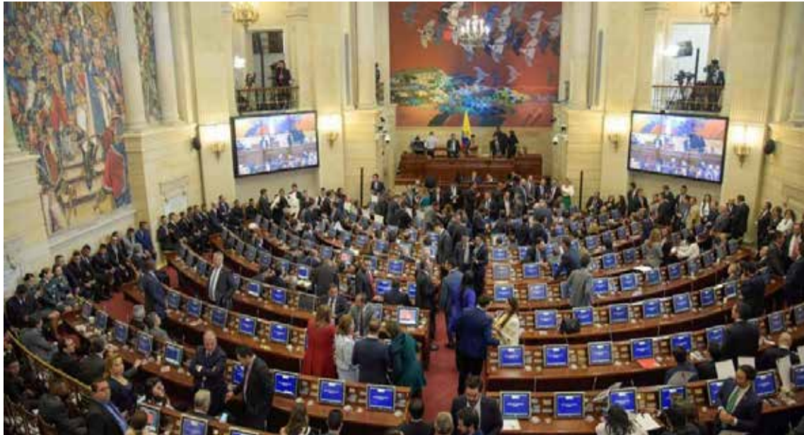
¿Reformas o Consulta?

Las discusiones entre los diferentes entes políti-