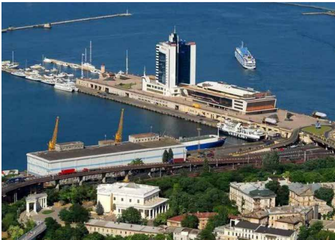
Odesa, puerto marítimo

Esos ríos helados, tiesos por la nieve, no son los más aptos para la navegación, ni para la pesca de peces comestibles, lo que acarrea para los rusos, un fuerte dolor de cabeza. En cambio, el vecino ucraniano tiene las aguas preciaadas que pueden utilizarse para el comercio, para la pesca deportiva, para el turismo europeo y asiático, para contemplar el agua desde un embarcadero. Esos ríos en manos rusas, incluso, pueden ser el centro de los fabulosos deportes –acuáticos– que atraen como hormigas en el campo de la entretención, a los nativos y turistas. Un día de febrero, no lo pensaron