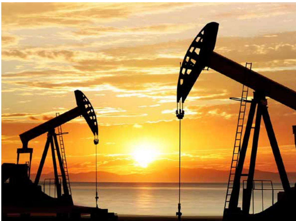
«Nuestros activos siguen creciendo, y la exploración y producción de nuevos campos en Colombia están generando más empleo y oportunidades para la industria nacional»

«Hoy somos seis miembros independientes, con criterios propios y con trayectoria técnica y profesional. Nuestra labor responde a nuestras capacidades y funciones, más que a designaciones gubernamentales», afirmó García Realpe a medios de comunicación.