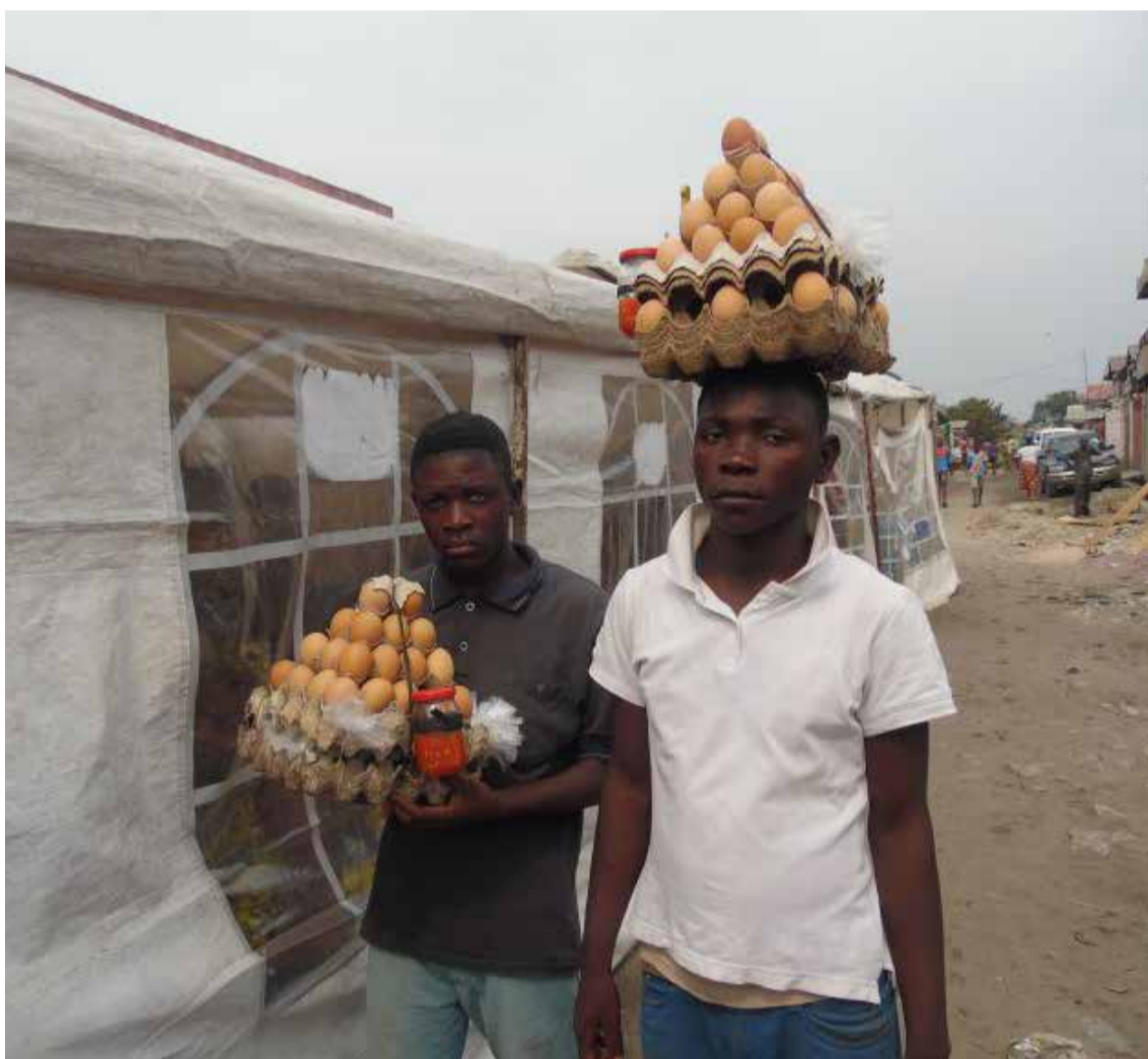
Vendedores de huevos en Congo

Esta es una de las mejores noticias que Fenavi