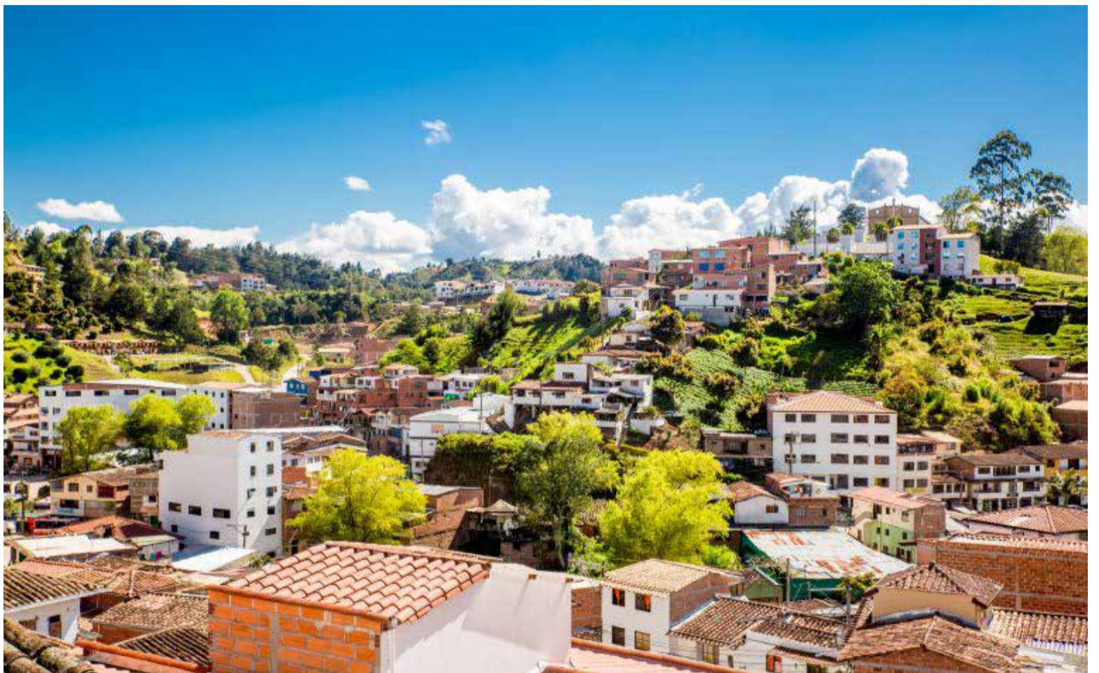
San Vicente de Antioquia

San Vicente Ferrer es un destino para familias pueblerinas, aventureros y amantes de lo natural. La Piedra de El Peñolcito es especial para rapel y escaladas y la Cascada de Los Cachos o Corrientes, un destino que te reconectará con la naturaleza; el Cerro de Morrito y Valle de Corrientes, son dos paradas obligatorias para quienes decidan