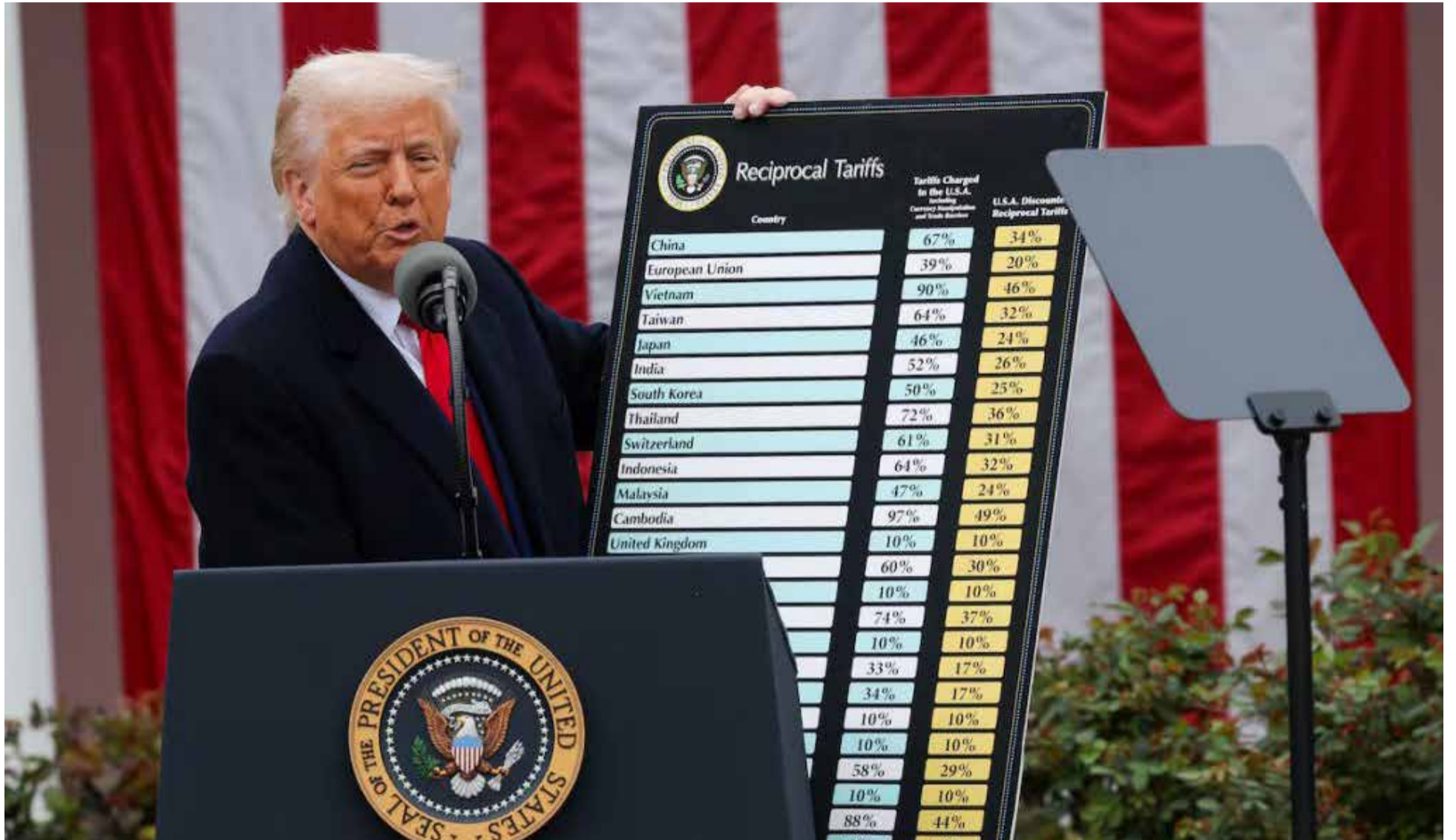
Donald Trump, anunciando la tabla de aranceles que le puso al mundo.

El presidente Gustavo Petro calificó como «un gran error» la decisión del gobierno de Estados Unidos de imponer aranceles a las importaciones de todos los países, incluida Colombia. «El gobierno estadounidense cree ahora, que subiendo aranceles a sus importaciones en general, pueda aumentar su propia producción, riqueza y empleo; en mi opinión, puede ser un gran error», señaló.