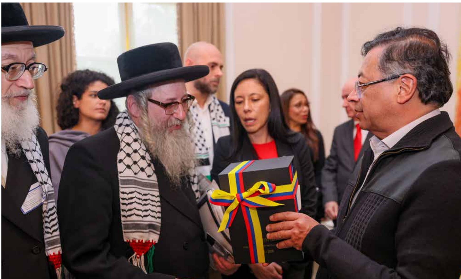
El presidente Petro, hace entrega de la Cruz artesanal de Jerusalén, en reconocimiento a su labor en la promoción cultural en Colombia.