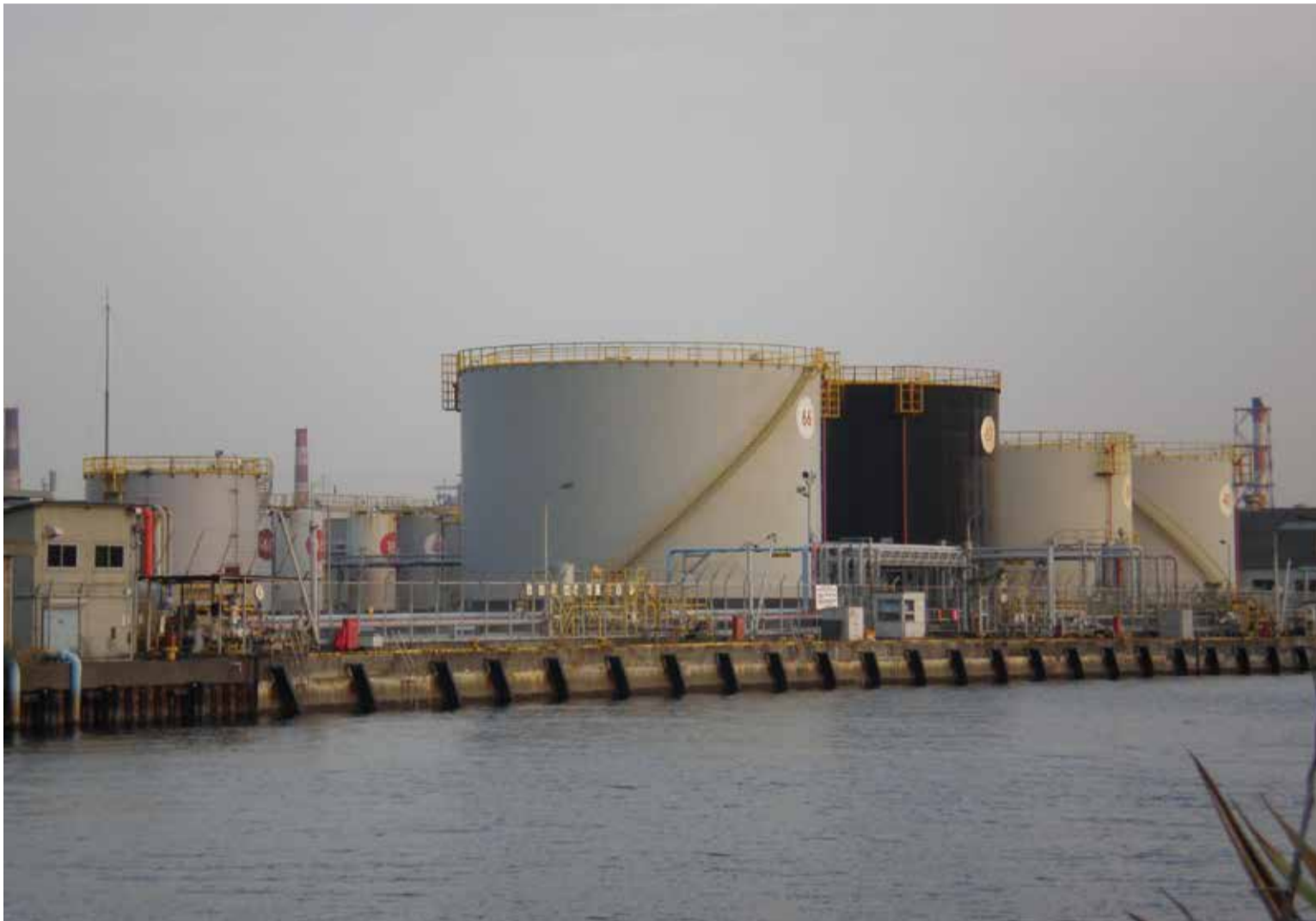
Ecopetrol logró una producción de 746.000 barriles diarios, la cifra más alta en los últimos diez años.