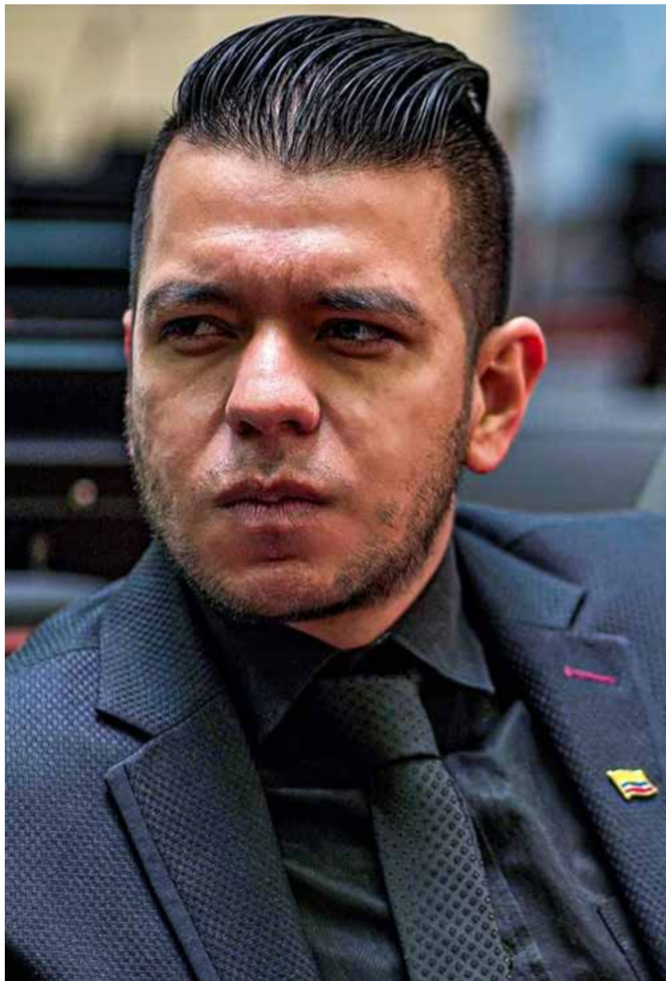
Jonathan Ferney Pulido Hernández conocido como «Jota Pe Hernández», senador de de la República.

E l enfrentamiento entre el embajador Roy Barreras y el senador Jota Pe Hernández ha escalado a denuncias penales y ha generado una controversia en la política colombiana. Ambos dirigentes anuncian que buscarán llevar a la cárcel a su respectivo rival.