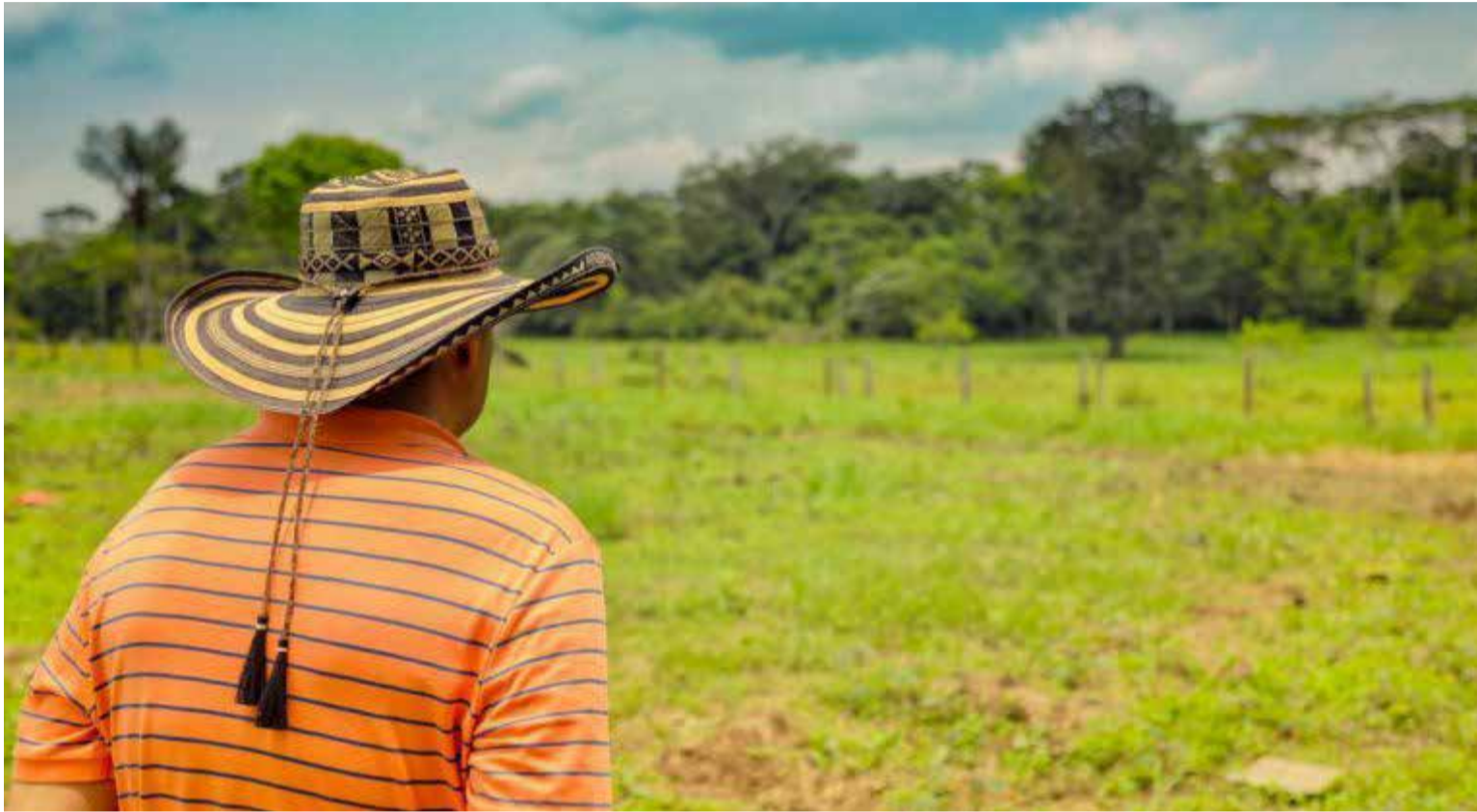
Sujeto que engaña a los campesinos