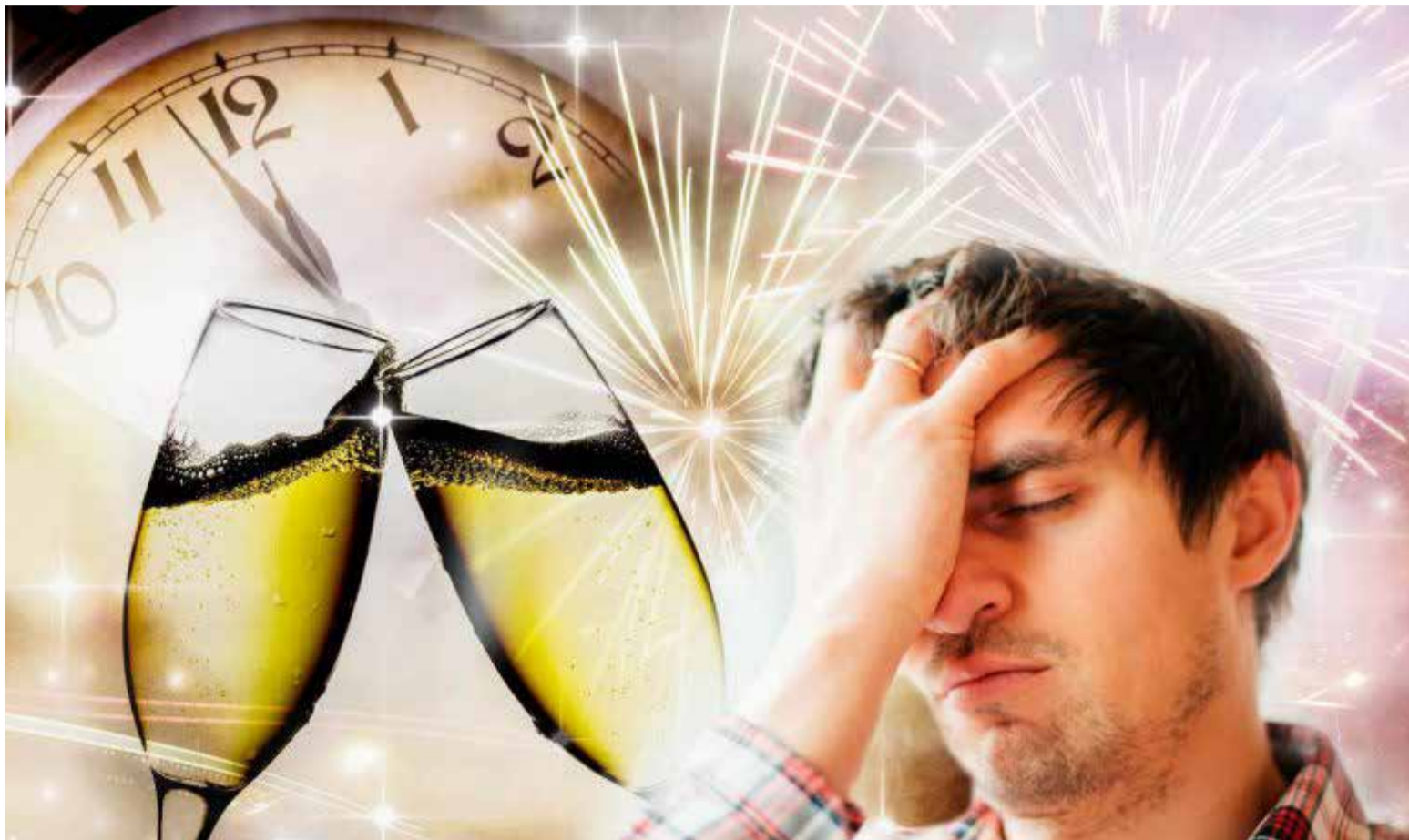
La única forma de no padecer de guayabo es no consumir alcohol. Sin embargo, la gente ha ido inventando trucos caseros para poder tomar sin sufrir al día siguiente.

Esa original mezcla colombiana, que combina lo amargo de la cerveza con lo dulce de la gaseosa, es muy popular para