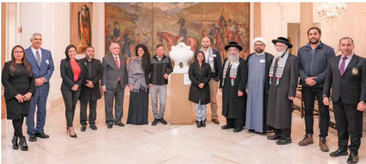
El presidente de la República, Gustavo Petro Urrego, y la ministra de las Culturas, las Artes y los Saberes, Yannai Kadamani, sostendrán este miércoles un encuentro con la diáspora palestina y comunidades de fe progresistas.

En esta reunión, reafirmaron su compromiso con la justicia y los derechos humanos. Donde se abordó el tema de la terminación de la guerra que ha dejado más de 50 mil muertos de Palestina, entre ellos mujeres y niños.