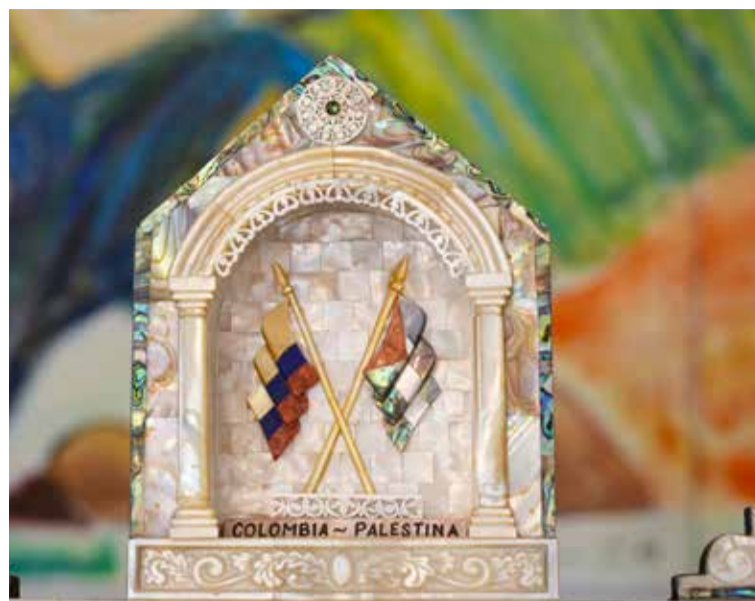
Hermandad entre Colombia y Palestina