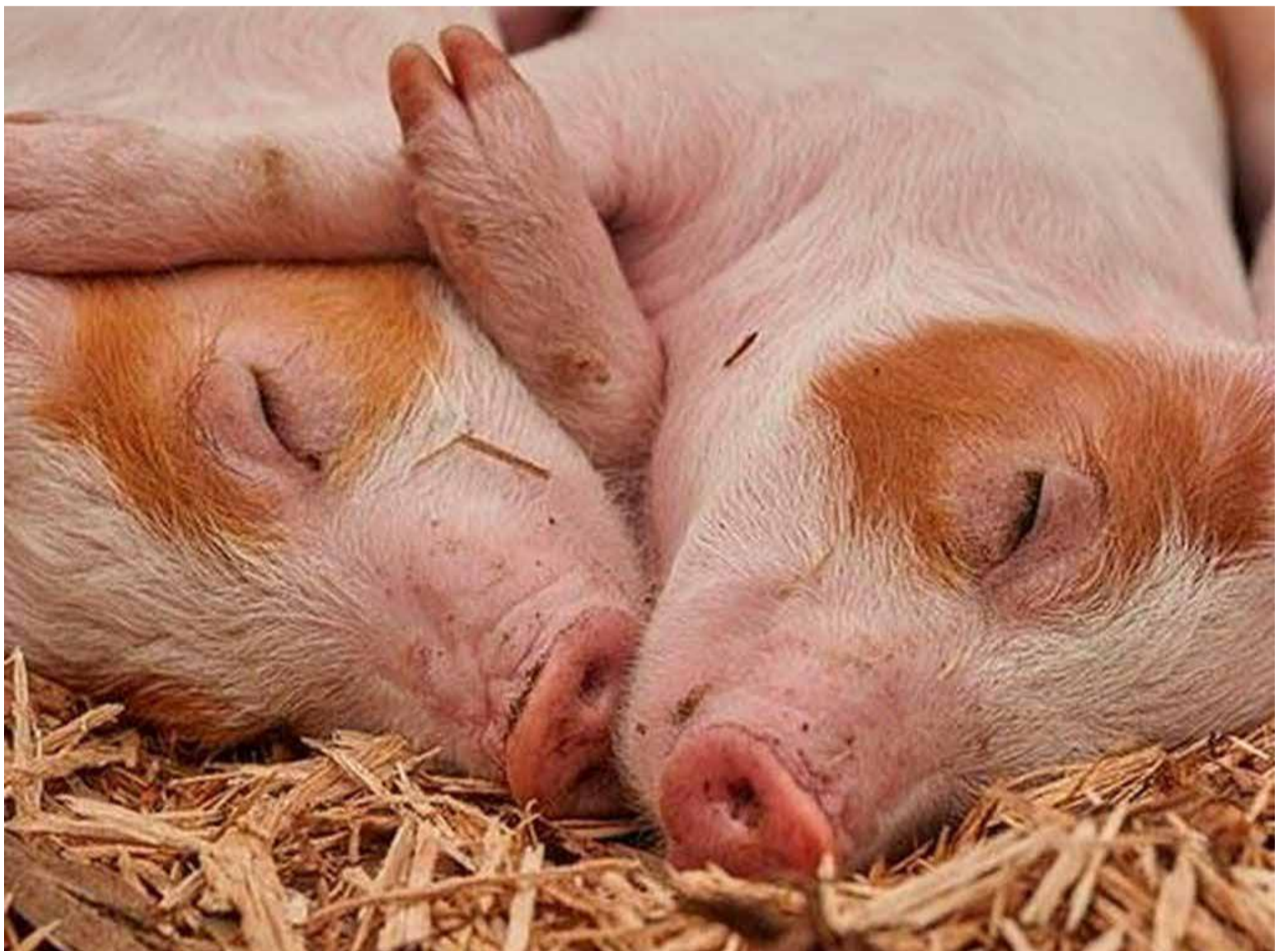
¿Alguna vez te preguntaste por qué a algunos animales los amamos y a otros los comemos?

Cada año, más de 70 mil millones de animales terrestres son asesinados en todo el mundo para convertirse en alimento. Son 50 veces más animales que los que actualmente son masco-