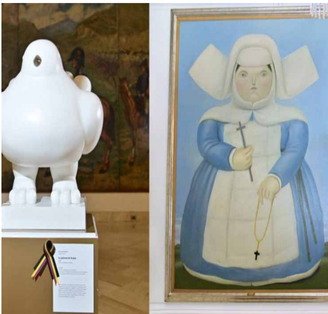
Obras donadas por el maestro Botero a la Presidencia de la República.

adelante meterse de lleno en moldear las formas de los sujetos que aparecían en su mundo fantástico. Ingresó a escudriñar el arte en la Universidad Nacional de Colombia.