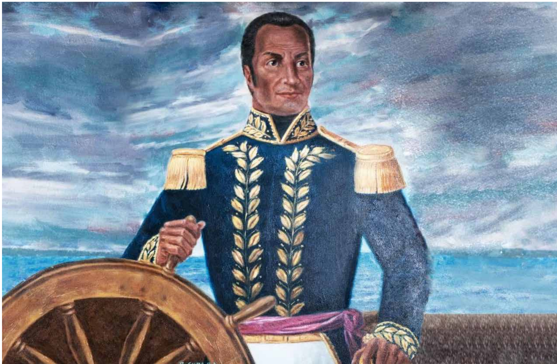
Almirante José Prudencio Padilla López

195 años después de su fusilamiento, el máximo prócer naval colombiano, el Almirante José Prudencio Padilla López fue ascendido, por el presidente de la República Gustavo Petro Urrego, de manera póstuma y honorífica, al grado de Gran Almirante de la Nación.