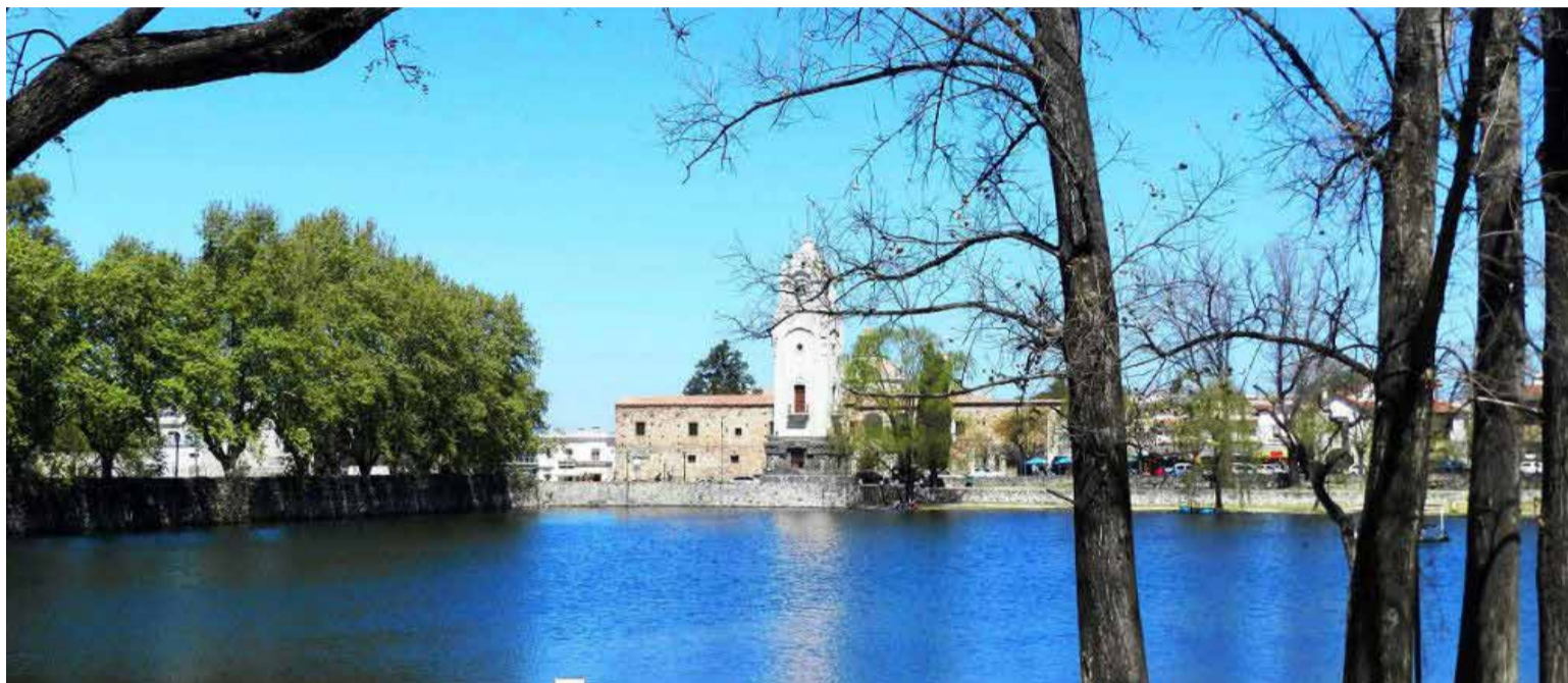
El Tajamar construido por los Jesuitas en 1659

Texto y fotos Lázaro David Najarro Pujol