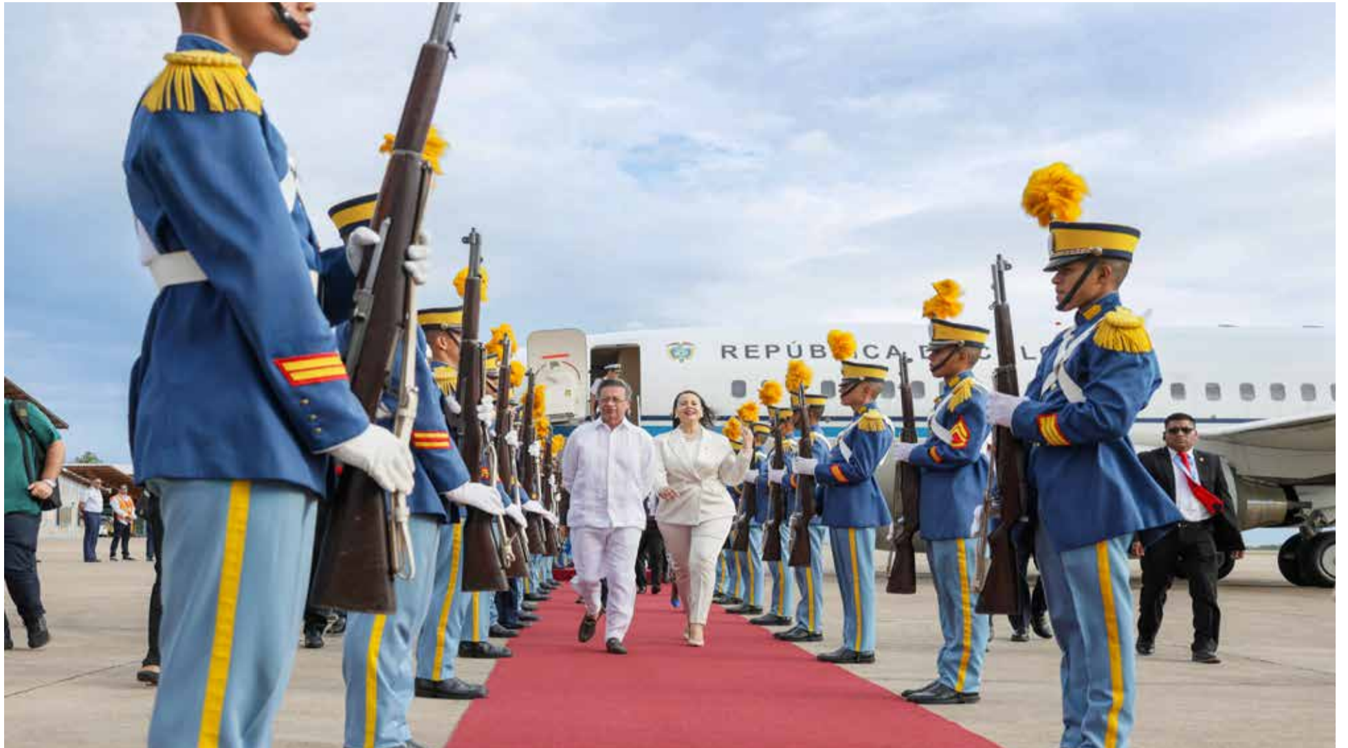
El presidente de los colombianos, Gustavo Petro Urrego, a su llegada a Tegucigalpa recibe los honores de Jefe de Estado.

El presidente Gustavo Petro Urrego en Tegucigalpa, Honduras, recibirá oficialmente la Presidencia Pro Tempore (PPT) de la Comunidad de Estados Latinoamericanos y Caribeños (CELAC), en un acto protocolario que se llevará a cabo hoy encabezado por la presidenta de Honduras, Xiomara Castro.