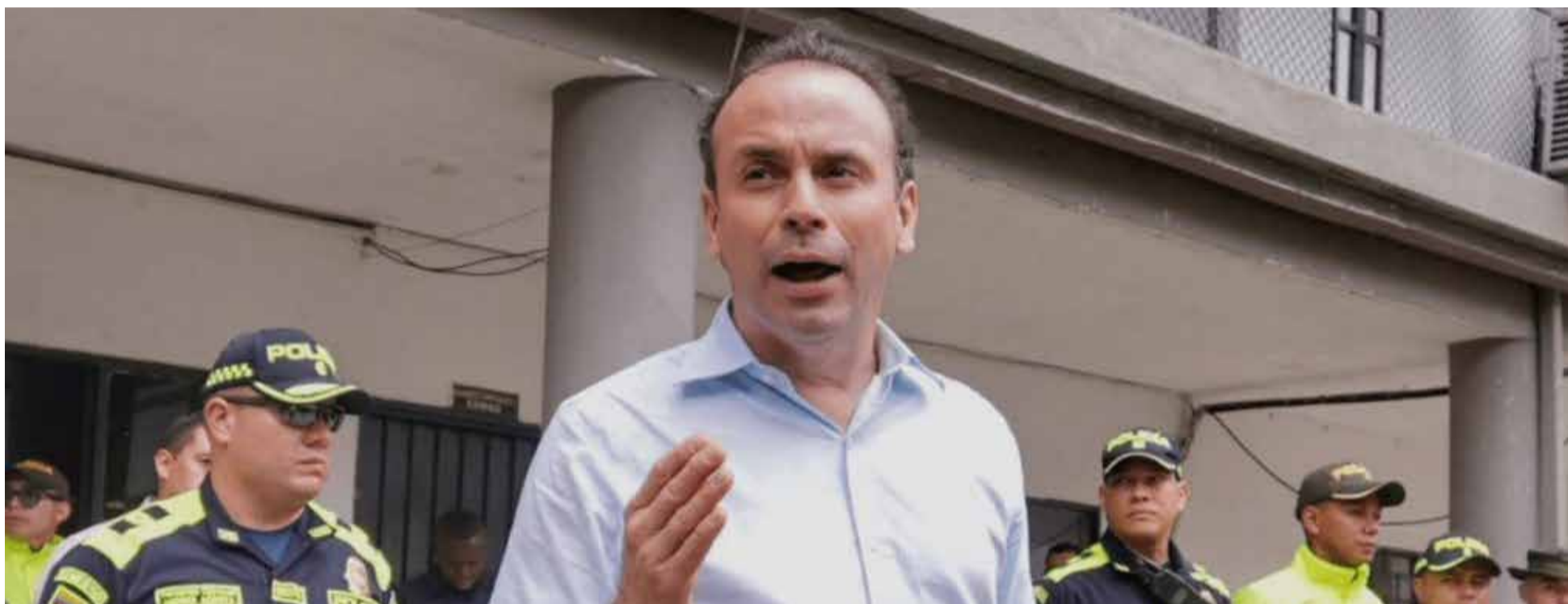
Alejandro Eder, alcalde de Cali, prefiere acercarse al desastre que huir de él.

E l alcalde de Cali, Alejandro Eder, es tan fresco que poco le debe preocupar que en la última encuesta de Pulso País el 63% de los caleños desapruében la manera como maneja a su ciudad y mucho menos que sus ganas de ser presidente de Colombia se las derrumbe la mala fama.