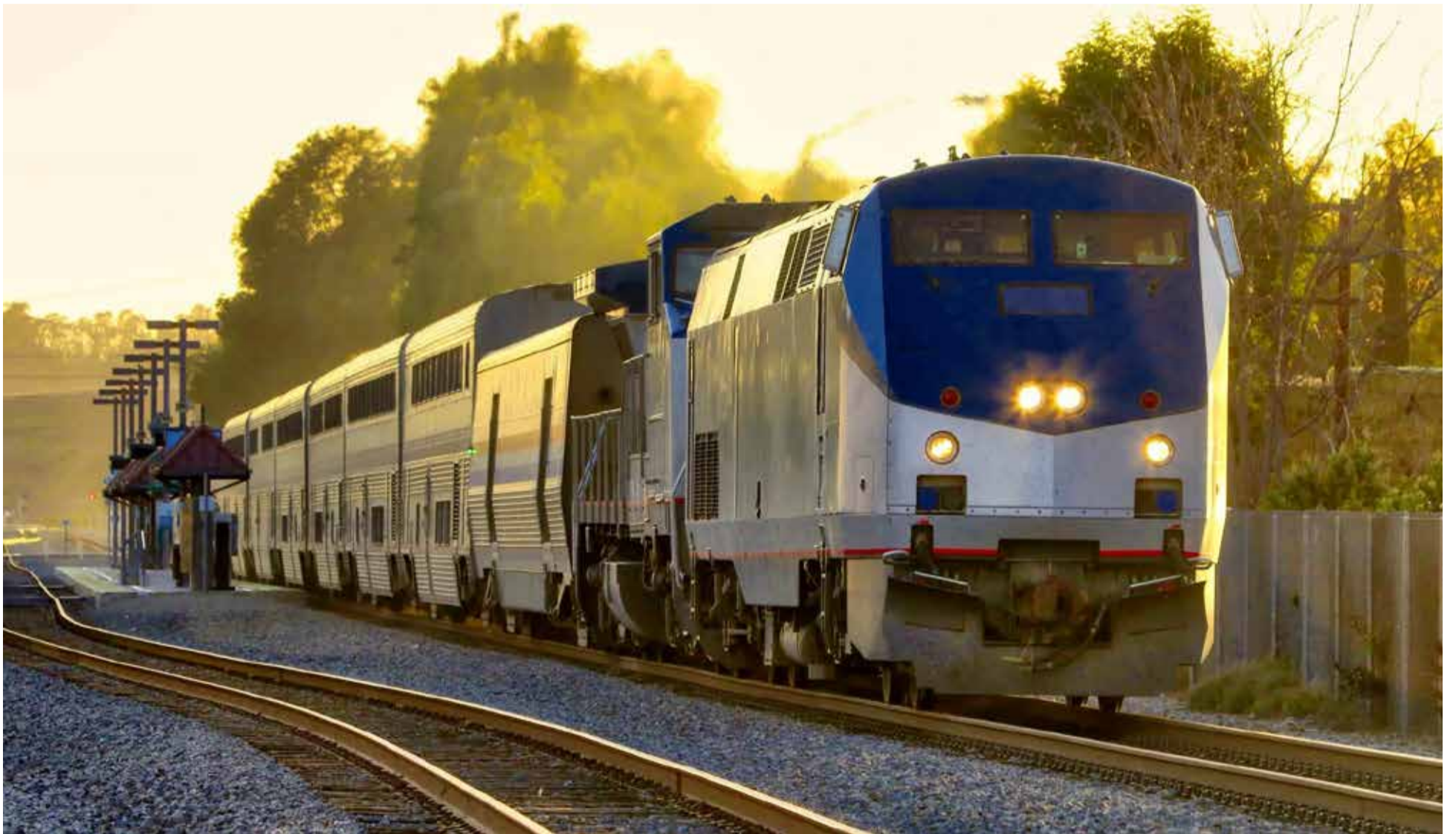
El tren que circulará por buena parte del territorio colombiano.

E l Gobierno adjudicó el contrato de la primera Alianza Público Privada férrea del país. Es un gran paso en la modernización del transporte nacional y bajará notablemente los costos en la movilización de carga.