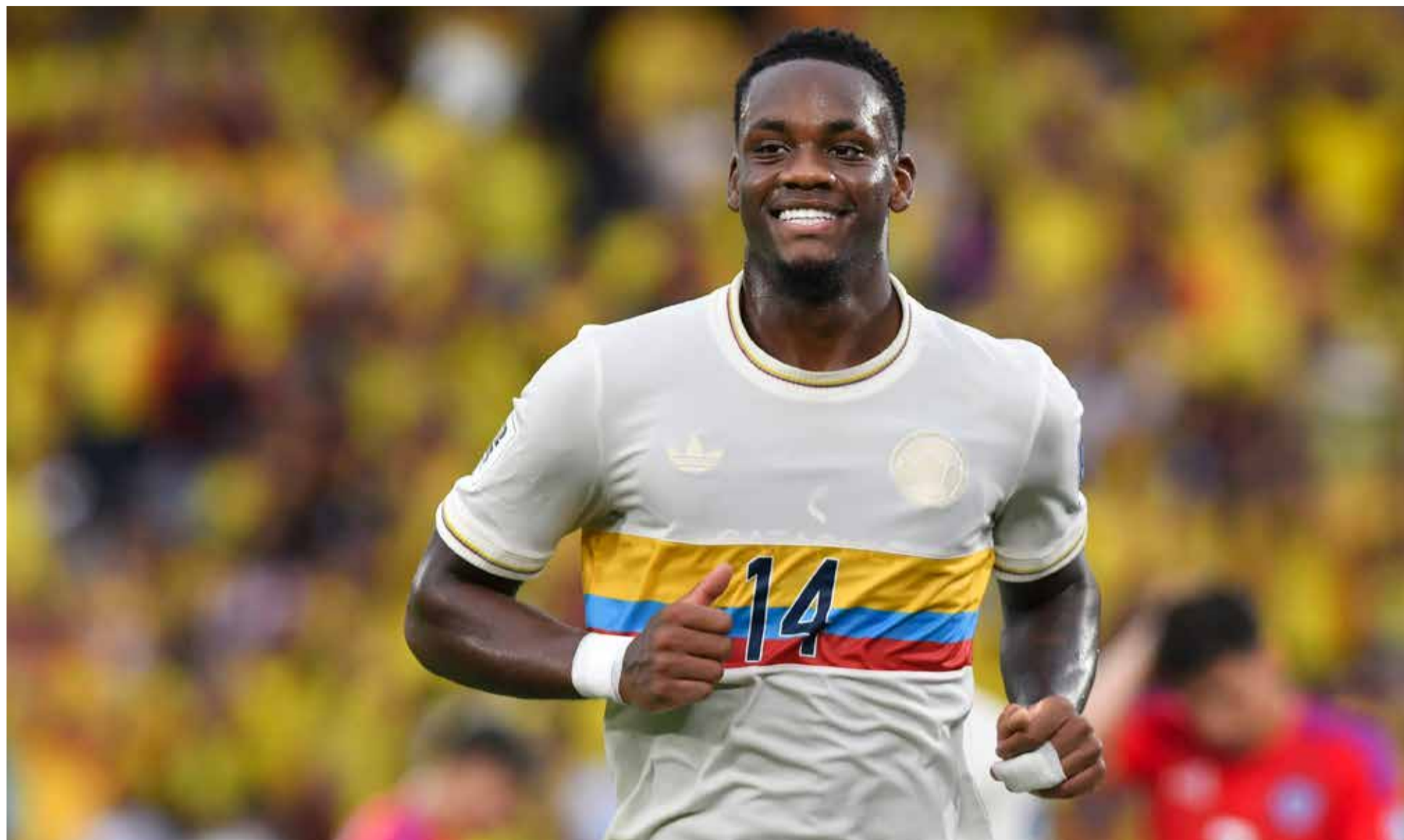
Jhon Jader Durán, el futbolista colombiano cotizado en Europa

J hon Jader Durán terminaría su vinculación con Arabia Saudita a pesar que tiene firmado con contrato hasta el 2030.