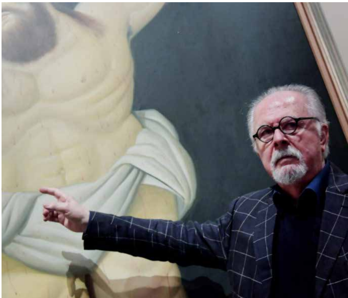
Fernando Botero Q.E.P.D.

El destino le tenía deparado que su futuro era la paleta de colores, que podía calcar lo que el ojo y el espíritu le ofrecían para llevarlo a través de sus trazos de genialidad con el pincel y más