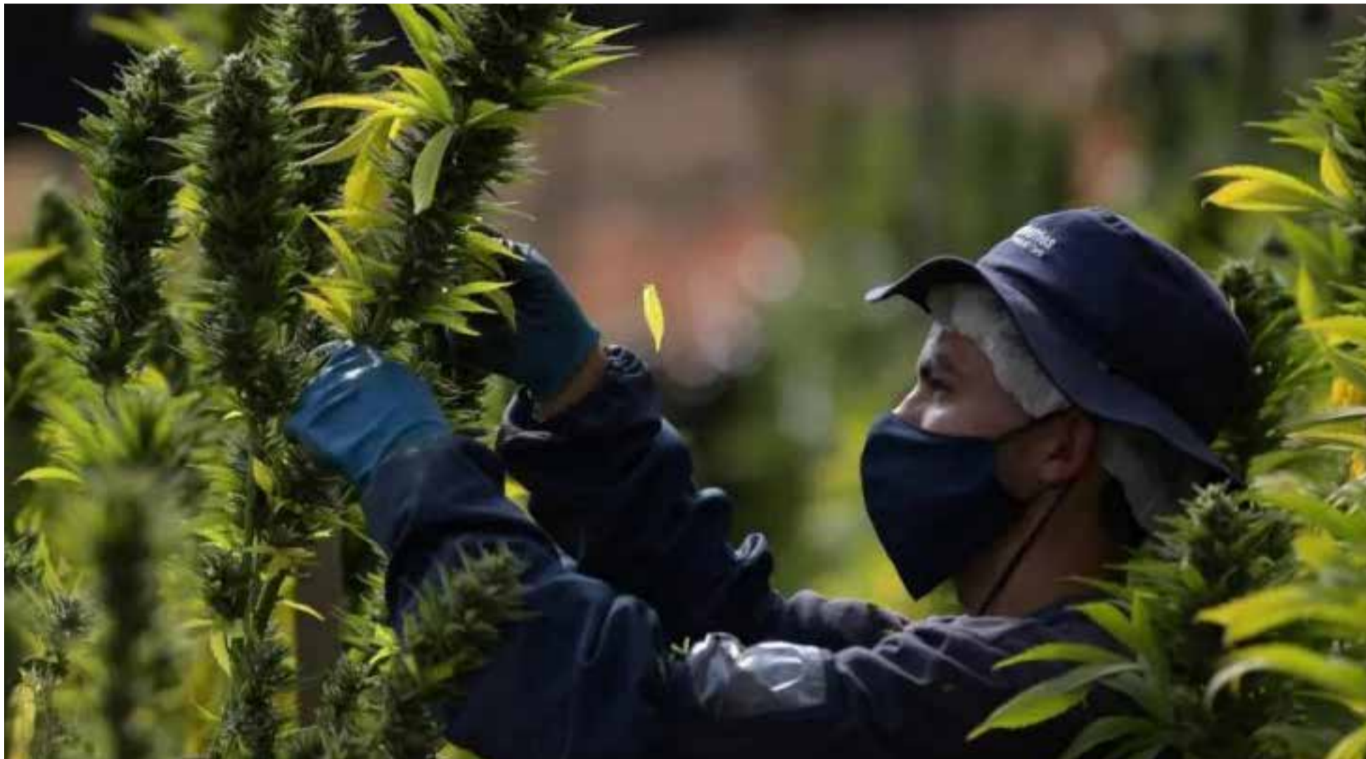
Colombia ha tenido los mejores éxitos contra la droga

La Política de Drogas de Gobierno del Cambio, la creación de la Jurisdicción Agraria y el funcionamiento de la Instancia de Articulación entre la JEP y el Gobierno fueron destacadas como logros de Colombia en el informe anual emitido por la Oficina del Alto Comisionado de Naciones Unidas para los Derechos Humanos (ACNUDH).