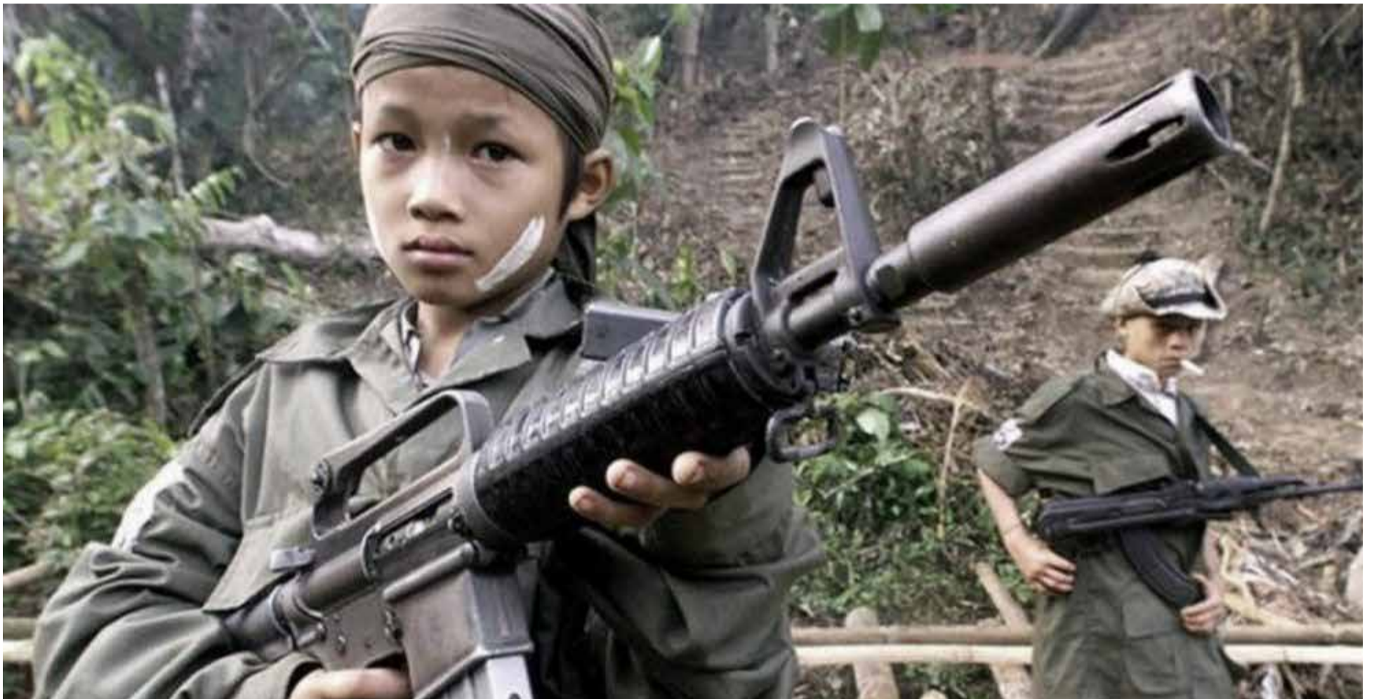
Menores reclutados por grupos ilegales.

El reclutamiento ilícito de menores en Colombia se redujo un 18 % entre enero y marzo de 2025, según cifras presentadas por el ministro de Defensa, Pedro Sánchez, ante el Congreso. El funcionario atribuyó esta disminución a las acciones de prevención, atención y judicialización