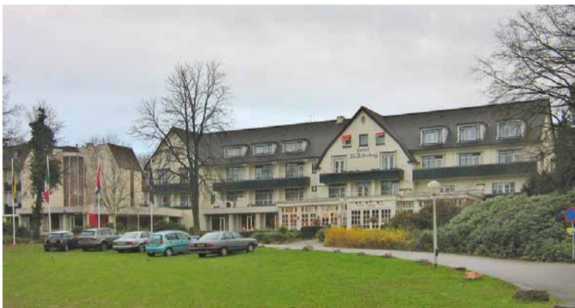
Banqueros, políticos, miembros de la realeza, financieros internacionales o dueños de los principales medios de comunicación, son ejemplos de los miembros del club Bilderberg.