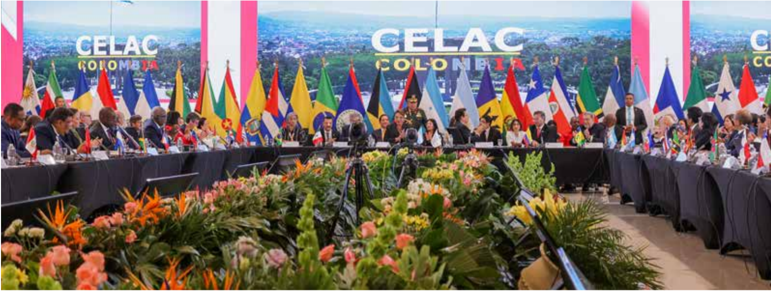
Plenaria de la CELAC