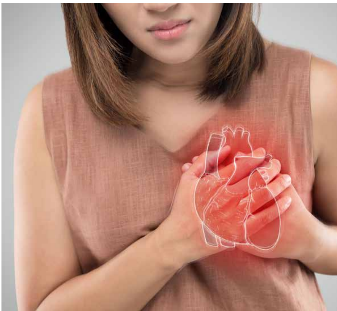
Las mujeres tienen un 18% más de riesgo de morir de infarto agudo de miocardio

En el 2015, las previsiones del Proyecto Global Burden of Disease (Carga Mundial de la Enfermedad) de las Naciones Unidas lo anticiparon: en los próximos 10 años el número muertes prematuras causadas por las enfermedades cardiovasculares en el mundo pasará de 5,9 millones