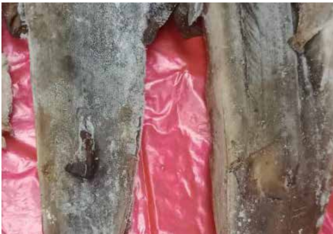
Carne de varios tiburones era comercializada en restaurante del norte de Bogotá

E n operativos de control y seguimiento al tráfico de fauna silvestre, la Secretaría de Ambiente con el apoyo de la Policía Nacional incautaron 5.5 kilogramos de carne de tiburón tollo ( Mustelus sp.) que eran comercializados en un restaurante.