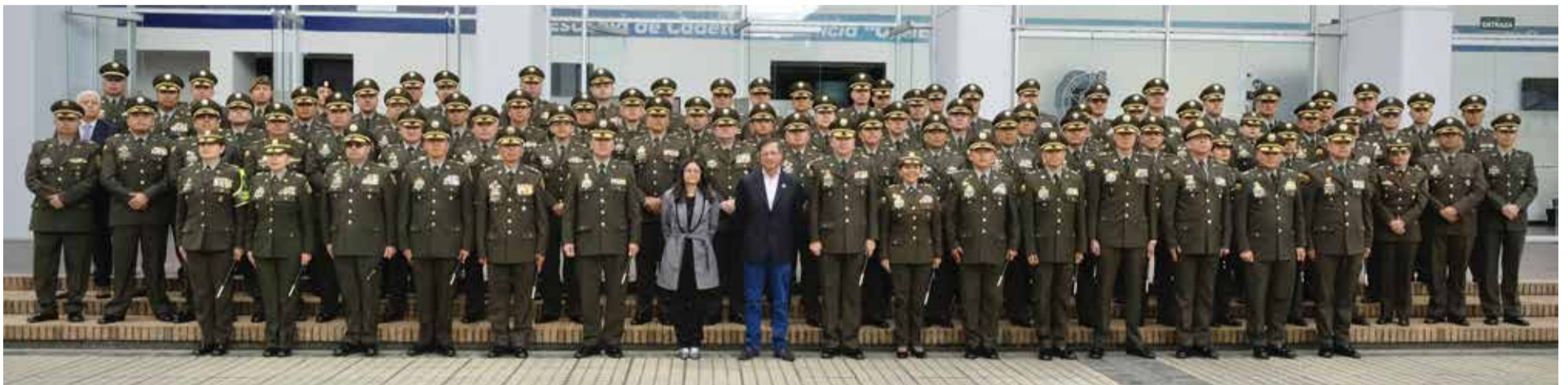
El presidente de Colombia, Gustavo Petro Urrego y los comandantes de Policía de todo el territorio nacional.

D urante el primer encuentro de comandantes de la Policía Nacional en el 2025, que tuvo lugar en la Escuela General Santander, el presidente Gustavo Petro Urrego, manifestó que en la medida que los uniformados reciben salarios por debajo de sus expectativas serán más vulnerables a caer en situaciones de corrupción a manos de la criminalidad, particularmente en las 'ollas' de expendio de drogas.