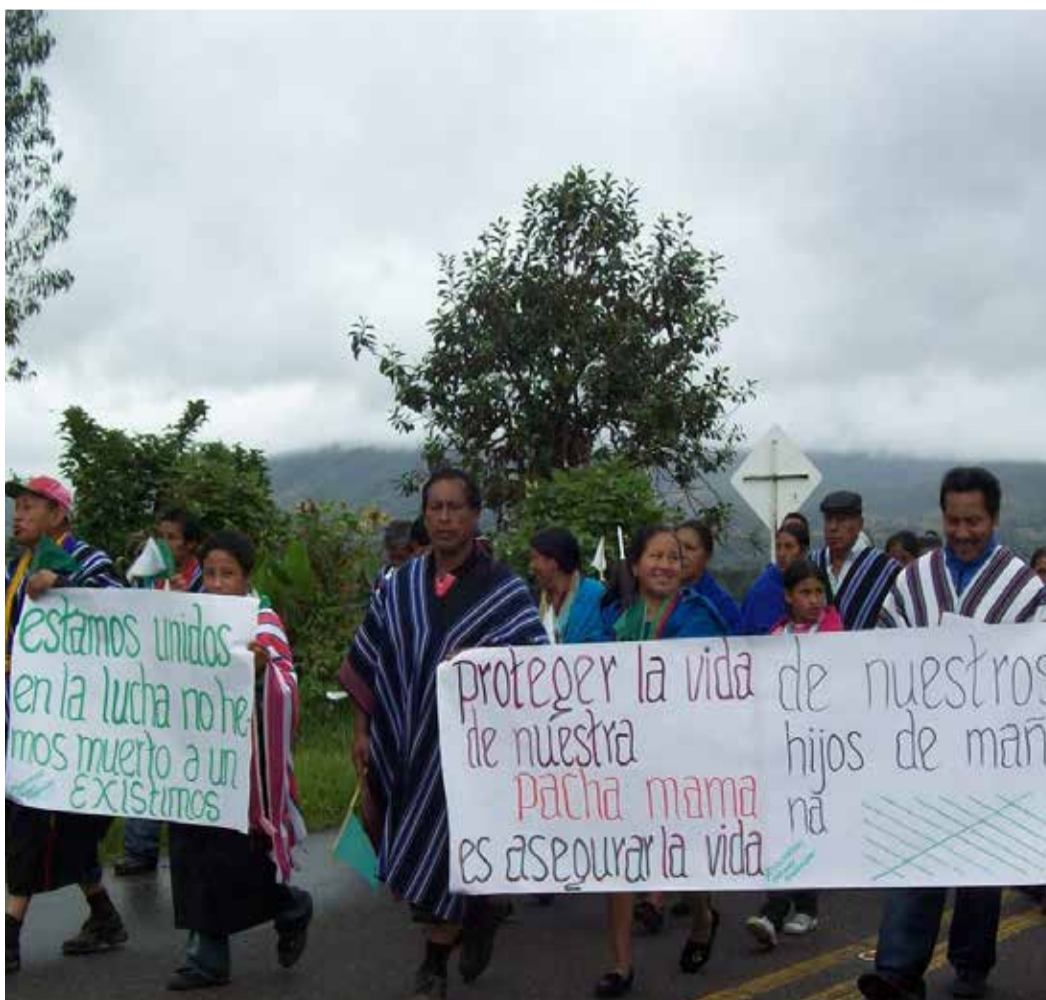
La multinacional Anglo Gold Ashanty tiene concesión para la exploración de cobre y molibdeno en el alto y medio Putumayo, territorio de los pueblos indígenas Inga y Camentsá.