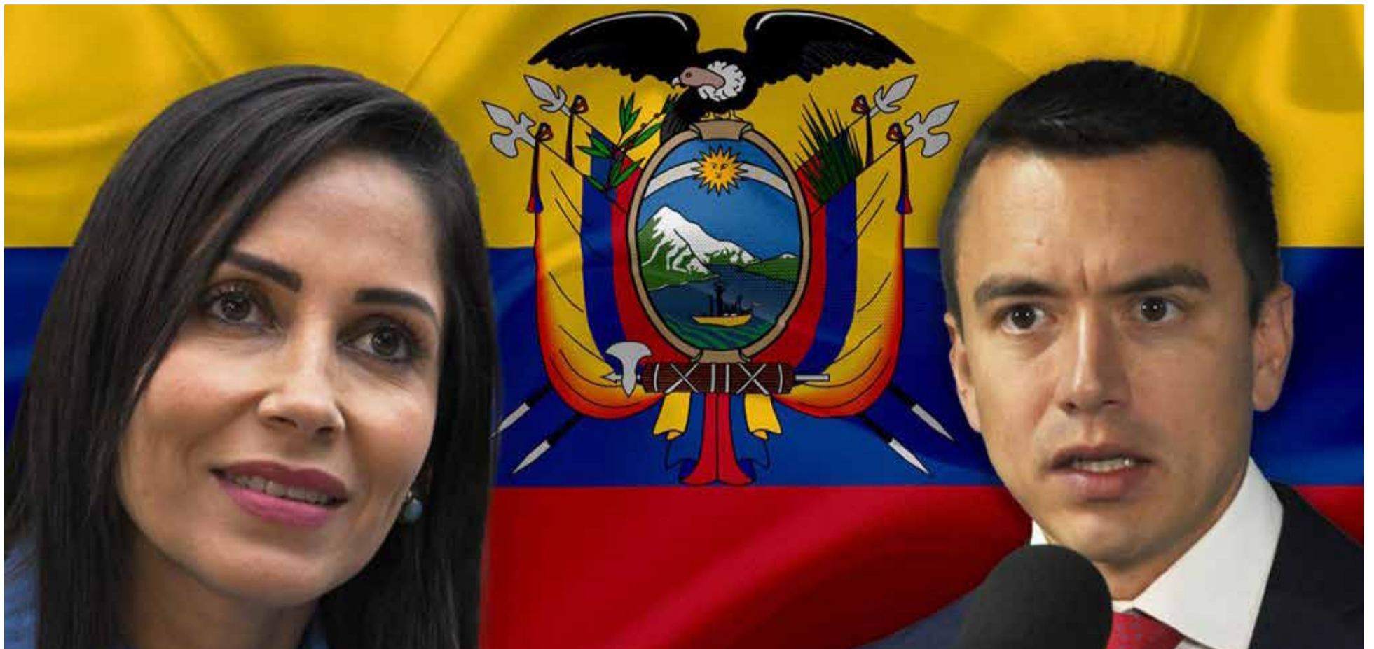
Luisa González y Daniel Noboa, se disputan la presidencia del Ecuador.

E ccuador se encuentra en la recta final de una contienda electoral marcada por la incertidumbre y la polarización, mientras se acerca la segunda vuelta presidencial programada para el domingo 13 de abril de 2025. Los dos candidatos que lograron superar la primera ronda son el actual presidente Daniel Noboa, representando a la derechista Acción Democrática Nacional (ADN), y la abogada Luisa González, abanderada del movimiento de izquierda Revolución Ciudadana.