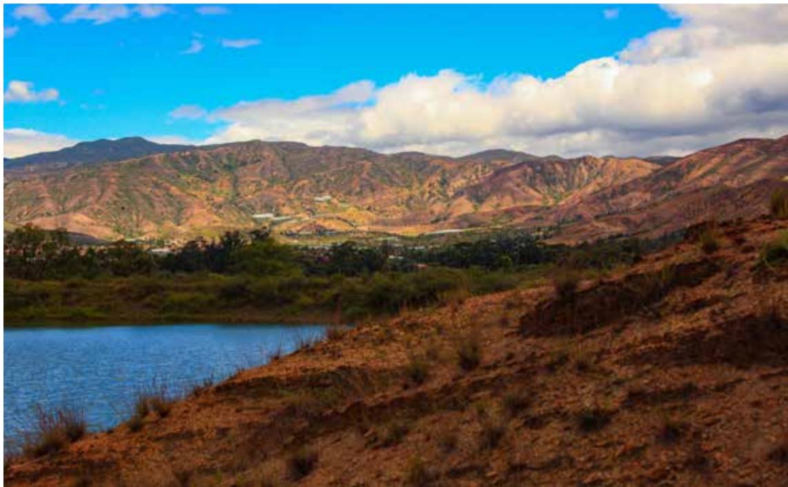
Ubicado a 5 km de Villa de Leyva. Es un lugar mágico de distracción y del amor.

Tisquesusa el último de Zipa de los Muisca, acudía con frecuencia a esa región abandonada de los cultivos para buscar sabiduría en el manejo