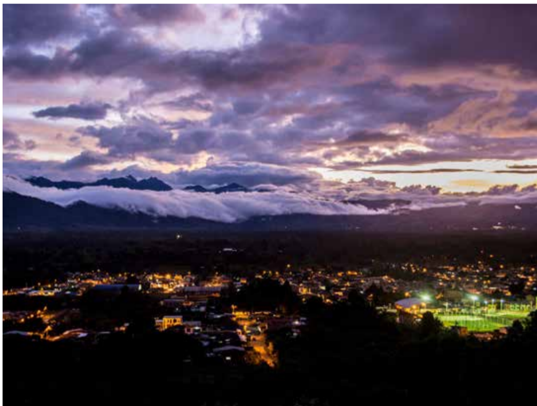
El Valle de Sibundoy es un lugar pluriétnico y multicultural, convergen allí comunidades originarias como los Camentsá, Ingas y Pastos, el campesinado y comunidades negras que decidieron cohabitarlo al ver su belleza andino amazónica.

«En la reflexión con mis mayores, el indígena dio nombre a lo que recorría, Mocoa es Shatjok, Pasto es