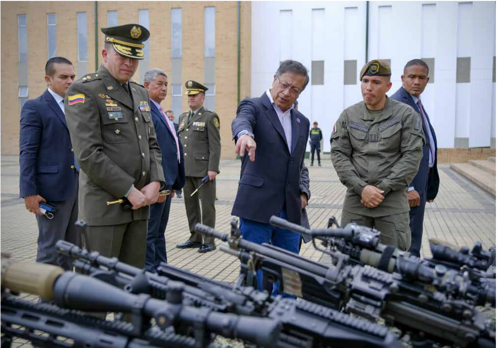
Una inspección del moderno armamento que recibió la policía para garantizar la seguridad de los colombianos.