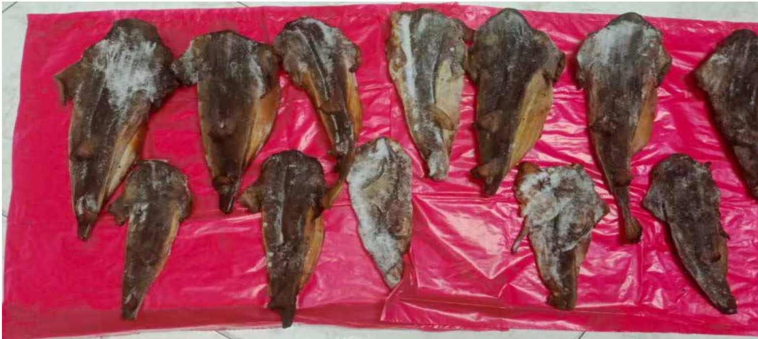
La Resolución 0380 de 2021, que define los recursos pesqueros y determina las especies susceptibles de ser aprovechadas en el territorio nacional, establece que los tiburones y rayas marinas corresponden a recurso hidrobiológico y, por tanto, no pueden ser extraídas con fines comerciales.

termina las especies susceptibles de ser aprovechadas en el territorio nacional, establece que los tiburones y rayas marinas corresponden a recurso hidrobiológico y, por tanto, no pueden ser extraídas con fines comerciales.