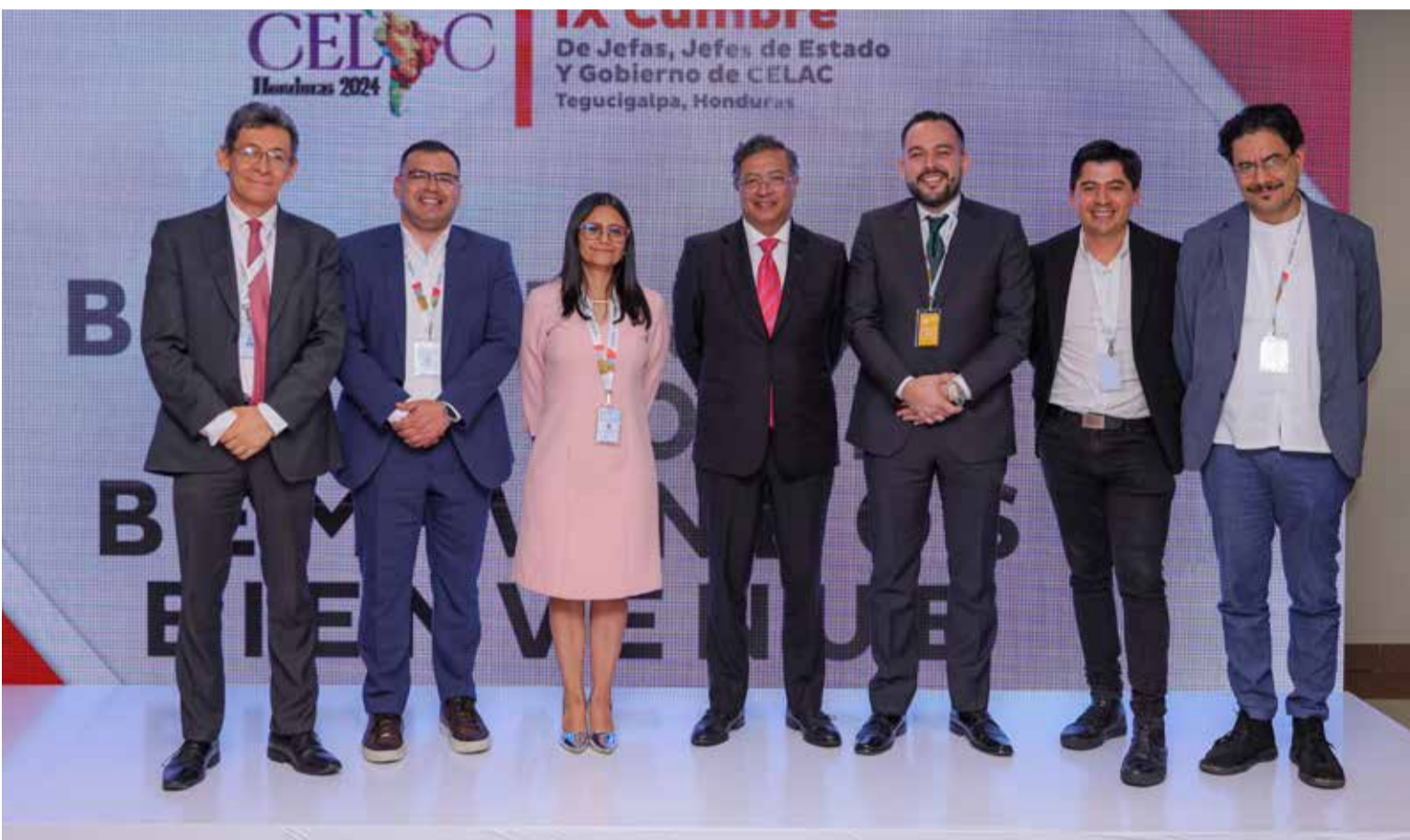
El presidente Petro en compañía de una delegación del Congreso de Colombia.