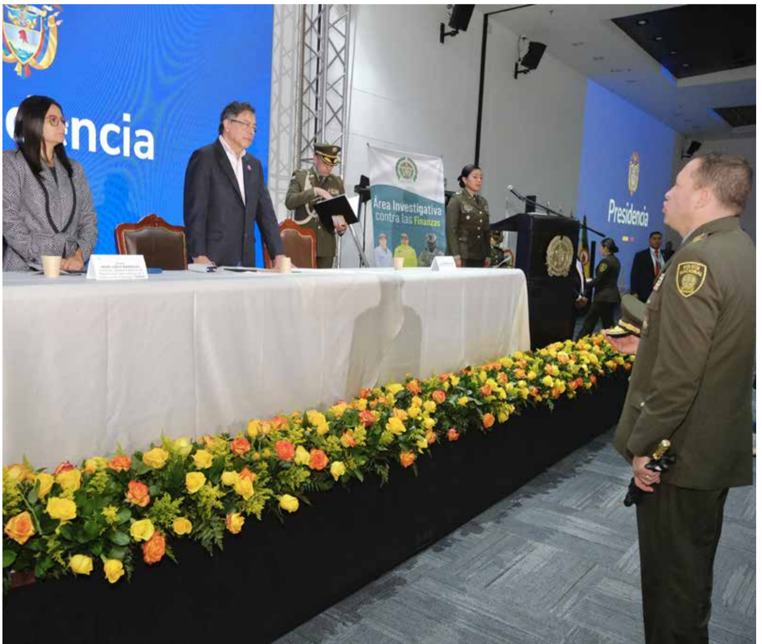
¿Cuánta Policía se va y cuánta queda? ¿Cuánta se va porque quiere y cuánta queda? le preguntó el presidente Petro al director general de la policía, general Carlos Fernando Triana.

En ese sentido, el jefe de Estado ordenó al general Triana presentar el respectivo balance sobre la nivelación salarial en la institución, pero también un reporte sobre ¿cuántos policías se han retirado y la razón de esa salida?