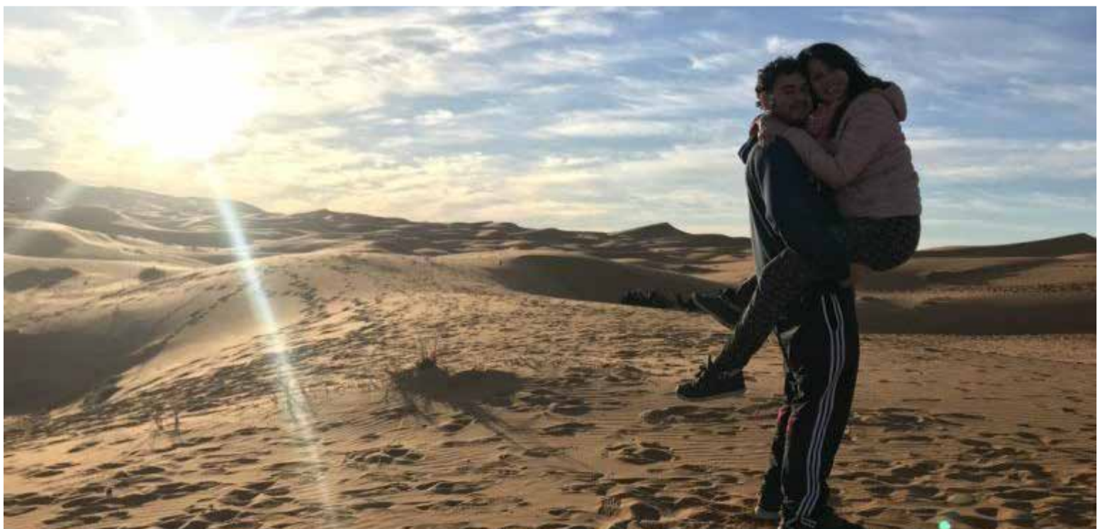
Las parejas acuden al desierto de Villa de Leyva.

Hoy son numerosas las parejas que acuden al desierto de amor para renovar el cariño, tal cual lo hacían los jefes indígenas que habitaban la región y de otras comunidades nativas.