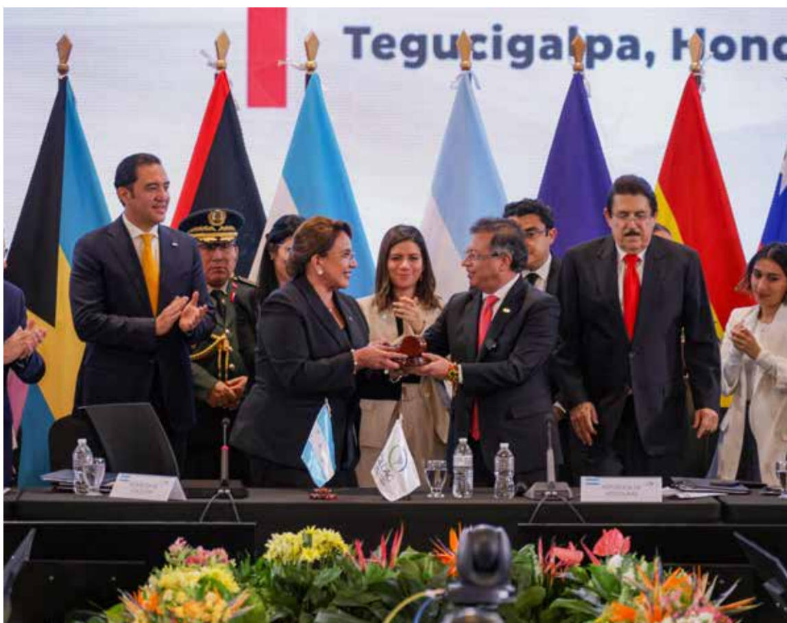
Instante que el presidente de Colombia, Gustavo Petro Urrego, asume la presidencia de la CELAC

Las jefas y jefes de Estado de los 33 países miembros reiteraron la plena vigencia de la Proclama de América Latina y el Caribe como Zona de Paz, subrayando la importancia del respeto al Derecho Internacional, la autodeterminación de los pueblos y la no injerencia en los asuntos internos de los Estados. En línea con ese espíritu, la CE-