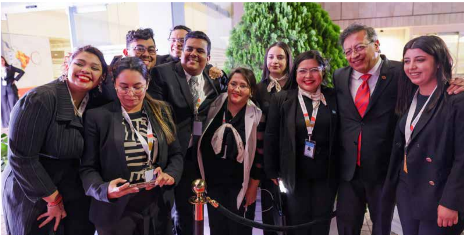
Personal de apoyo de la Cumbre con el presidente de Colombia.

latinoamericano y ninguno mujer, por lo que consideró «oportuna y adecuada» una candidatura que refleje la diversidad y el liderazgo de la región.