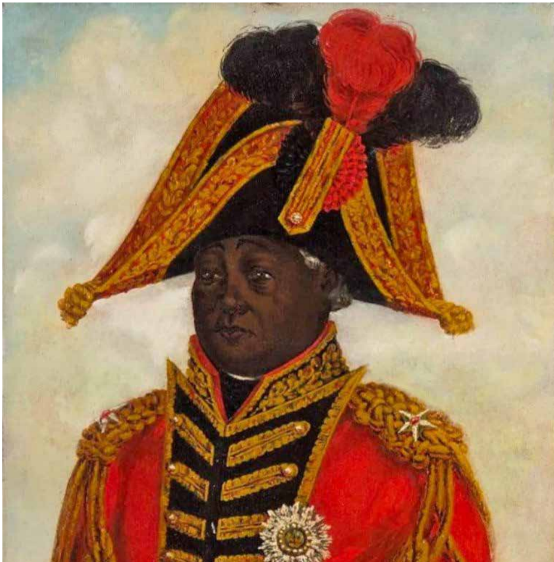
Henri CHRISTOPHE, el «Napoleón Negro»

Henri Christophe, nacido en la isla de Grenada en 1767 y elegido presidente vitalicio de Haití en febrero de 1807, fue opositor del senador Alejandro Petión, dividiéndose Haití en dos Estados. Christophe controlará el norte (feudo tradicional de las facciones negras radicales) en tanto que Pétion lo hará en el sur donde