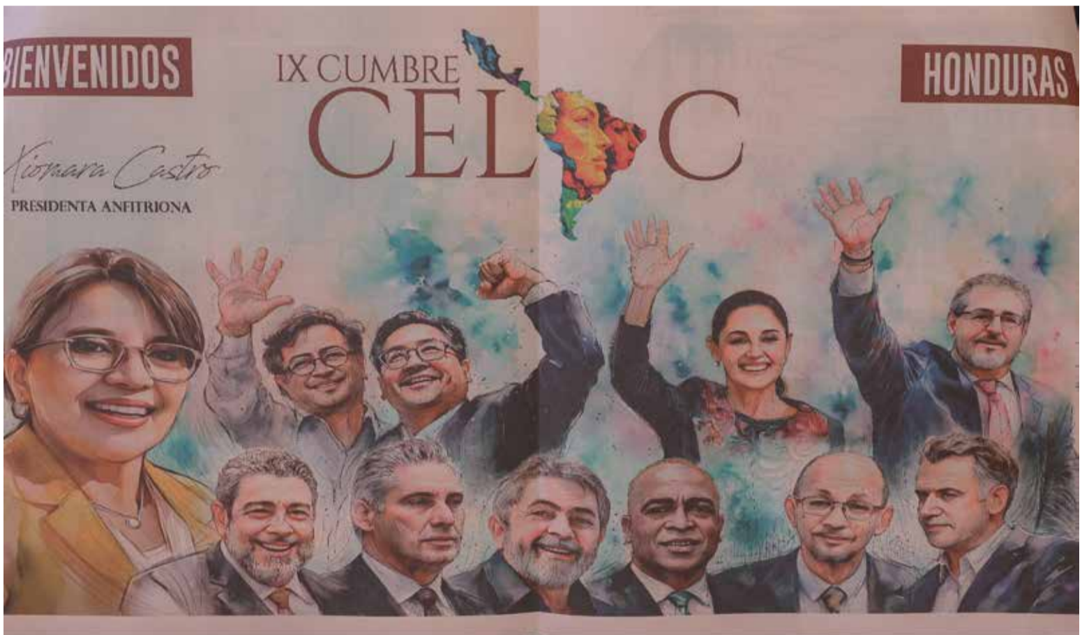
IX Cumbre de Jefas y Jefes de Estado y de Gobierno de la Comunidad de Estados Latinoamericanos y Caribeños (CELAC)

E n el marco de la IX Cumbre de Jefas y Jefes de Estado y de Gobierno de la Comunidad de Estados Latinoamericanos y Caribeños (CELAC), celebrada en Tegucigalpa, la región reafirmó su apuesta por la integración política, el multilateralismo y el trabajo conjunto frente a los desafíos comunes. El encuentro concluyó con la adopción de la Declaración de Tegucigalpa, un documento clave que traza la hoja de ruta del bloque y marca el inicio del liderazgo de Colombia como Presidencia Pro Témpace para el periodo 2025-2026.