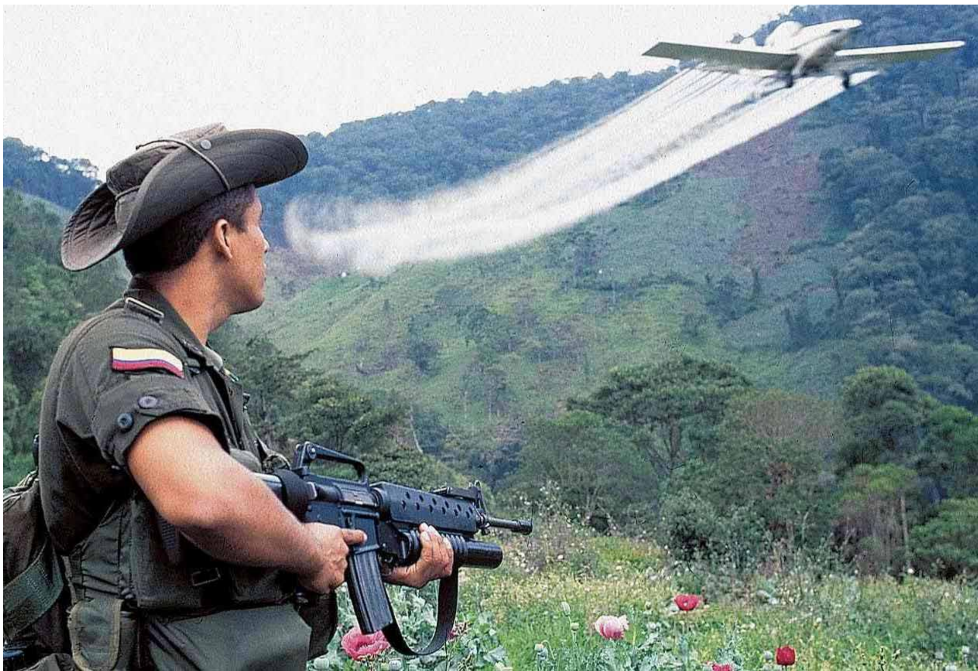
Colombia polemiza sobre la utilización de glifosato en la erradicación de la hoja de coca.

Una creciente confusión rodea la política de erradicación de cultivos ilícitos en Colombia, luego de declaraciones contradictorias emitidas por el presidente, Gustavo Petro Urrego y el ministro de Defensa, Pedro Sánchez Suárez, con respecto al posible uso de glifosato.