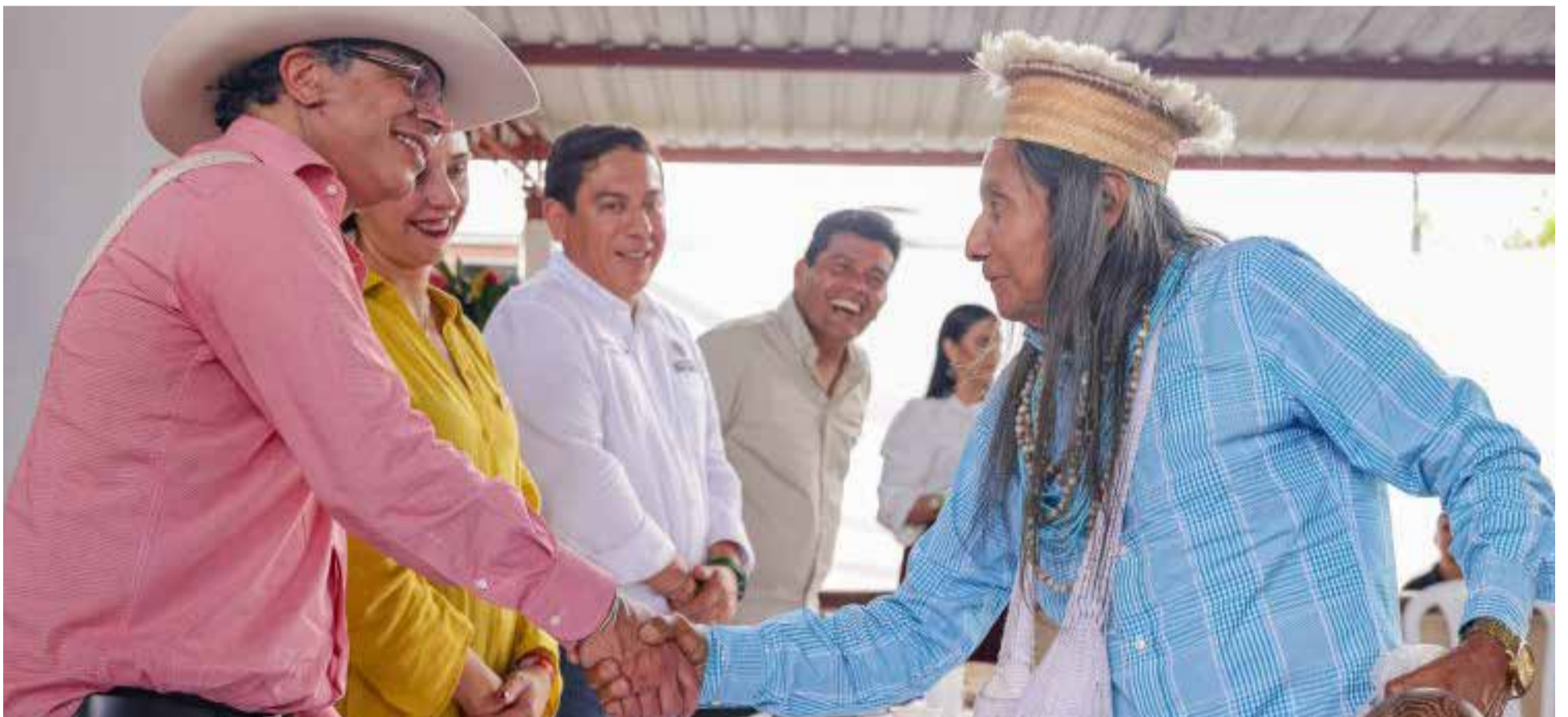
Líderes indígenas celebran la apertura del Centro de Acopio de Cacao