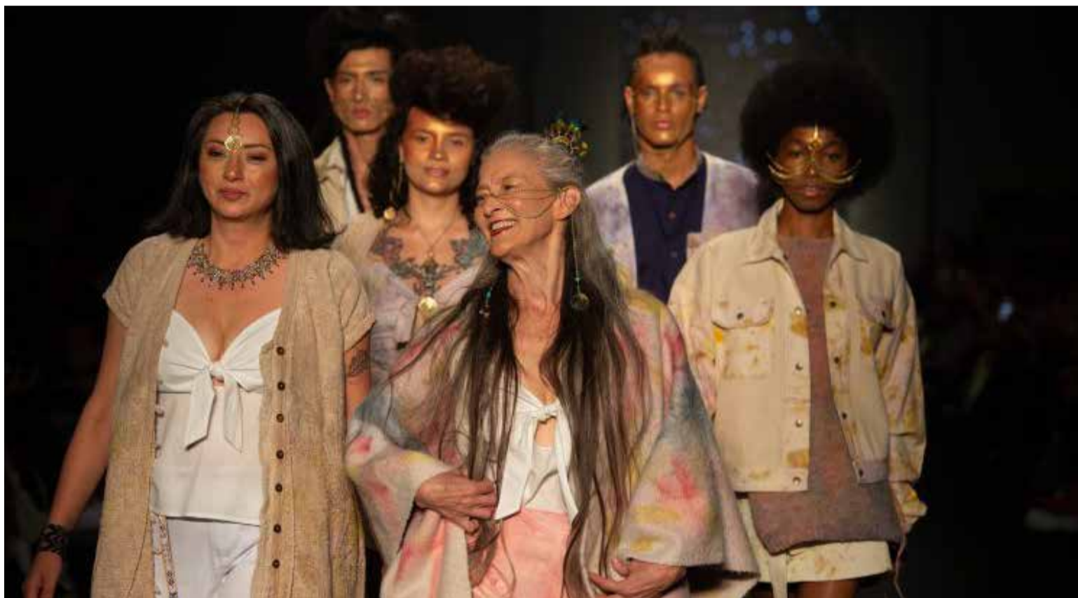
La edición 2025 de BFW presentará la diversidad del talento colombiano a través de siete segmentos especializados.

B ogotá Fashion Week (BFW), la plataforma de promoción y circulación del sector moda impulsada por la Cámara de Comercio de Bogotá (CCB), alista su octava edición para convertir a la capital colombiana en un epicentro de negocios de moda a nivel internacional. Del 20 al 22 de mayo, el centro de convenciones Ágora Bogotá será el escenario de este evento que reunirá a 140 diseñadores y marcas independientes, seleccionados tras un exigente proceso de curaduría y formación empresarial.