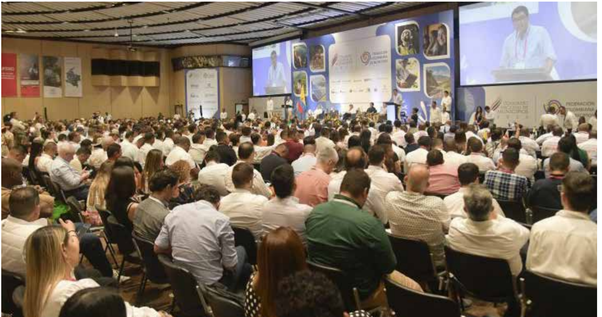
Más de mil alcaldes de Colombia se congregaron para debatir desafíos y soluciones para sus territorios.