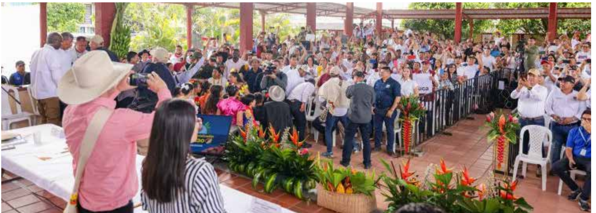
Los cacaoteros tuvieron la oportunidad de realizar propuestas para buscar el desarrollo de esa región