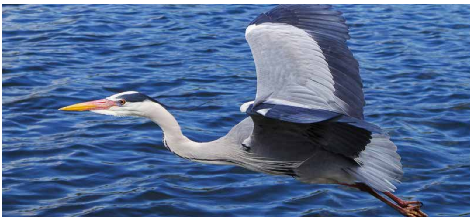
Las garzas vuelan con el cuello retraído y pausadamente