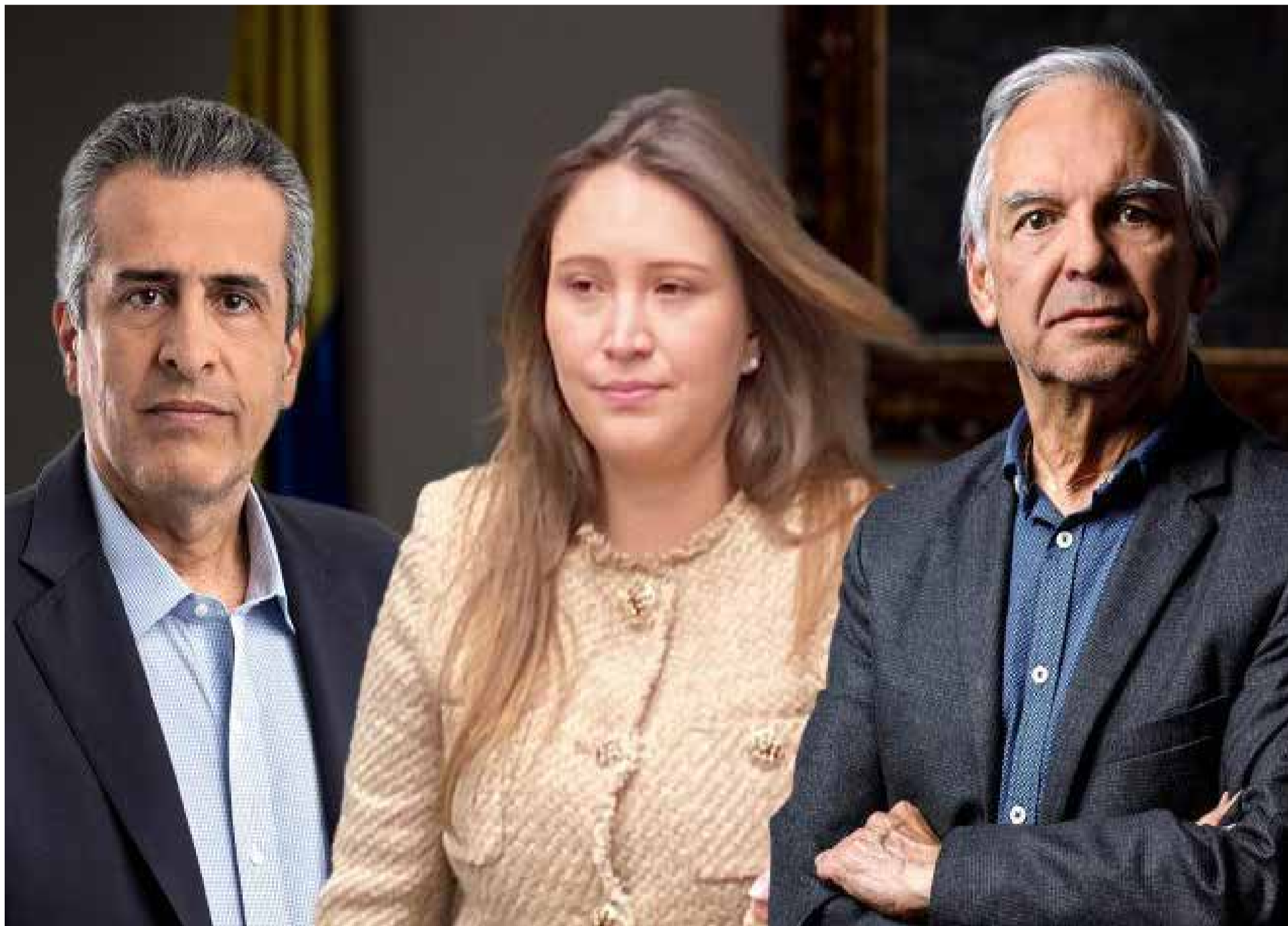
«Benavides Canta»: Enlace de Hacienda Delata a Velasco y Bonilla en Caso UNGRD