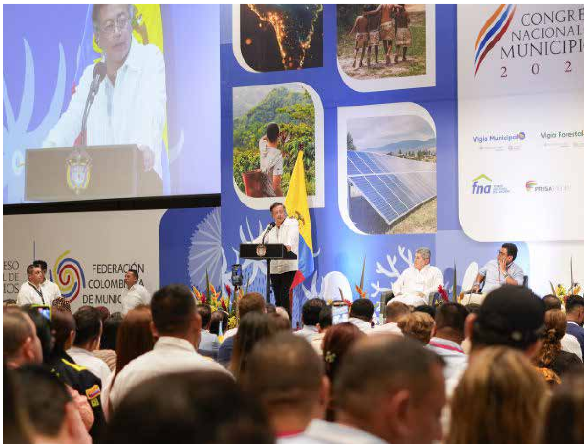
EPA Colombia, Símbolo de Justicia Errada. Petro aboga por justicia restaurativa, priorizando reparación sobre cárcel.