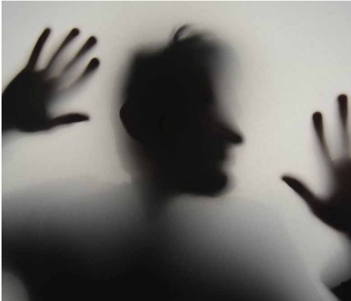
El 80 % de las personas con trastorno bipolar en Colombia no han sido diagnosticadas.

Se descubrió que el calcio, segundo mensajero en la comunicación de las neuronas, se liberaba más de lo normal dentro