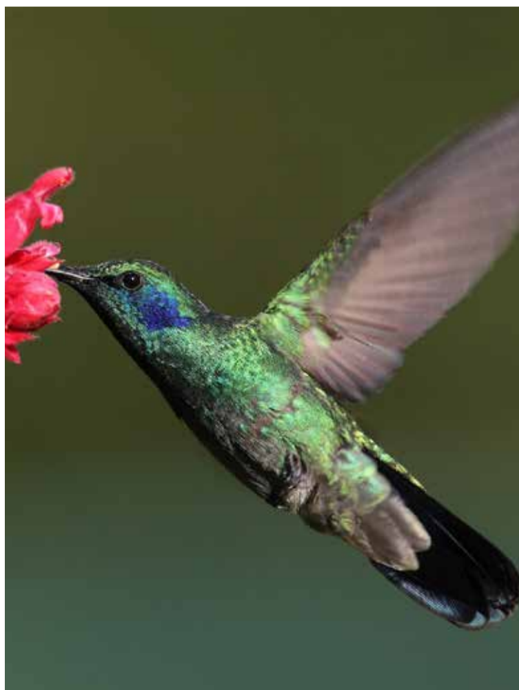
Colibrí verdemar libando néctar.

país y consolidar destinos emergentes que, gracias a estas actividades, fortalecen sus economías sociales».