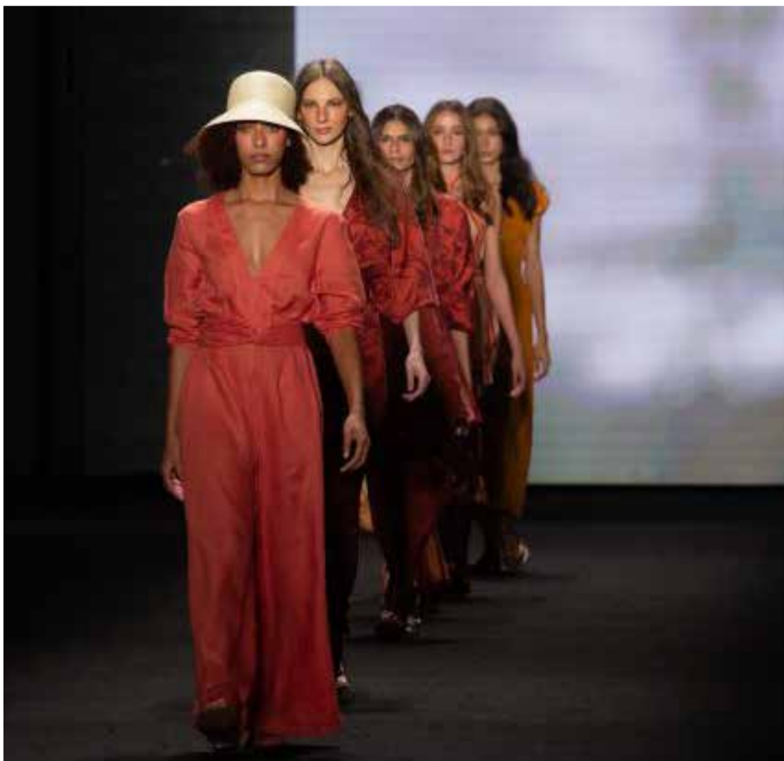
Bogotá Fashion Week 2025 se presenta como una plataforma clave para el crecimiento y la internacionalización del sector moda colombiana.