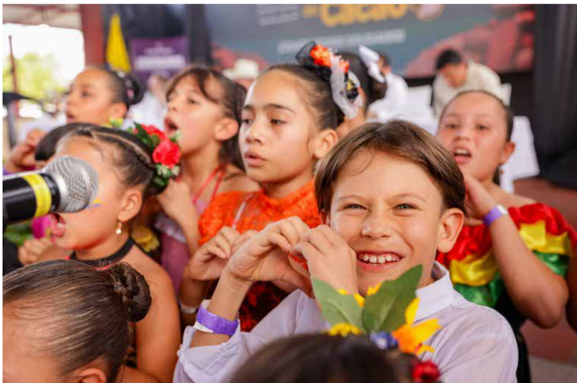
Los niños de Arauca y Boyacá le dieron la bienvenida al Jefe del Estado.

El presidente Gustavo Petro inauguró ayer cuatro centros de acopio y estandarización de cacao en Arauca y Cubará (Boyacá), una inversión de $620 millones de la Unidad Solidaria para fortalecer la producción, agroindustria y comercialización justa. Estos centros, parte de un circuito asociativo, buscan estandarizar miles de toneladas anuales, beneficiando a múltiples organizaciones y comunidades productoras.