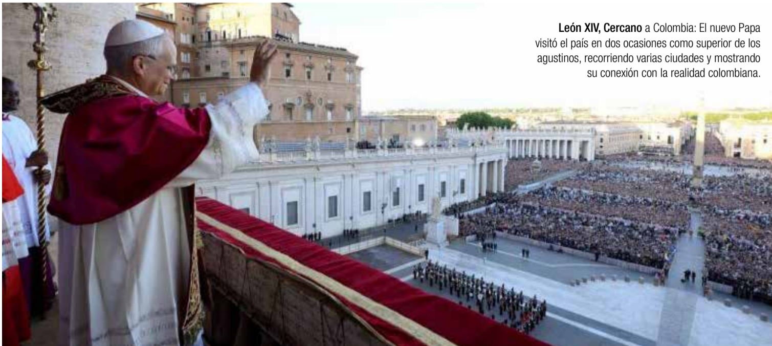
León XIV, Cercano a Colombia: El nuevo Papa visitó el país en dos ocasiones como superior de los agustinos, recorriendo varias ciudades y mostrando su conexión con la realidad colombiana.

la potencial injerencia de figuras políticas como Trump en la Iglesia Católica y mantener una postura imparcial ante conflictos globales como el de la Franja de Gaza e Israel y la guerra entre Rusia y Ucrania.