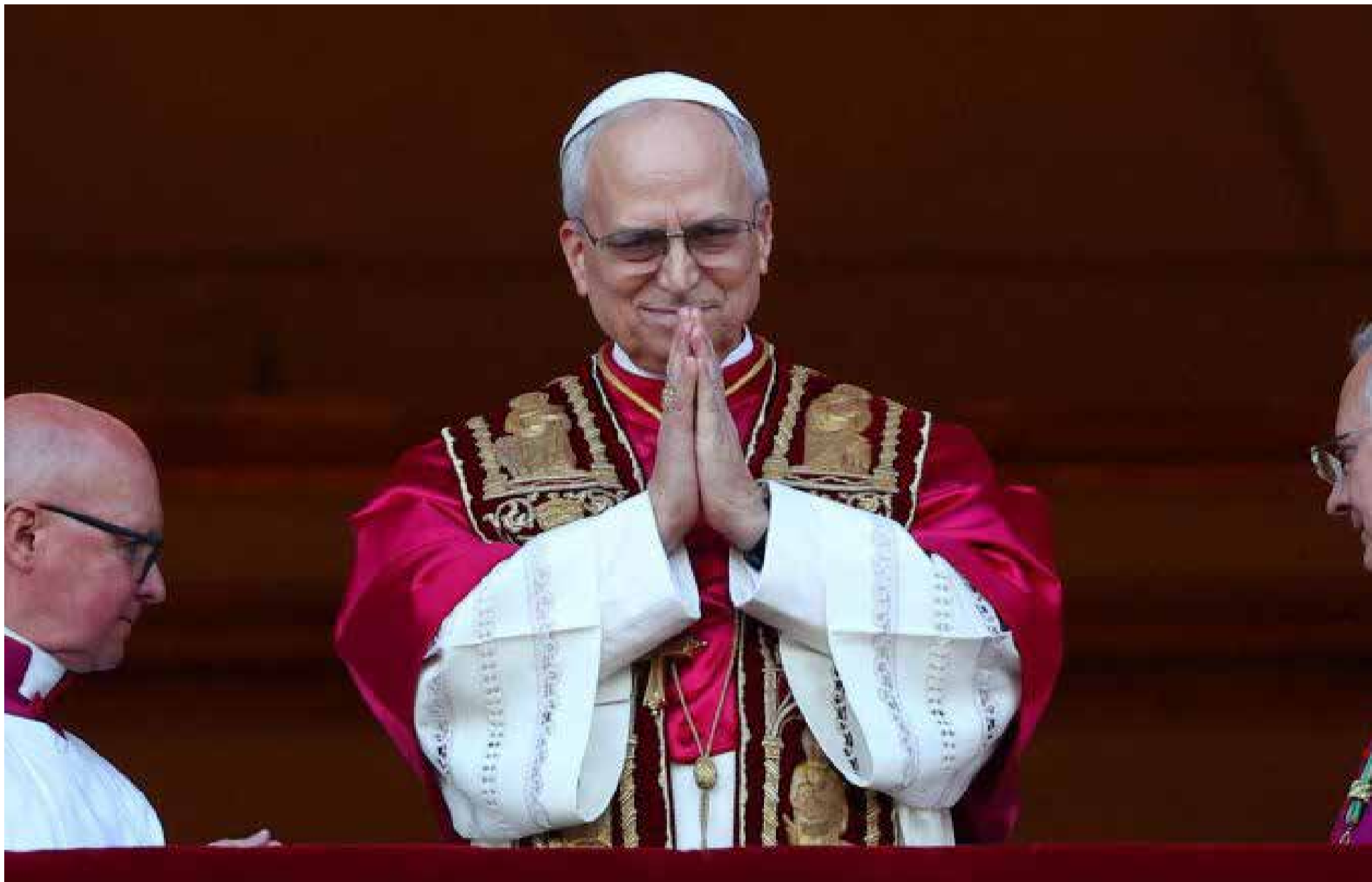
Robert Francis Prevost, de 69 años, ha sido elegido como el nuevo Papa de la Iglesia Católica, tomando el nombre de León XIV.

T ras un cónclave que mantuvo al mundo en vilo, el cardenal estadounidense Robert Francis Prevost, de 69 años, ha sido elegido como el nuevo Papa de la Iglesia Católica, tomando el nombre de León XIV. El anuncio se realizó ayer, jueves 8 de mayo de 2025, desde el balcón central de la Basílica de San Pedro en el Vaticano, desatando júbilo entre los fieles congregados en la plaza y marcando un hito al ser el primer Papa nacido en Estados Unidos.