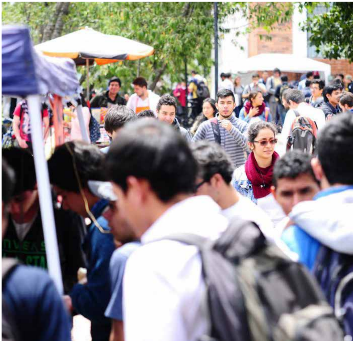
El 60 % de las personas diagnosticadas en Colombia son jóvenes entre los 18 y 23 años.

de estas, y que la respuesta eléctrica es mayor, lo que significa que su impulso (señal transmitida entre estas células) aumentaba. Como las células miden una centésima de milímetro, su actividad se registraba por medio de minielectrodos que, conectados a un amplificador ultrasensible, detecta los diminutos cambios eléctricos producidos.